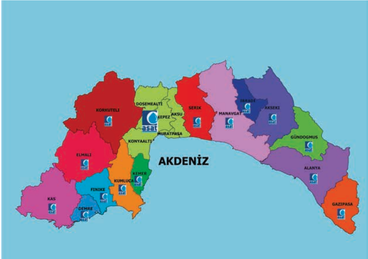
ASAT GENEL MÜDÜRLÜĞÜ HİZMET BİRİMLERİ HARİTASI

İdaremiz Kepez İlçesi Fabrikalar Mahallesi'nde yer alan Genel Müdürlüğümüz Merkez Binası başta olmak üzere 6360 sayılı yasa ile birlikte tüm ilçelerimizde vatandaşlarımıza hizmet vermekteyiz.