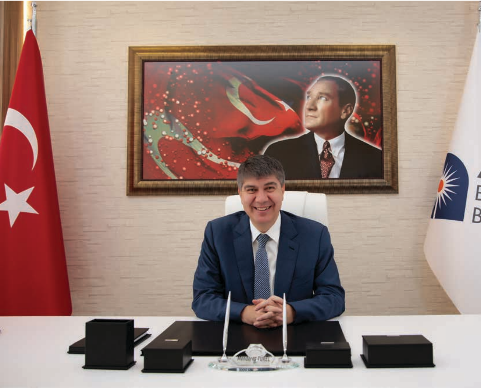
Menderes TÜREL Antalya Büyükşehir Belediye Başkanı