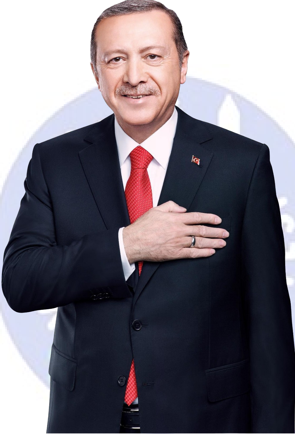
RECEP TAYYİP ERDOĞAN CUMHURBAŞKANI