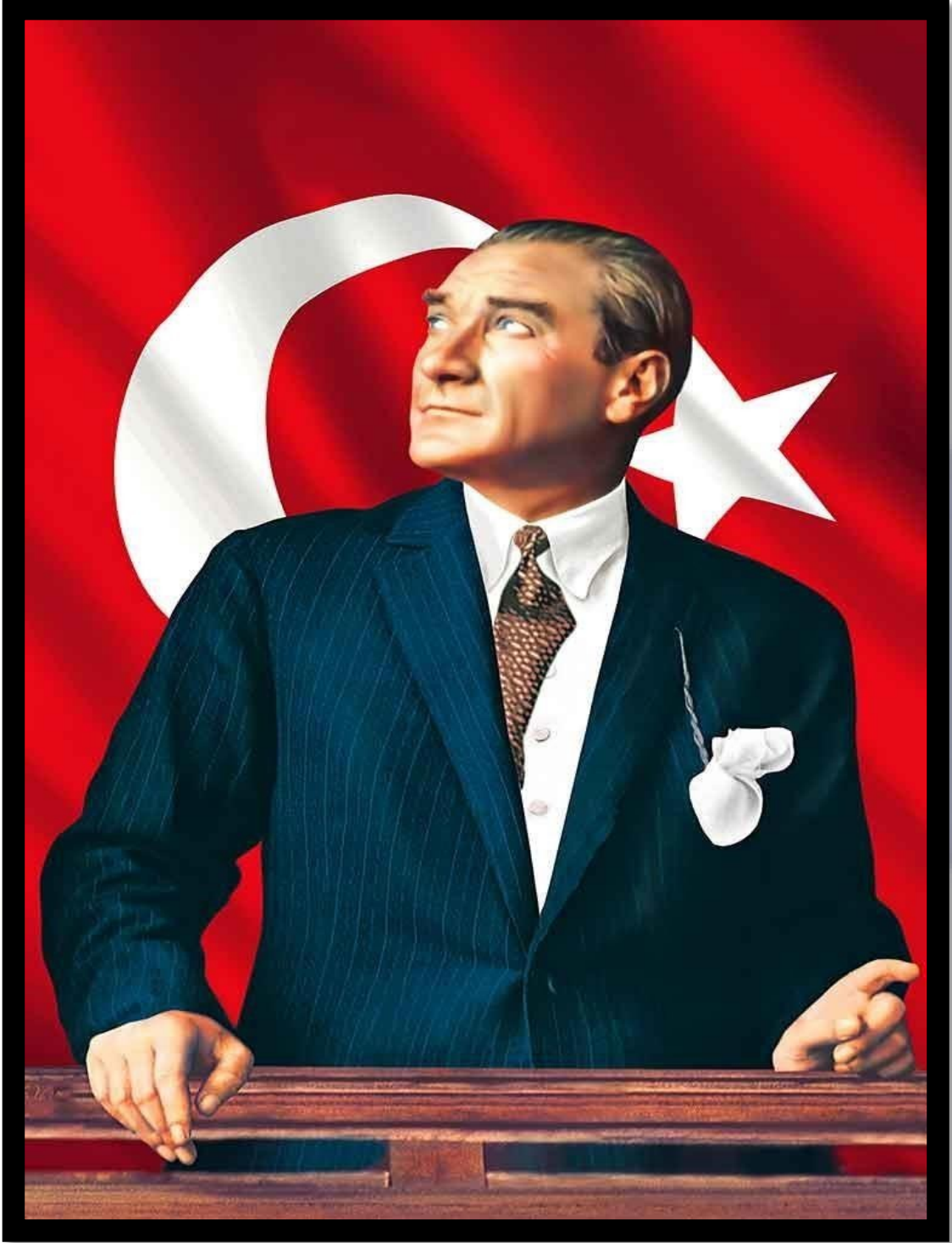
GAZİ MUSTAFA KEMAL ATATÜRK