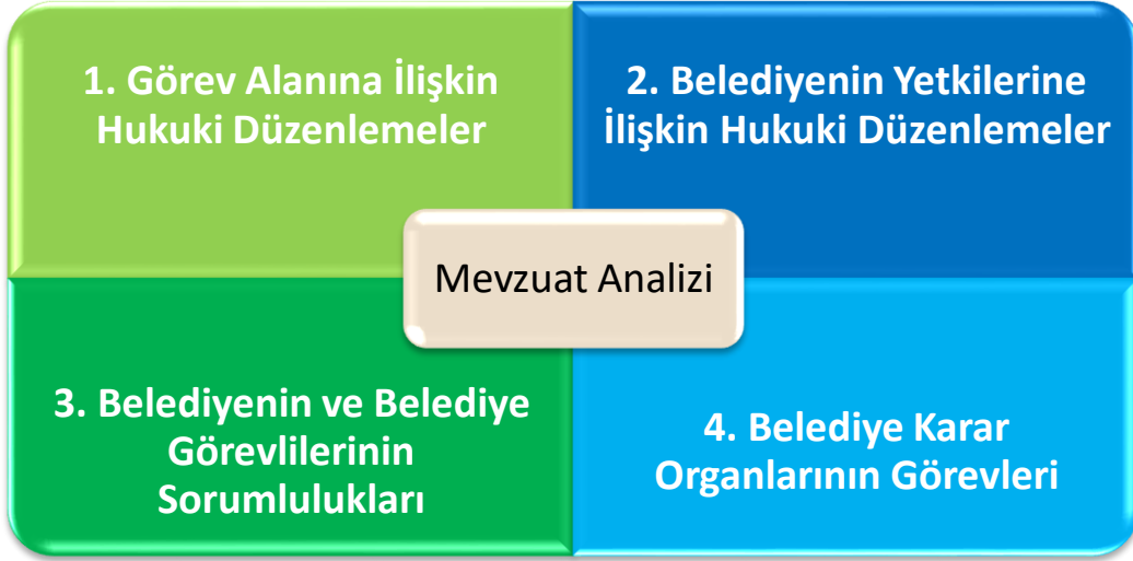
Şekil 1: Mevzuat Analizi