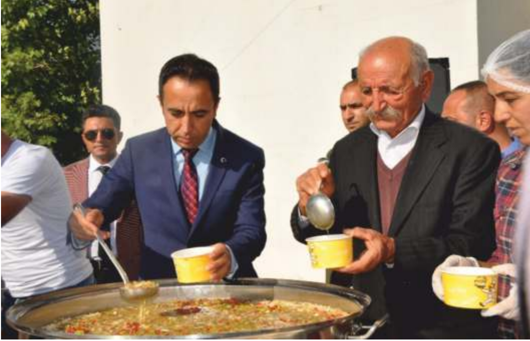
03 Ekim 2019 Perşembe günü saat 15.00 da "Geleneksel 9. Aşure Günü" etkinliğimiz personelimiz, öğrencilerimiz ve halkımızın katılımlarıyla gerçekleşti.