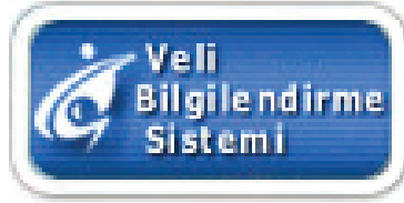
Veli Bilgilendirme Sistemi