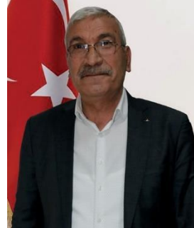
YUSUF EROĞLU MHP