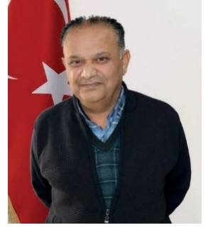
ALİ BAYSAL AK PARTİ