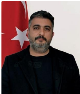
VOLKAN BAYRAKÇI İYİ PARTİ