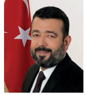
RUHİ GÜL SAADET PARTİSİ