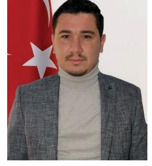
UĞUR DİLÇİKİK AK PARTİ