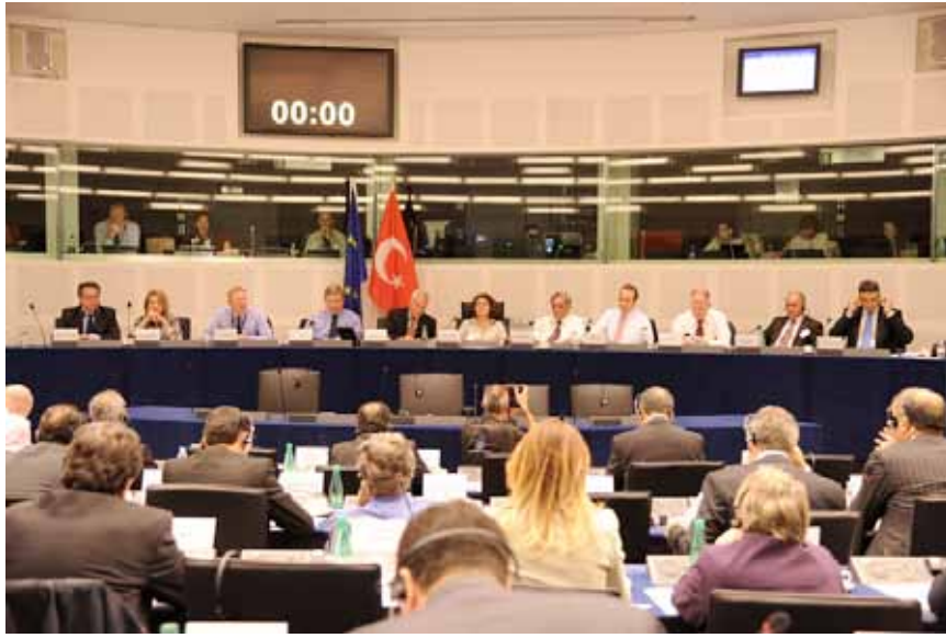
KPK 69. Toplantısı, Strazburg - 13-14 Haziran 2012

Avrupa Parlamentosu Genel Kurulu çalışmalarını izlemek ve üyelerle görüşmelerde bulunmak üzere KPK üyelerinden oluşan heyetler 2012 yılı içerisinde altı kez Avrupa Parlamentosuna ziyaret gerçekleştirmiştir.