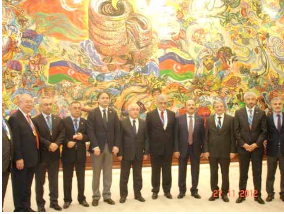
KEİPA 40. Genel Kurulu, Bakü 26-28 Kasım 2012