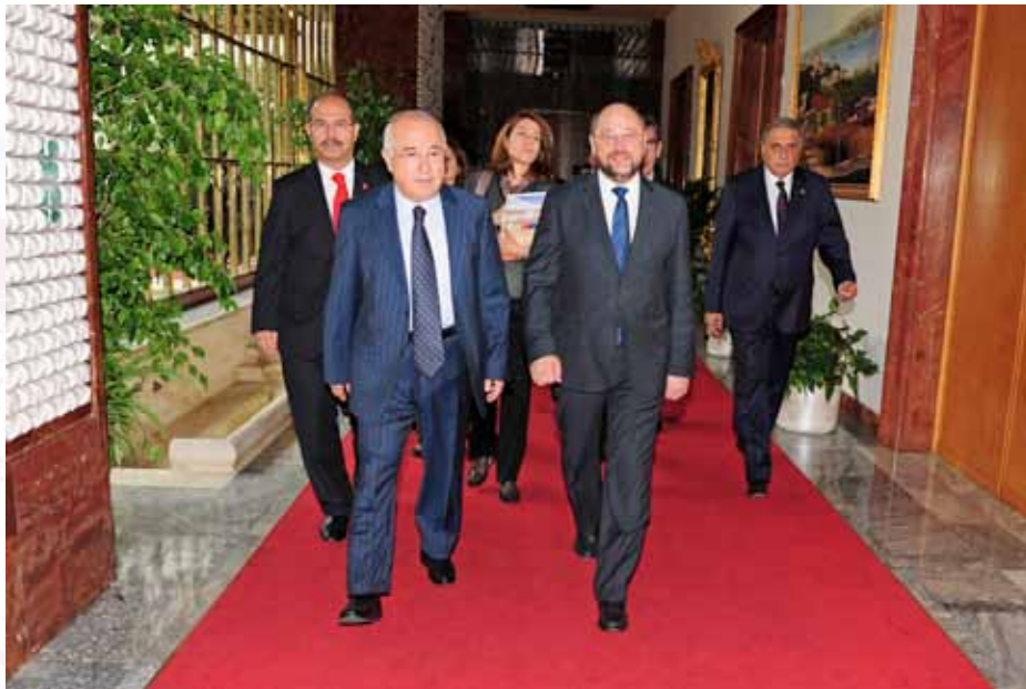
Avrupa Parlamentosu Başkanı Martin SCHULZ’un TBMM’yi Ziyareti - 27/29 Mayıs 2012