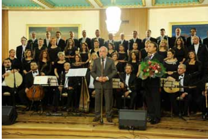
TBMM Türk Sanat Müziği Korosunun yıl sonu konseri