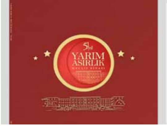
Yarım Asırlık Meclis Binası Sergisi Kataloğu

Bugünkü Meclis Binası'nın inşaat süreci ile ilgili eskiz, plan, proje ve fotoğraflar TBMM arşivi, Anadolu Ajansı Arşivi, Basın Yayın ve Enformasyon Genel Müdürlüğü arşivleri taranarak bir koleksiyon oluşturulmuştur. Seçilen koleksiyon, Milli Egemenlik Haftasına Şeref Holünde sergilenmiştir. Sergide yer alan görsellerden oluşan sergi kataloğu yayımlanmıştır.