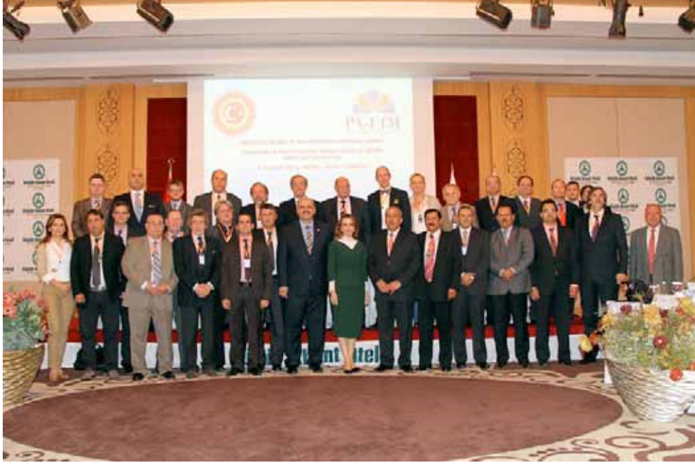
AİBPA Ekonomik ve Mali Konular, Sosyal İşler ve Eğitim Komitesi Toplantısı, Abant - 5-6 Kasım 2012