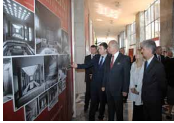
Yarım Asırlık Meclis Binası Sergisi

Türkiye Koridoru İller Sergisi yenilenecek Ziyaretçi Kabul Salonunda sergilenmeye başlanmıştır.