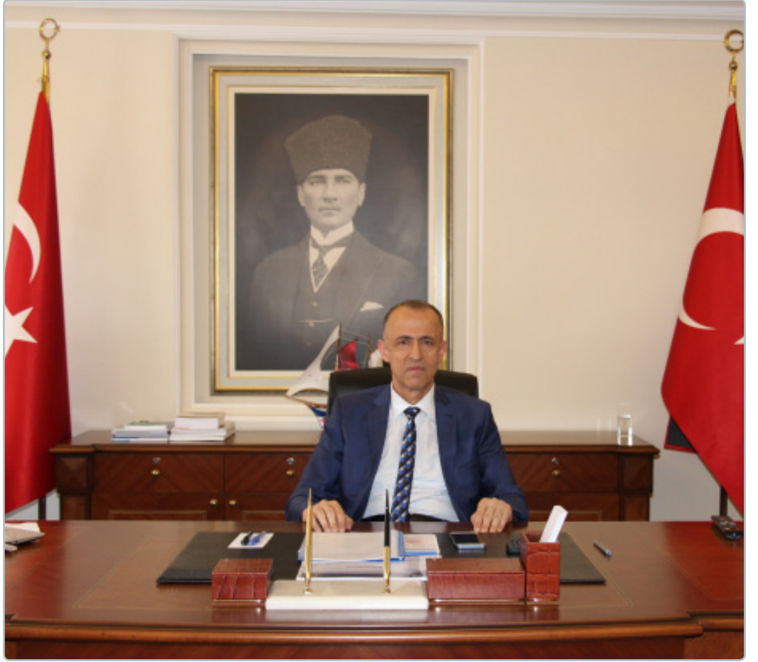
Hamdi Bilge AKTAŞ VALİ