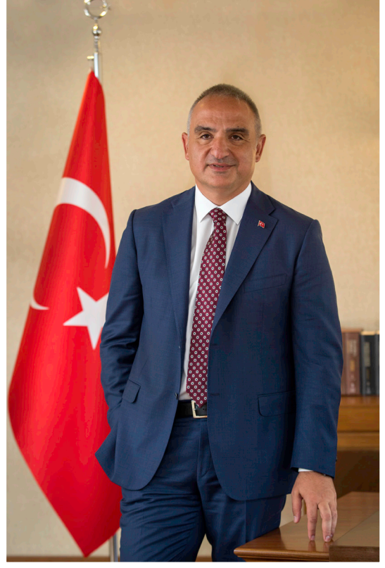
Mehmet Nuri ERSOY Kùltür ve Turizm Bakanı

Kamuda hesap verebilirlik ve şeffaflık ilkeleri dođrultusunda hazırlanmış Başkanlıđımız 2023 yılı Performans Programında emeđi geçen tüm çalışma arkadaşlarıma teşekkür eder, belirlenen hedef ve faaliyetlerin gerçekleşmesi açısından programın başarılı olmasını ve tüm ilgililere fayda sağlamasını temenni ederim.