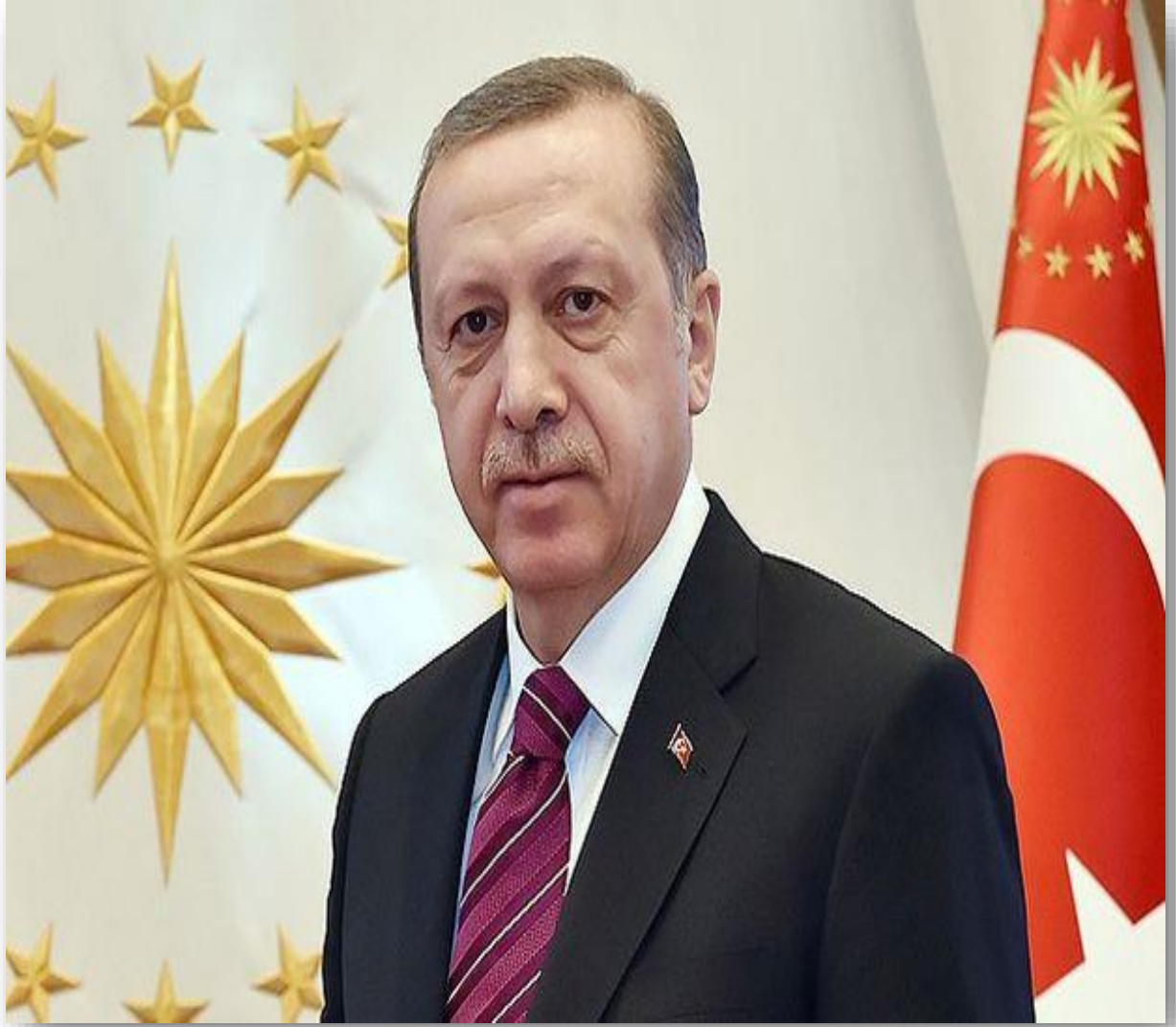
RECEP TAYYİP ERDOĞAN T.C Cumhurbaşkanı