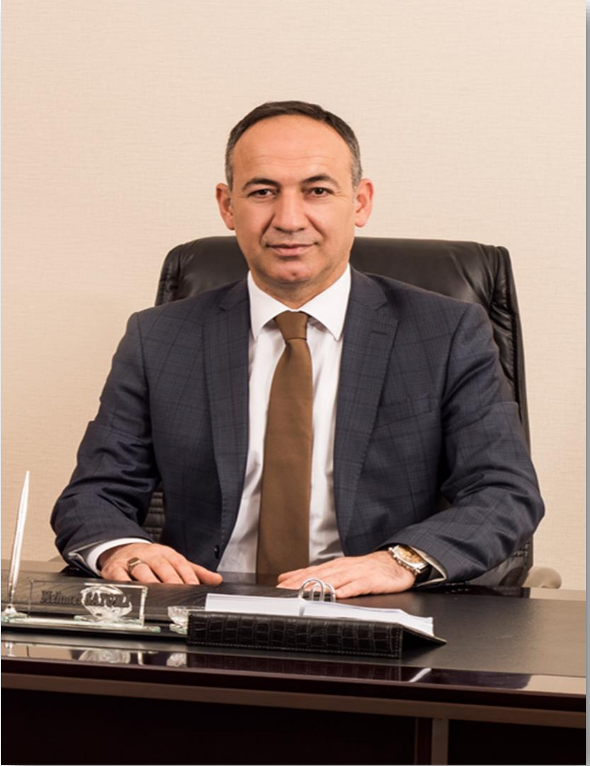
MEHMET SAYGILI Kırıkkale Belediye Başkanı