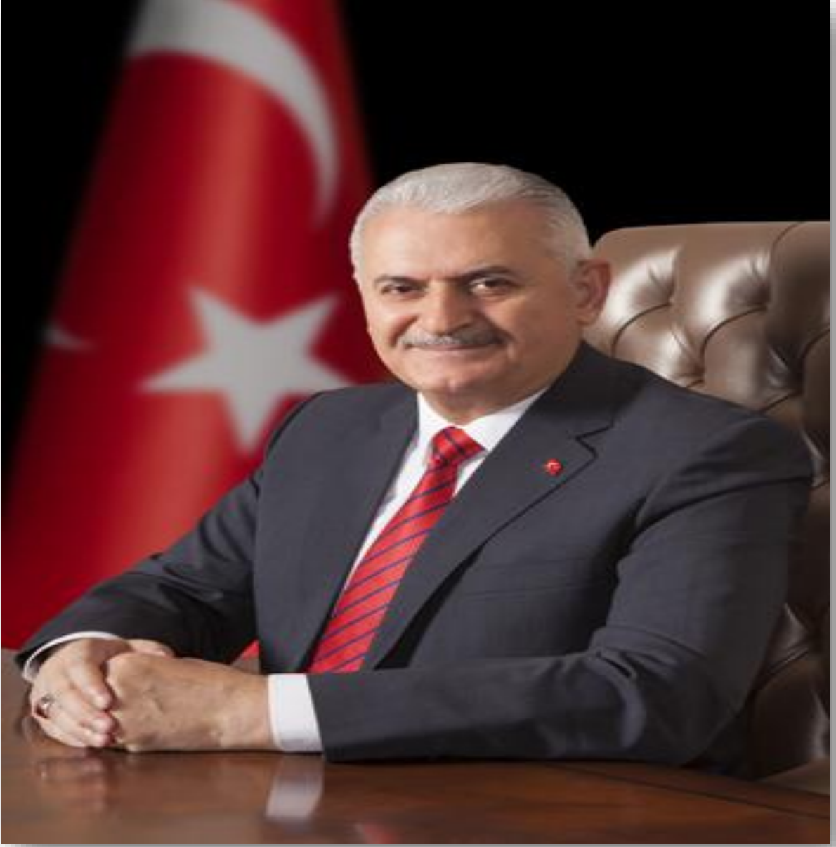
BİNALİ YILDIRIM T.C Başbakanı