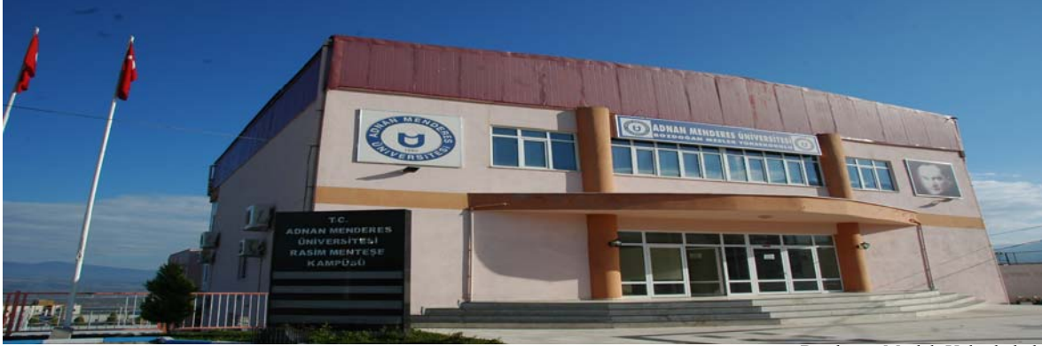
Bozdoğan Meslek Yüksekokulu

Bozdoğan ilçesinde, 3.700 metrekare kapalı alana sahip üç katlı bir binada eğitim-öğretim hizmeti vermektedir.