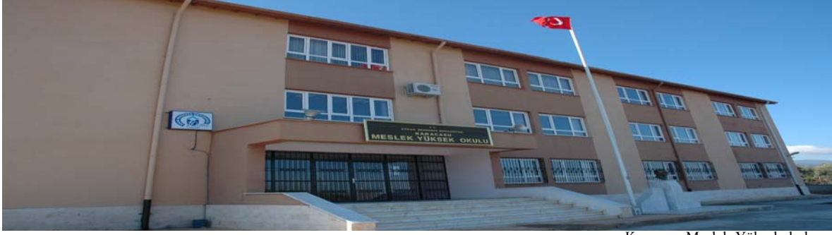
Karacasu Meslek Yüksekokulu