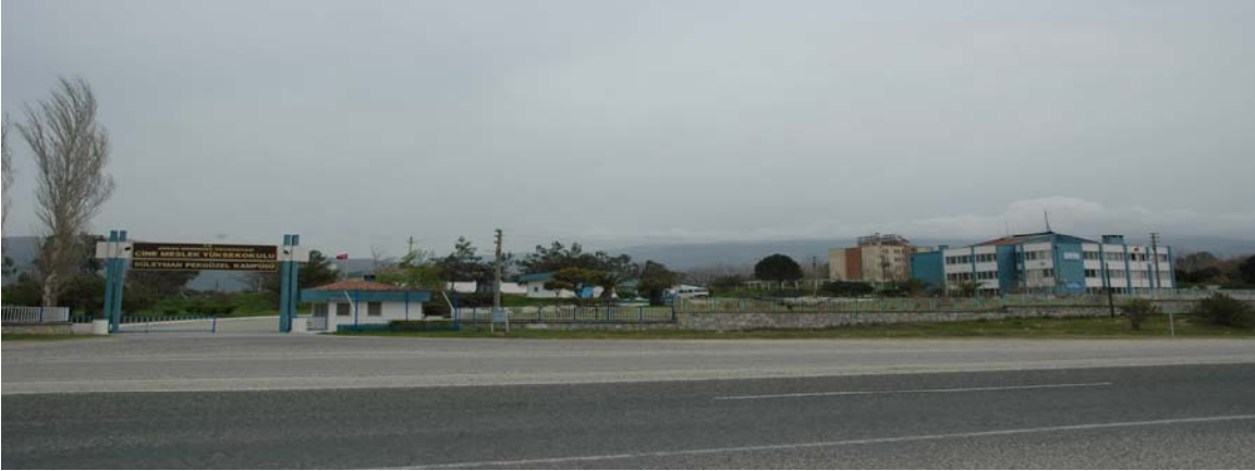
Çine Meslek Yüksekokulu

Çine ilçesinde yer alan Devlet Su İşleri Genel Müdürlüğü Çine Tesislerinin devri ile kazanılan toplam 17.532 metrekare alana sahip Yerleşkede; Çine Meslek Yüksekokulu ile 40 öğrenci kapasiteli beş katlı bir öğrenci yurdu bulunmaktadır.