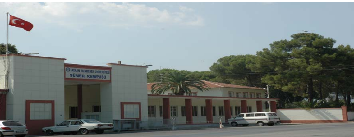
Nazilli Sümer Kampüsü

Nazilli ilçesinde yer alan Sümer Holding tarafından Nazilli Sümerbank Basma Sanayii Müessesesinin Üniversitemize devriyle kazanılan toplam 405.375 metrekare alana sahip Yerleşkede; Nazilli Meslek Yüksekokulu ile Devlet Konservatuvarı bulunmaktadır.