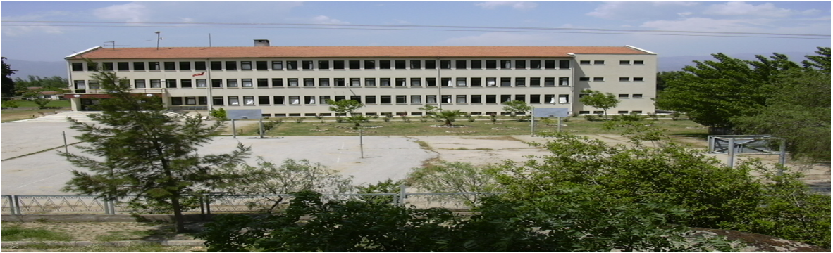
Yenipazar Meslek Yüksekokulu

Yenipazar ilçesinde, Milli Eğitim Bakanlığında tahsis edilen toplam 3.400 metrekare kapalı alana sahip üç katlı binada eğitim-öğretim hizmeti vermektedir.