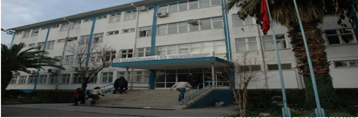
Aydın Sağlık Y.O. – Aydın Sağlık Hizmetleri M.Y.O

Sağlık Bakanlığında devredilen üç katlı binada Aydın Sağlık Yüksekokulu, Aydın Sağlık Hizmetleri Meslek Yüksekokulu hizmet vermektedir. Ayrıca 600 metrekare alana sahip 750 kişi kapasiteli bir kapalı spor salonumuz bulunmaktadır.