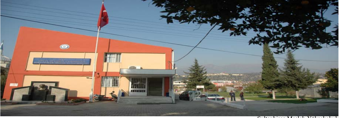
Sultanhisar Meslek Yüksekokulu

Sultanhisar ilçesinde, Tekel Genel Müdürlüğünden satın alınan bina ve bağış yoluyla kazanılan toplam 6.000 metrekare kapalı alana sahip iki ayrı binada eğitim-öğretim hizmeti vermektedir.