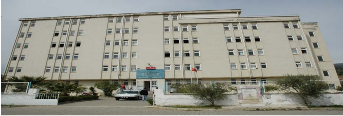
Kuyucak Meslek Yüksekokulu

Kuyucak ilçesinde toplam 3.000 metrekare kapalı alana sahip altı katlı bir binada eğitim-öğretim hizmeti vermektedir.