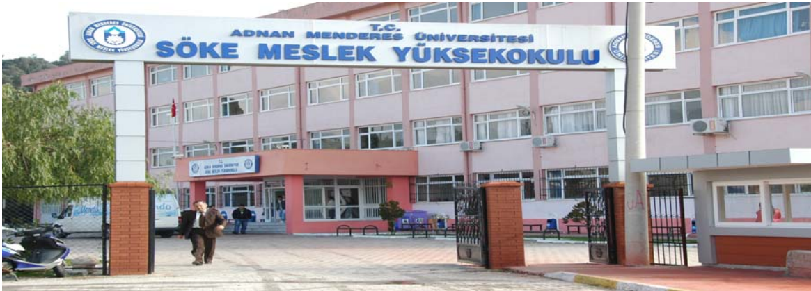
Söke Meslek Yüksekokulu

Söke ilçesinde, Söke Özel İdaresi tarafından yapılarak Üniversitemize tahsis edilen 3.585 metrekare kapalı alana sahip binada eğitim-öğretim hizmeti vermektedir.