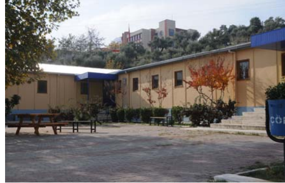
Koçarlı Meslek Yüksekokulu