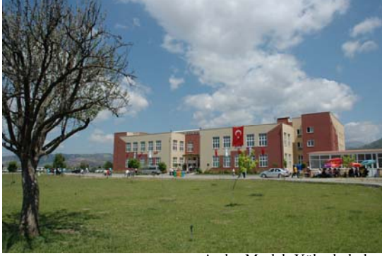
Aydın Meslek Yüksekokulu

Aydın Merkez Kepez mevkii Aytepe’de, 1.769.994 metrekarelik bir alan üzerinde kurulmuştur. 137.380 metrekare kapalı alana sahip Yerleşke’de; Eğitim Fakültesi, Fen-Edebiyat Fakültesi, Fen Bilimleri Enstitüsü, Sağlık Bilimleri Enstitüsü, Sosyal Bilimler Enstitüsü, Aydın Meslek Yüksekokulu ile Rektörlük Binası, Merkez Kütüphane, Merkez Kafeterya, Öğrenci Sosyal Tesisleri (Kafeterya, Bayan Kuaförü, Ayakkabı Tamir Atölyesi), Atölyeler, Anaokulu, Sosyal Tesis ve Konuk Evi, Merkez Laboratuvar, Atatürk Kongre Merkezi, Kapalı Spor Salonu, Tıp Fakültesi Morfoloji, Uygulama ve Araştırma Hastanesi yer almaktadır.