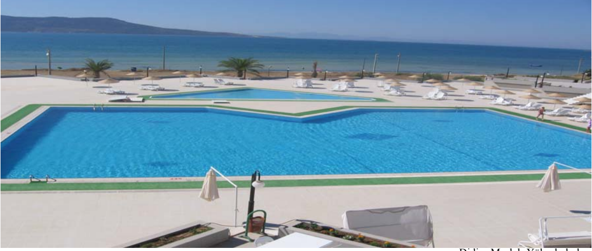
Didim Meslek Yüksekokulu

Didim ilçesinde yer alan Didim Akbük Otelcilik ve Turizm Meslek Lisesi tesislerinin devri ile kazanılan toplam 176.900 metrekare alana sahip Yerleşkede; Didim Meslek Yüksekokulu eğitim öğretim hizmeti vermektedir. Ayrıca bir sosyal tesis ve öğrenci yurdu bulunmaktadır.