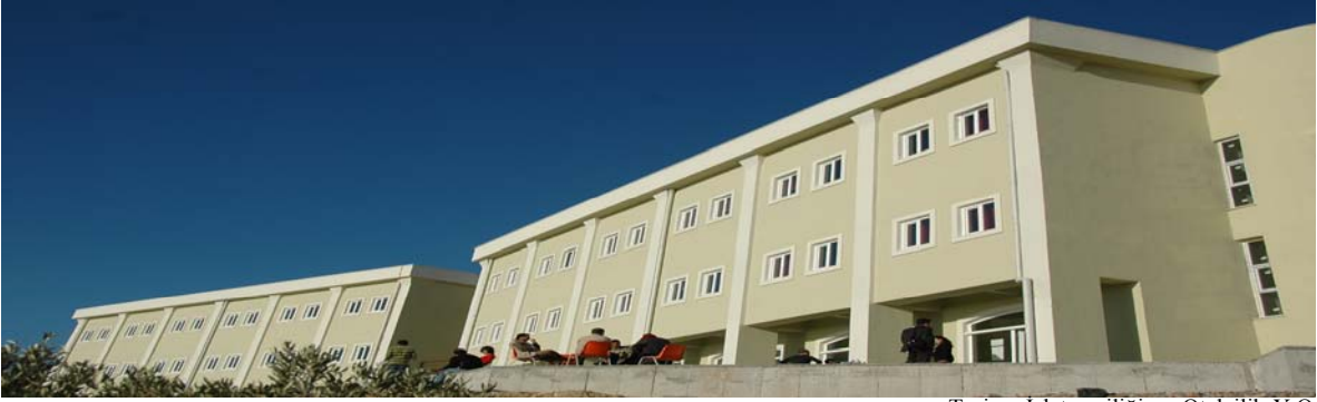
Turizm İşletmeciliği ve Otelcilik Y.O.

Kuşadası ilçesinde 1.170 metrekare kapalı alana sahip altı katlı bir binada eğitim-öğretim hizmeti vermektedir.