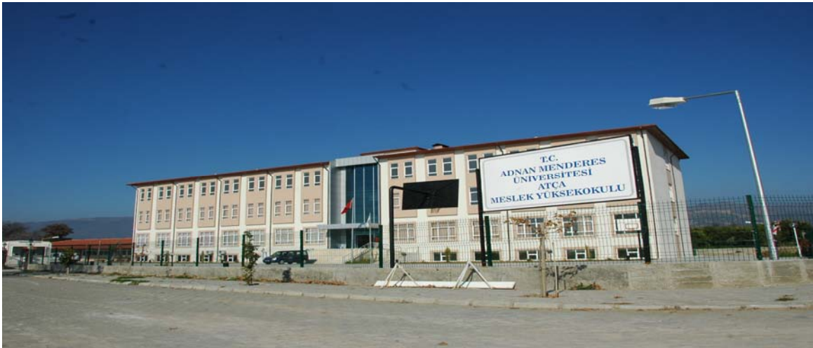
Atça Meslek Yüksekokulu

Atça beldesinde toplam 4.300 metrekare kapalı alana sahip binada eğitim-öğretim hizmeti vermektedir.