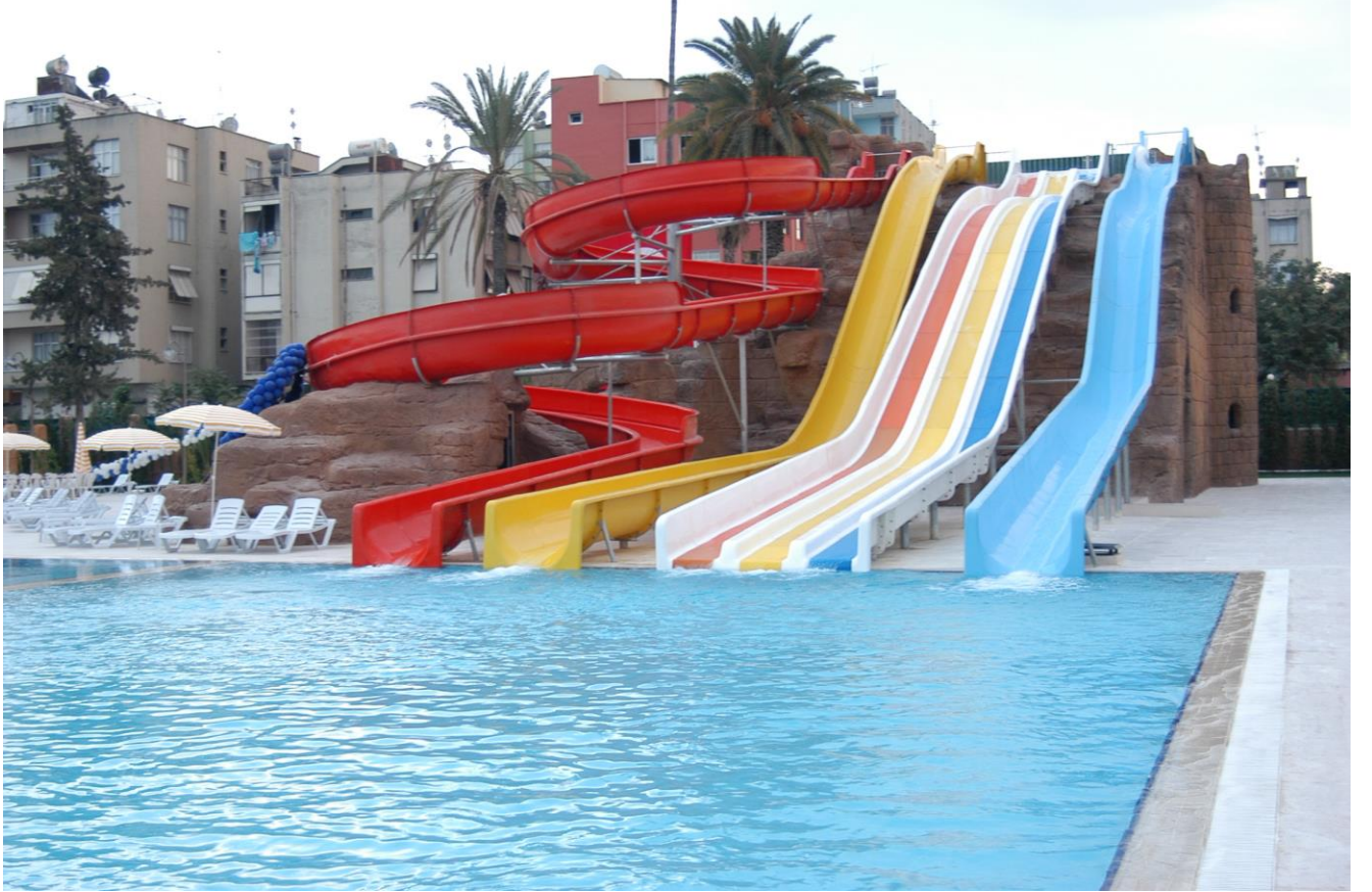
Yüzme Havuzu - 2007