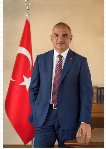
Mehmet Nuri ERSOY Kültür ve Turizm Bakanı

5018 sayılı Kamu Mali Yönetimi ve Kontrol Kanunu'nun ortaya koyduğu stratejik yönetim anlayışı kamu kurumlarına önceden belirlenen amaç ve hedefler doğrultusunda yürütülen faaliyetleri izleme ve değerlendirme ile stratejik planlarının yıllık olarak takibini sağlayan performans programlarını hazırlama yükümlülüğü getirmiştir. Kamuda stratejik yönetim anlayışının bir gereği olarak kaynakların etkin ve amacına uygun olarak kullanılması ve hesap verebilirliğin sağlanması esastır. Bu bağlamda, hedeflerimize ulaşmak için yürütülecek faaliyetler ile bu faaliyetlere ayrılan kaynakları ve ölçülebilir performans göstergelerini içeren "Atatürk Araştırma Merkezi Başkanlığı 2024 Yılı Performans Programı" hazırlanmıştır. Programın başarıyla uygulanmasını temenni eder, hazırlanmasında emeği geçen çalışma ekibine teşekkür ederim.