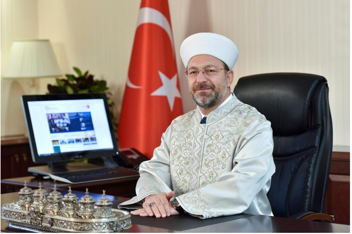
Prof. Dr. Ali ERBAŞ Diyanet İşleri Başkanı