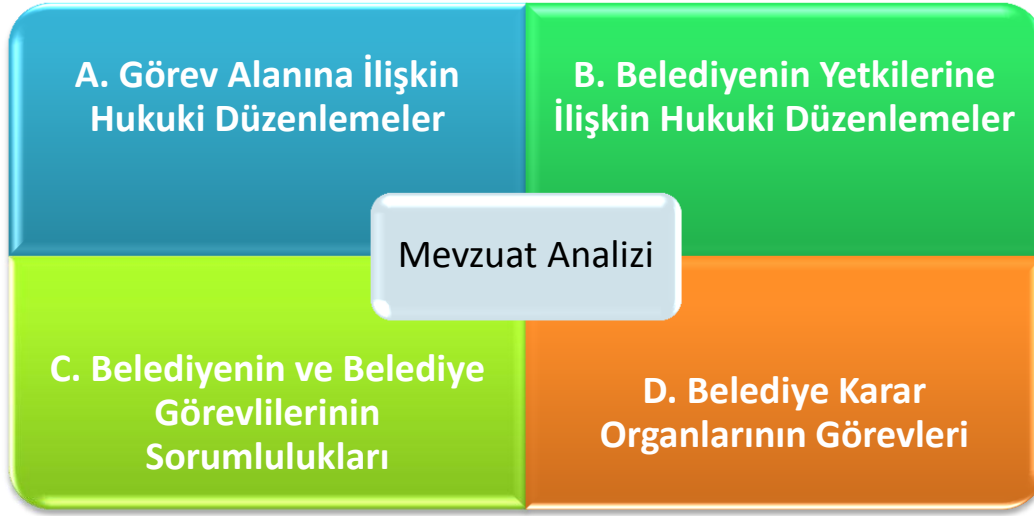
Şekil 1: Mevzuat Analizi