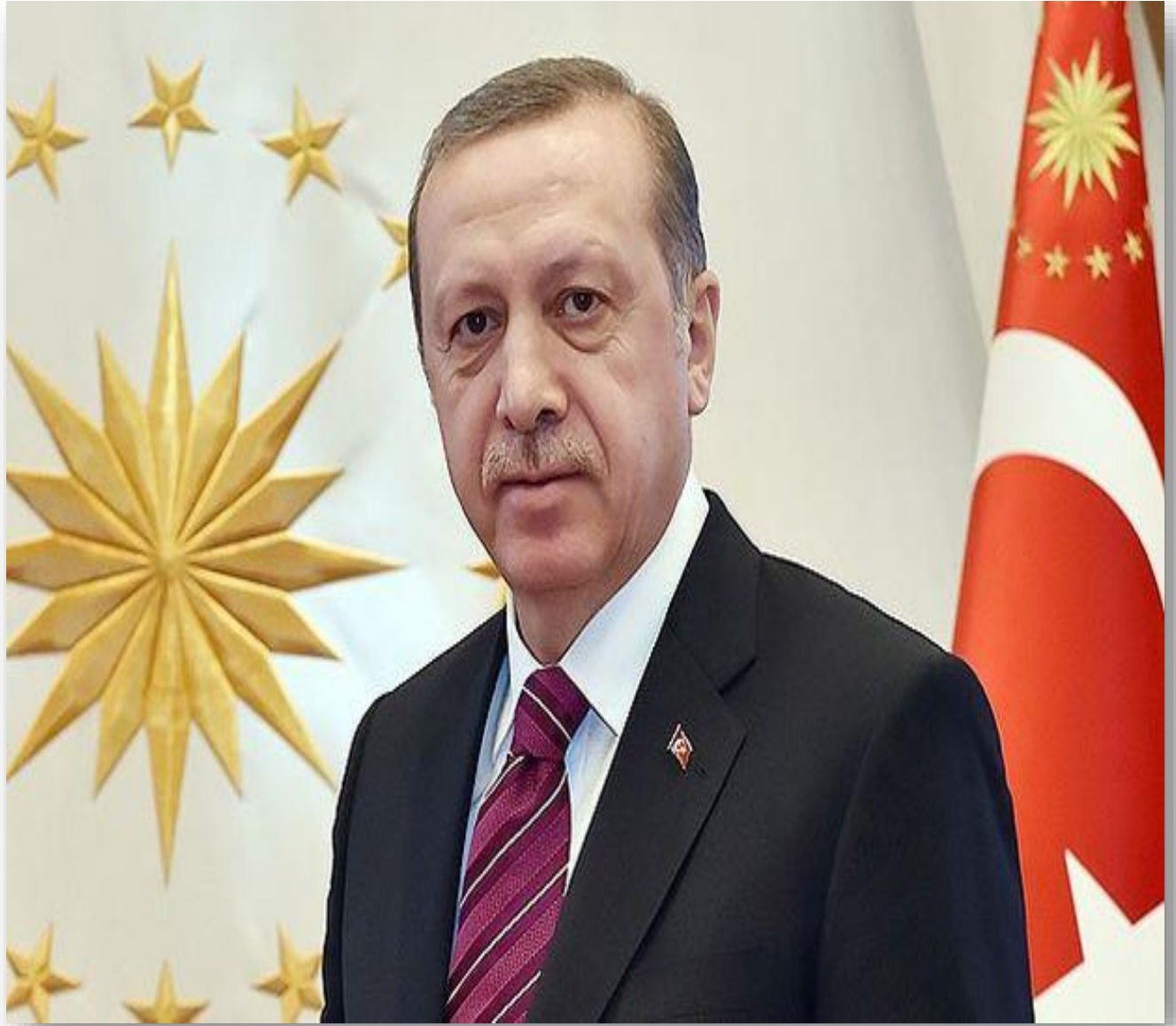
RECEP TAYYİP ERDOĞAN