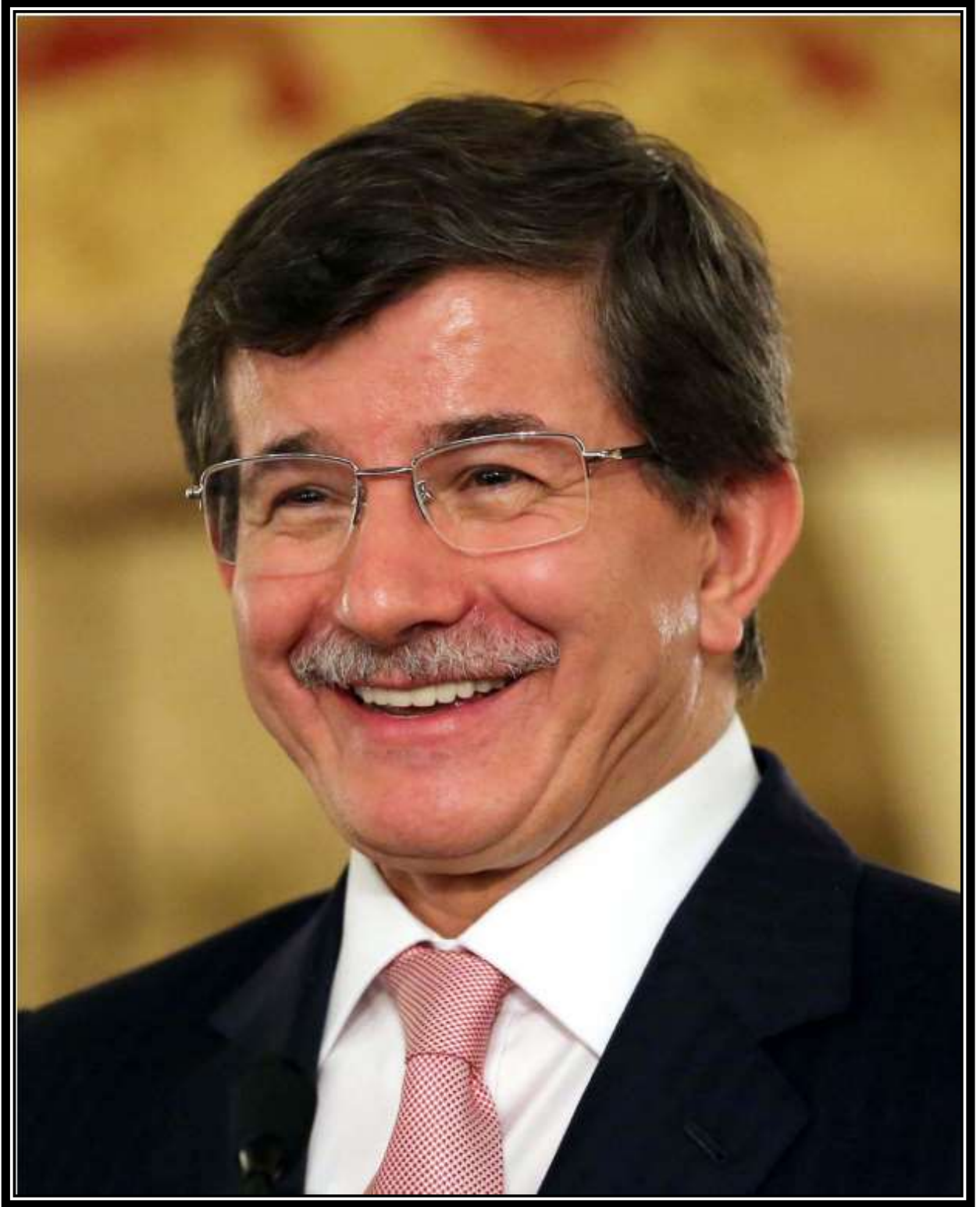
Ahmet DAVUTOĐLU Başbakan