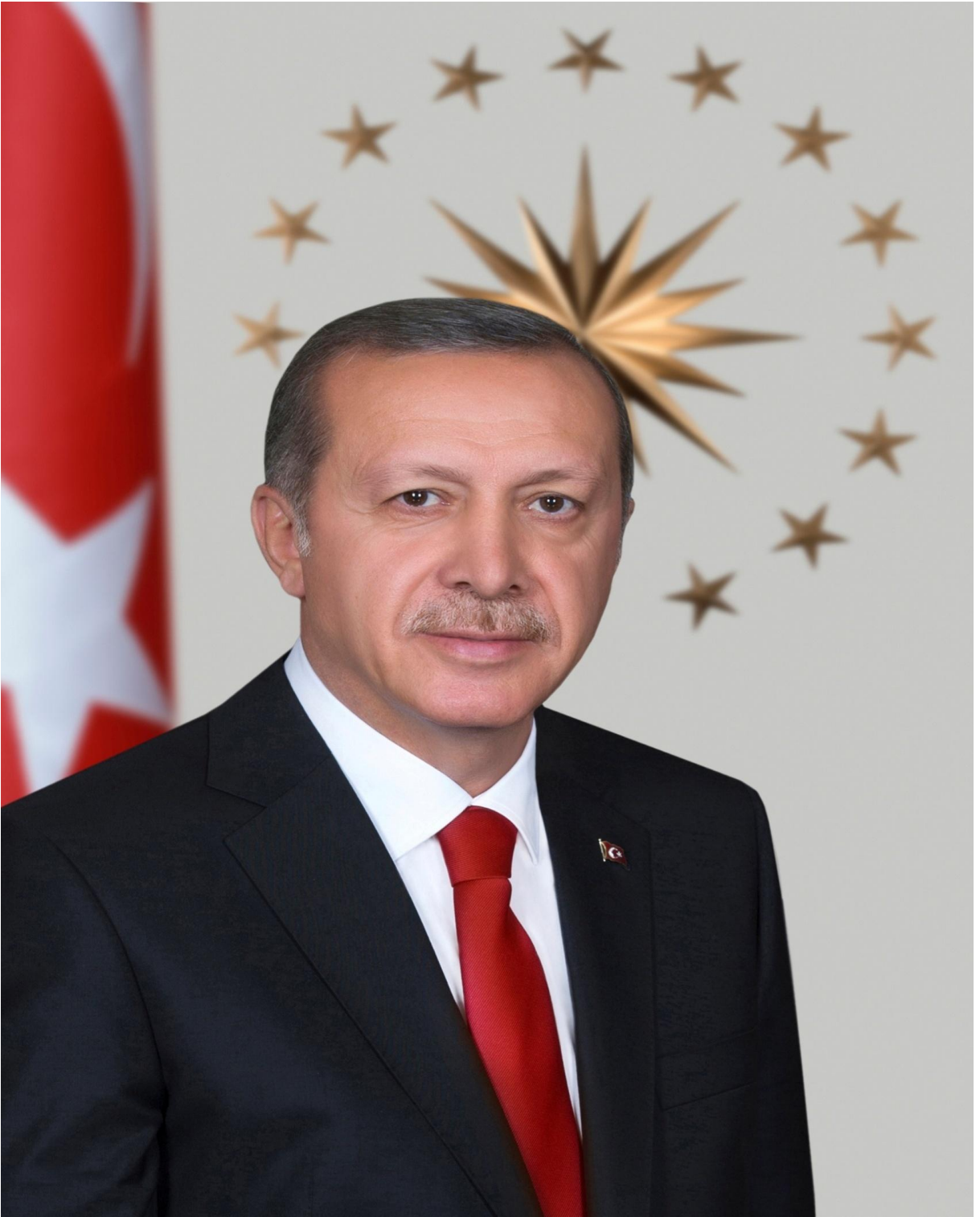
RECEP TAYYİP ERDOĞAN T.C.CUMHURBAŞKANI