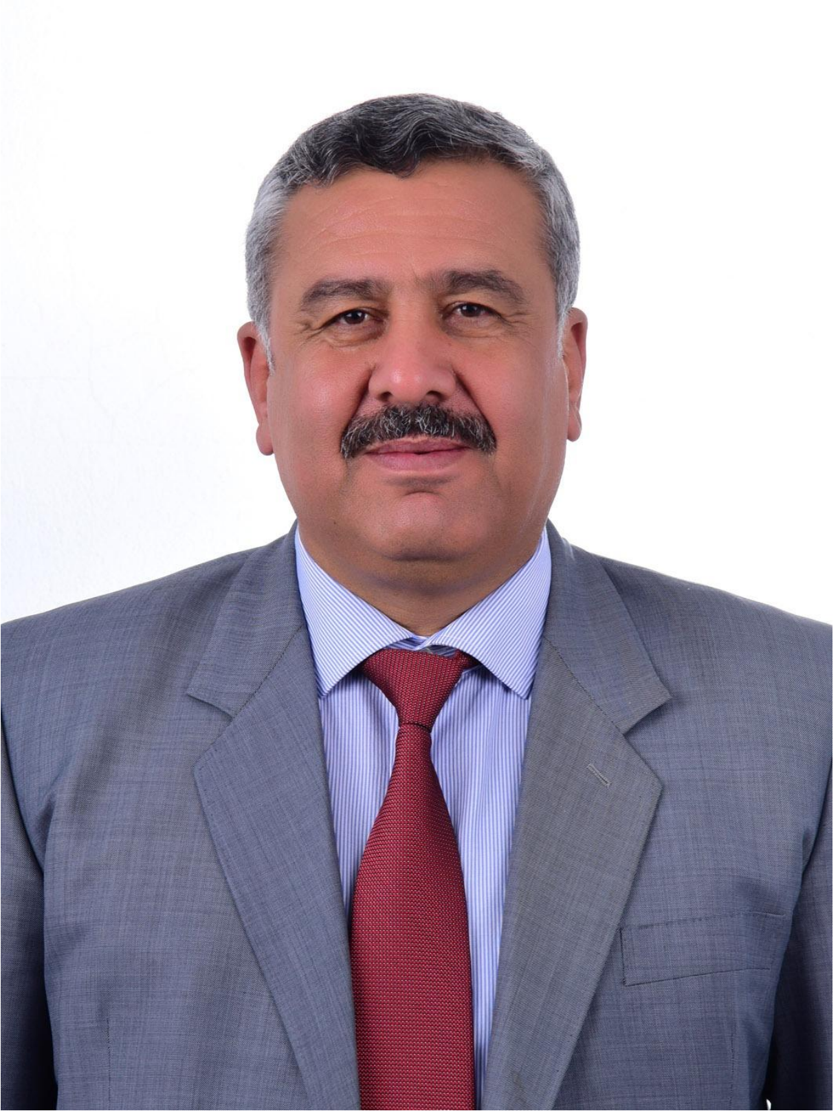
“Hep Birlikte El Ele...” MEHMET KARATAŞ HASSA BELEDİYE BAŞKANI