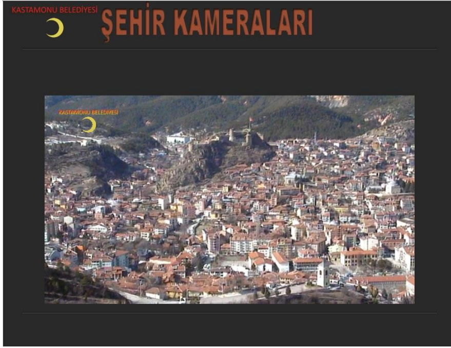
Resim7 : Toklu Tepe Kamera Görüntüsü

6-Yapımına 2012 yılında başlanan ve 2013 yılında devam edilen İstiklal Parkı inşaatında inşaata paralel olarak elektrik tesisatı alt yapısı tamamlanmış ve akabinde aydınlatma sistemi yapılarak hizmete alınmıştır.