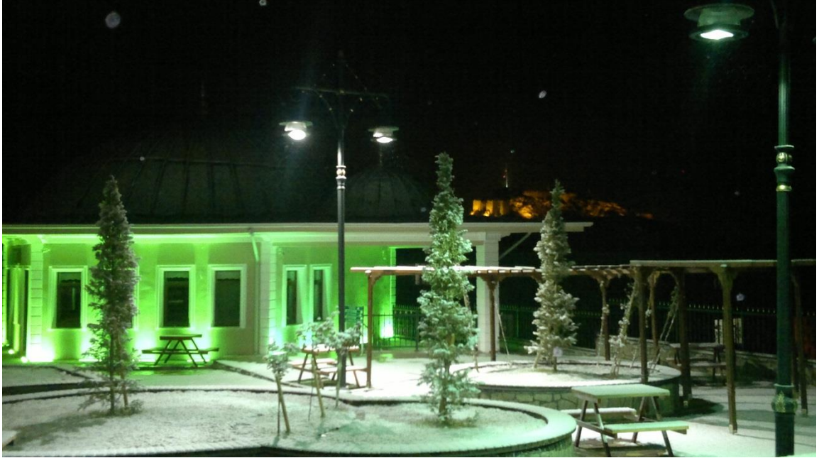
Resim8 : Mehmet Fevzi Efendi Camii

7-Gümüşlüce Mezarlık tesislerinde yapılan Mehmet Fevzi Efendi Camii Elektrik tesisatı ve ses sistemi yapılmış, hizmete sunulmuştur. Cami binası kapalı devre kamera sistemi ile donatılmıştır. Ayrıca çevre ve bina aydınlatması yapılarak görsellik kazandırılmıştır.