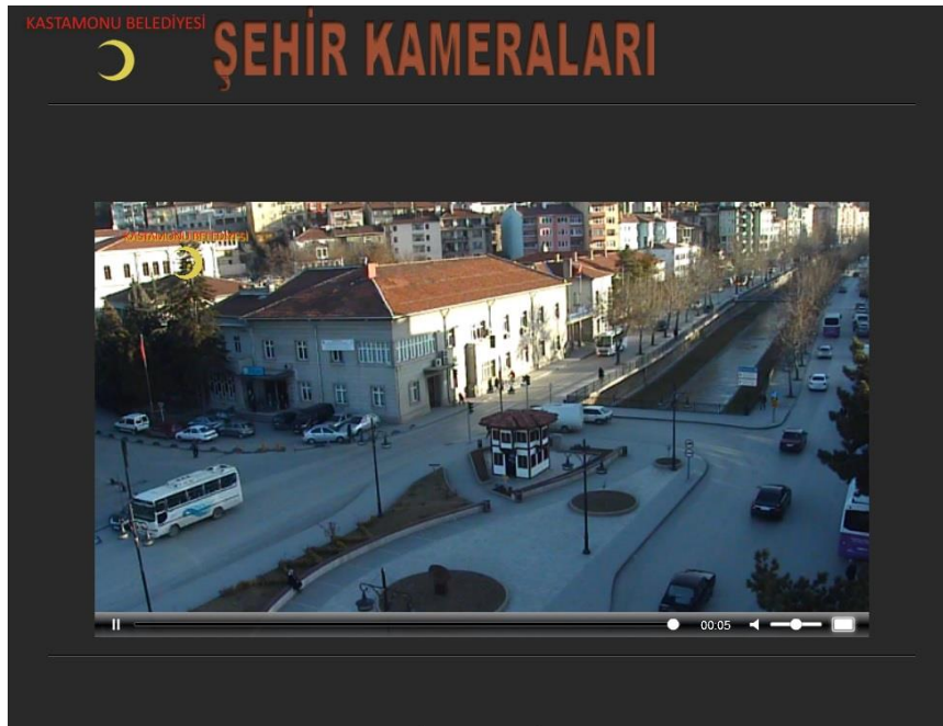
Resim6 : Cumhuriyet Meydanı (Trafik) Kamera Görüntüsü

5-Trafik kamera sistemleri kapsamında kurulan 4 adet kamera görüntüleri turizm amaçlı olarak belediyemiz Web sayfasında canlı olarak yayımlanmaya başlanmıştır.