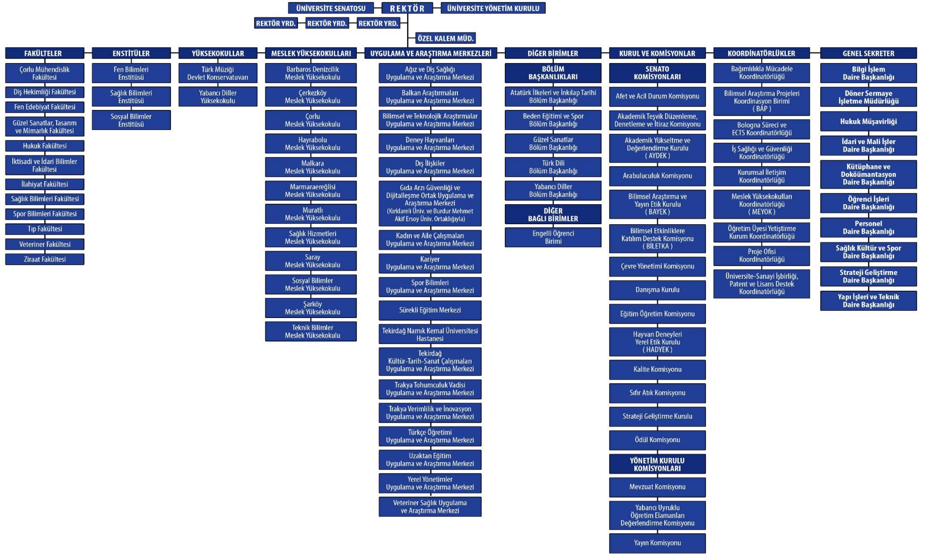
Şekil 1: TNKÜ Organizasyon Şeması