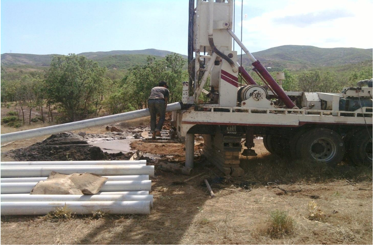
SONDAJ ÇALIŞMALARINDAN GÖRÜNTÜLER