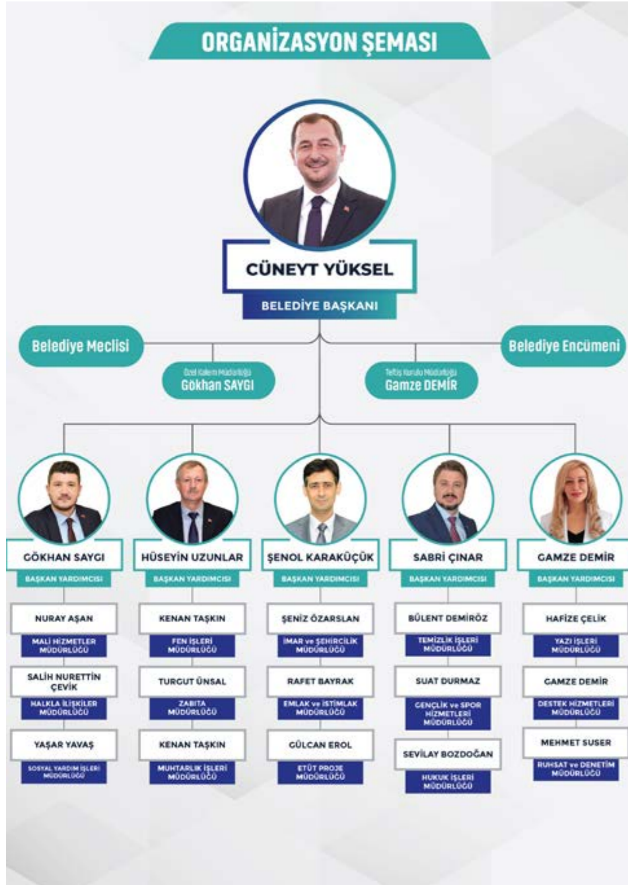
Tablo 2 : İdari Yapı