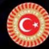
PROF. DR. MUSTAFA ŞENTOP TÜRKİYE BÜYÜK MİLLET MECLİSİ BAŞKANI TEKİRDAĞ MİLLETVEKİLİ