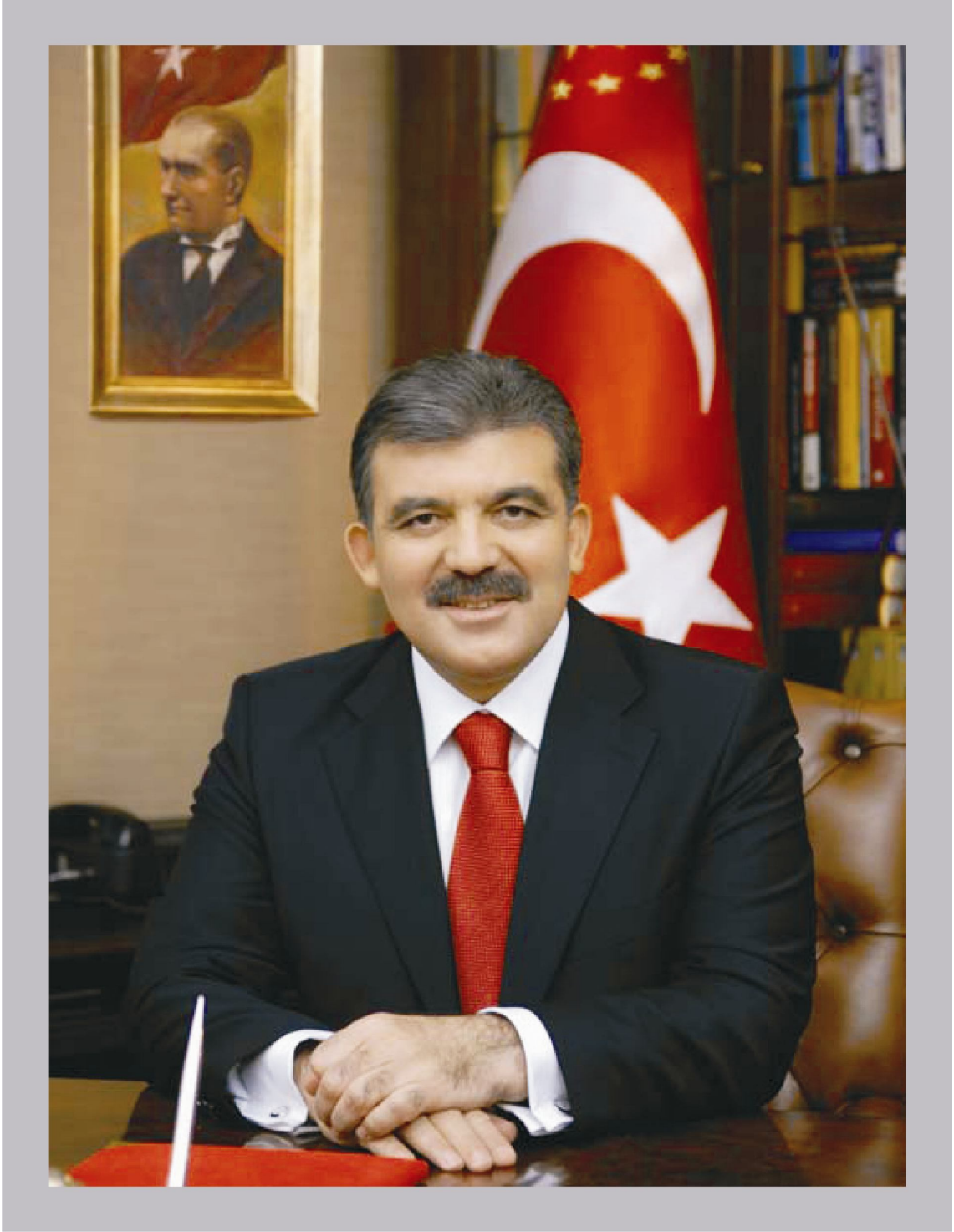
Abdullah GÜL CUMHURBAŞKANI