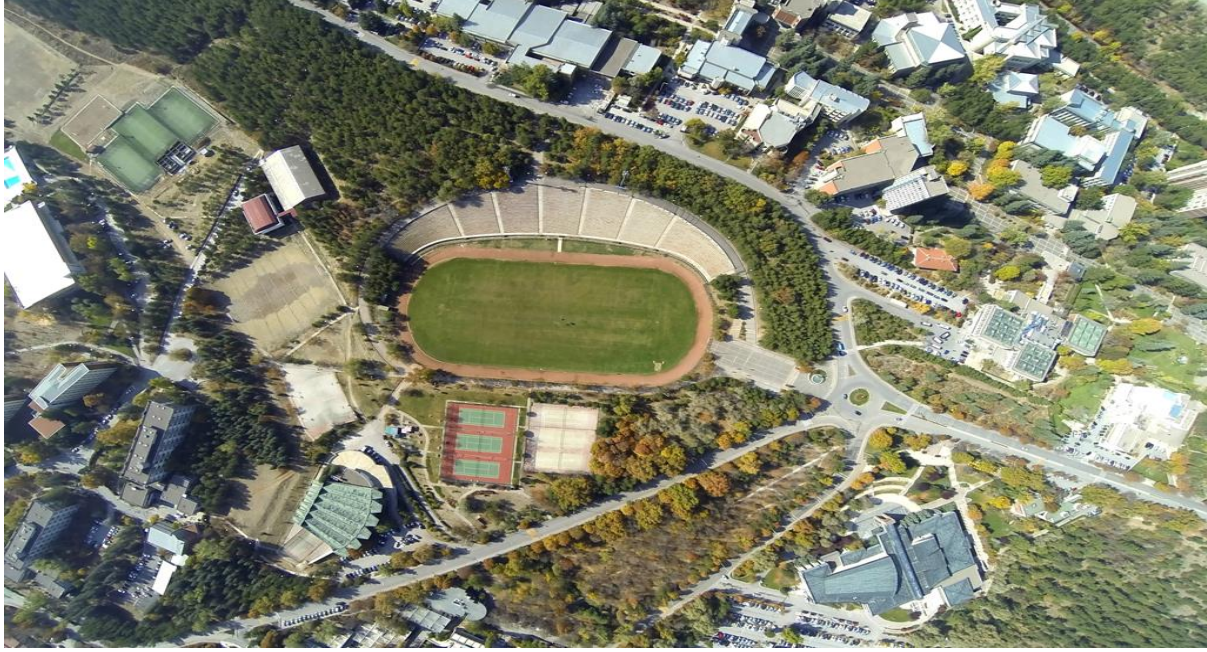
Tablo 52 Müsabakalar

Çeşitli spor tesislerinin bulunduğu üniversitemizde öğrenci ve personelimiz birçok branşta etkinliklere katılabilir. Akademik takvimin başlaması ile birlikte çeşitli branşlarda spor kursları ve turnuvaları düzenlenir. Ayrıca üniversitelerarası spor yarışmalarında bay ve bayan takımlarımız üniversitemizi temsil etmektedirler. Öğrencilerimizin her yıl yapılan seçmelere katılarak, diledikleri spor takımlarına katılma olanakları bulunmaktadır. Spor Müdürlüğü'nde Türk Standartları Enstitüsü tarafından her yıl tetkik edilen TS EN ISO 9001: 2015 şartlarına uygun kalite yönetim sistemini uygulamaktadır.