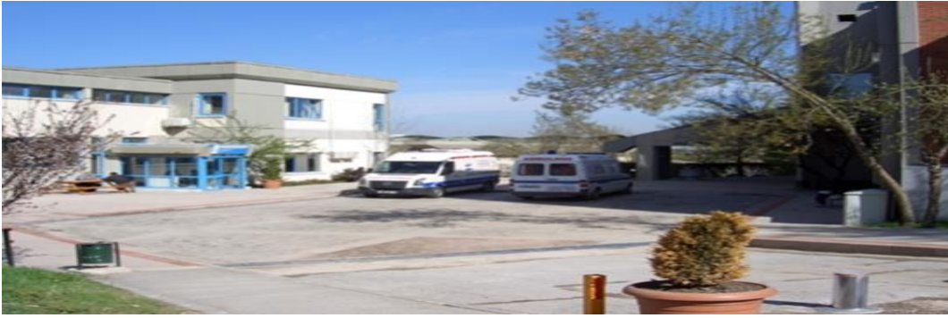
Tablo 59 Sağlık Ve Rehberlik Merkezi Personeli

Merkezimizde Çocuk Sağlığı ve Hastalıkları, Dermatoloji, Diş Hastalıkları ve Sağlığı, Fizik Tedavi, Göğüs Hastalıkları, Kadın Hastalıkları, Psikolojik Danışmanlık ve Rehberlik Merkezi, Psikiyatri, Radyoloji, İlk Yardım ve Laboratuvar hizmetleri verilmektedir. Merkezimiz İlk Yardım Ünitesinde acil durumlar için 24 saat kesintisiz hizmet verilmektedir.