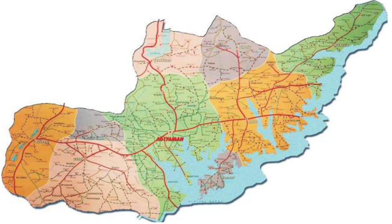
Adiyaman İli Haritası