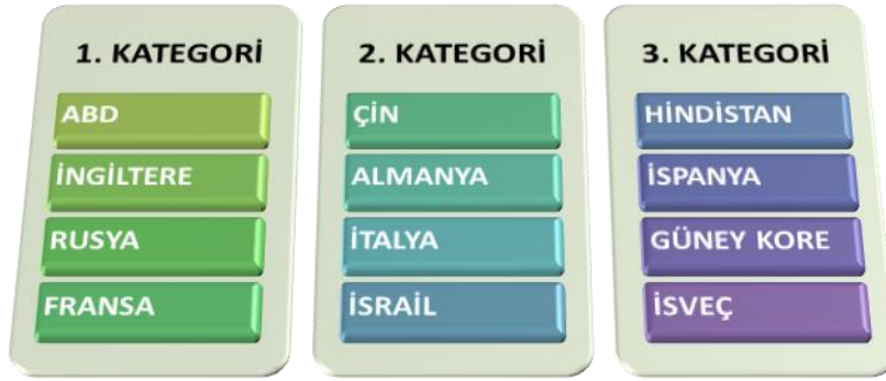
Şekil 2: Dünya Savunma Sanayi Ligi

Türk savunma sanayiinin yaşamakta olduğu hızlı gelişime karşın, halen üst düzey ülkeler sınıfında yer bulabildiğimizi söylemek güçtür. Aşağıda bu alanda başarı sağlamış ülkelerin listesi görülmektedir.