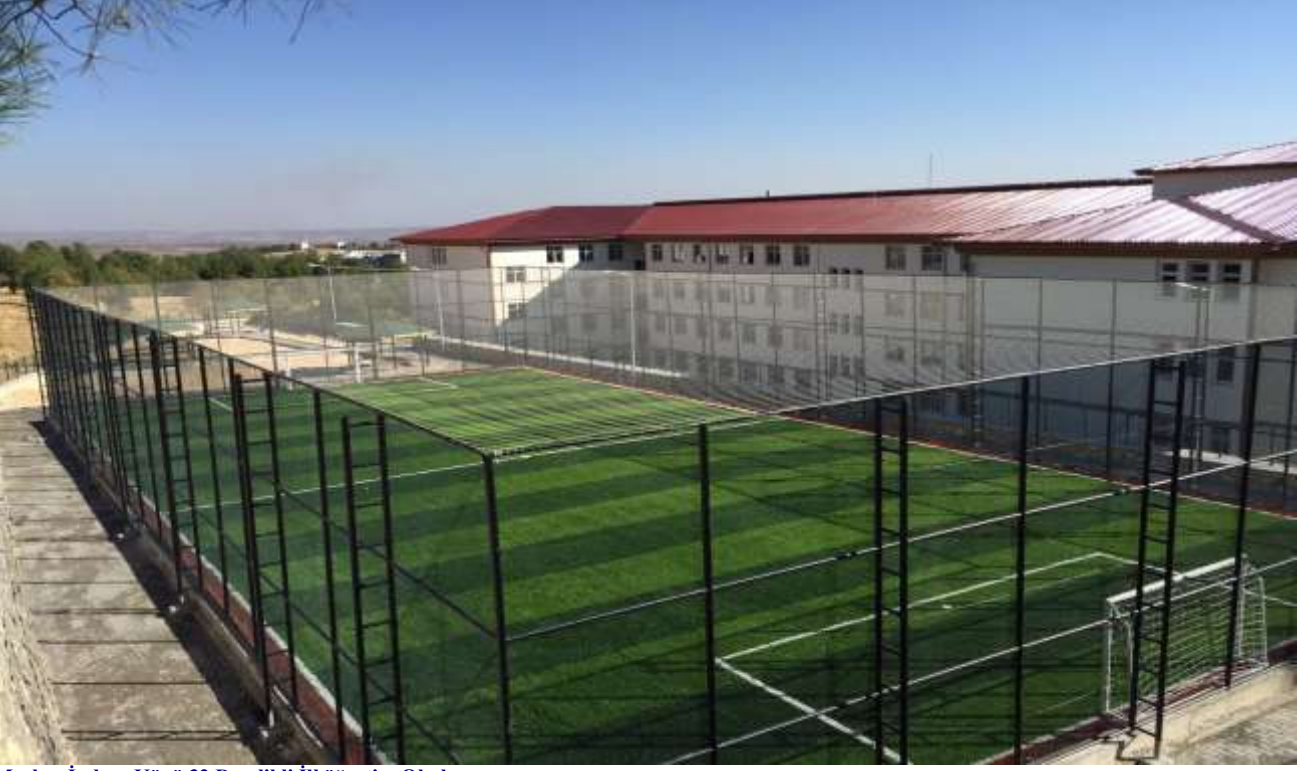
Merkez İndere Köyü 32 Derslikli İlköğretim Okulu