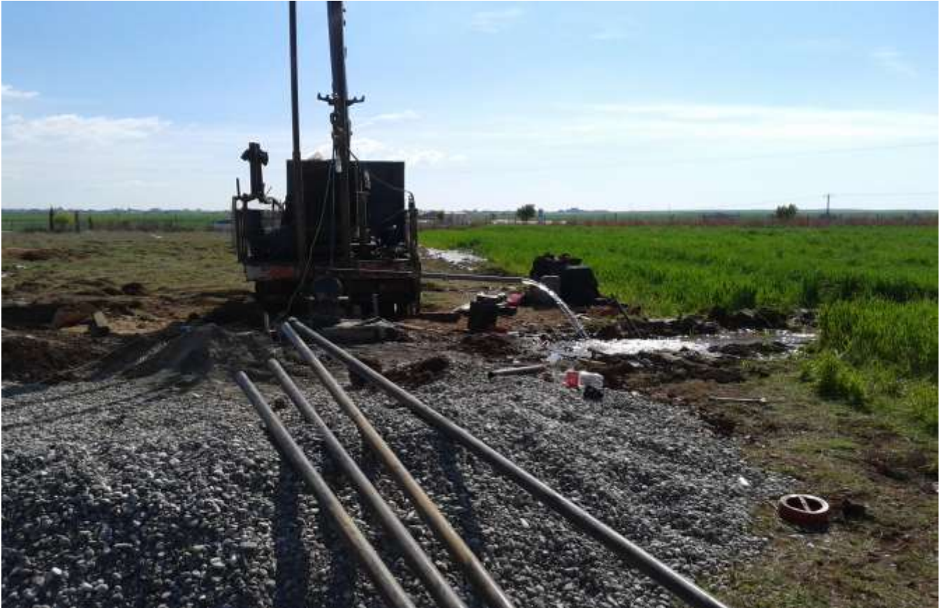
Kâhta İlçesi Ortanca Köyü Fen Lisesi Sondaj Çalışması