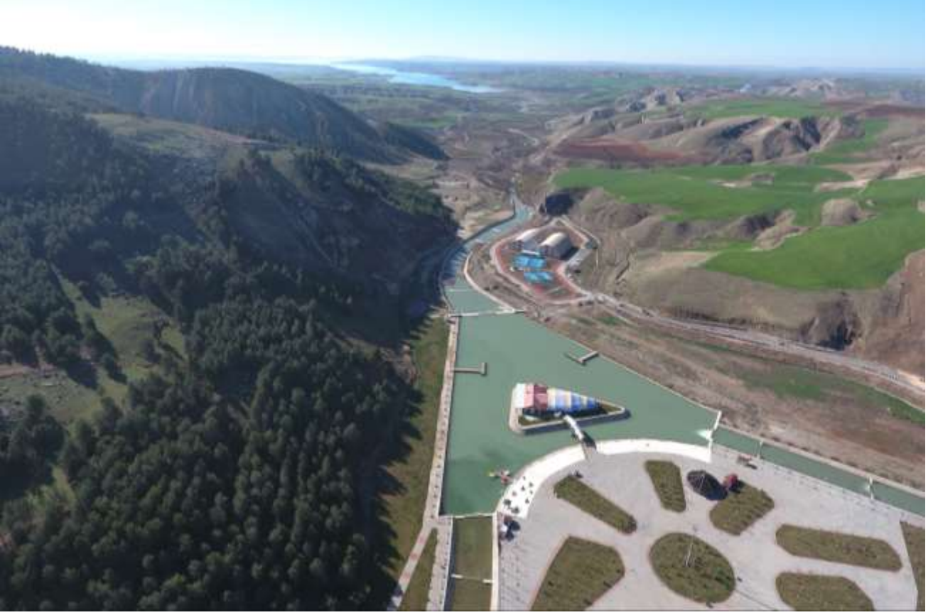
Bespinar Vadisi Rekreasyon Projesi