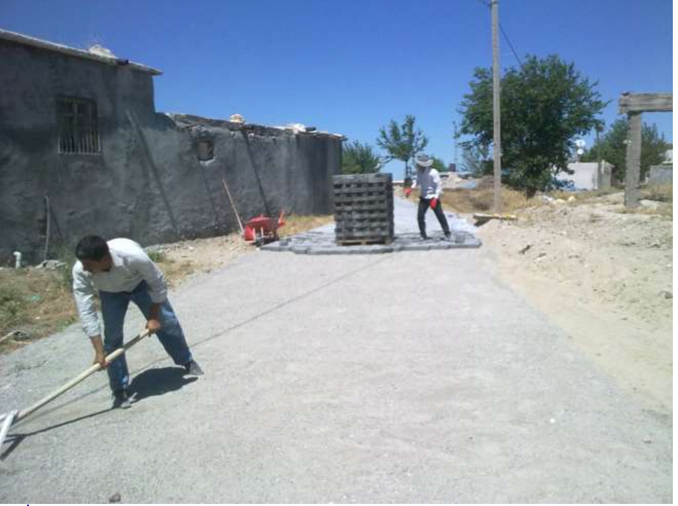
Köy İçi Kilitli Parke Taşı Döşeme Çalışması