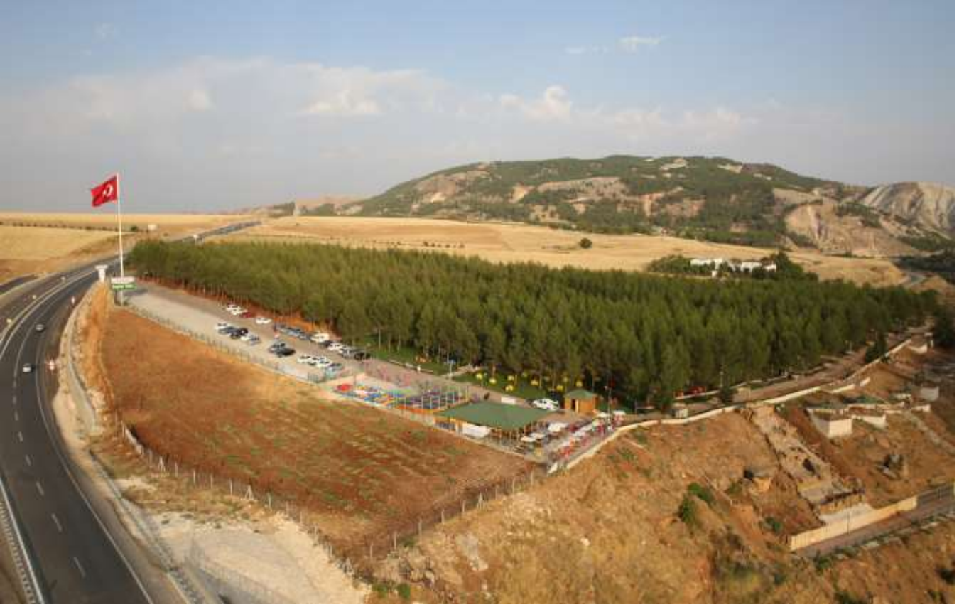
Beşpınar Vadisi Rekreasyon Projesi – Sosyal Tesisleri–Çamlık Projesi