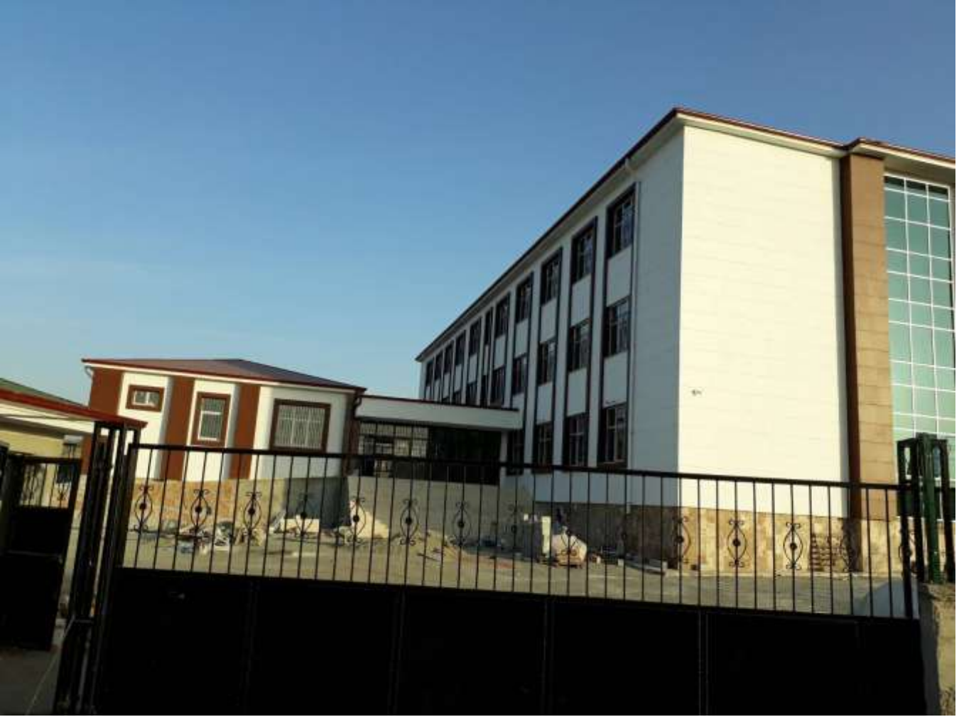
Gölbaşı Belören ÇPAL 12 Derslik