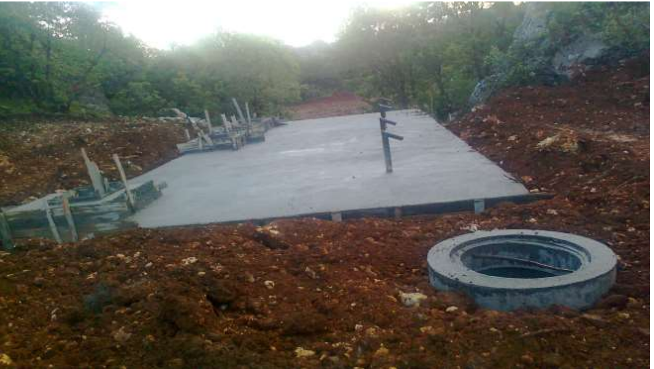
Merkez Taşoluk Köyü Kanalizasyon Tesisi Çalışması