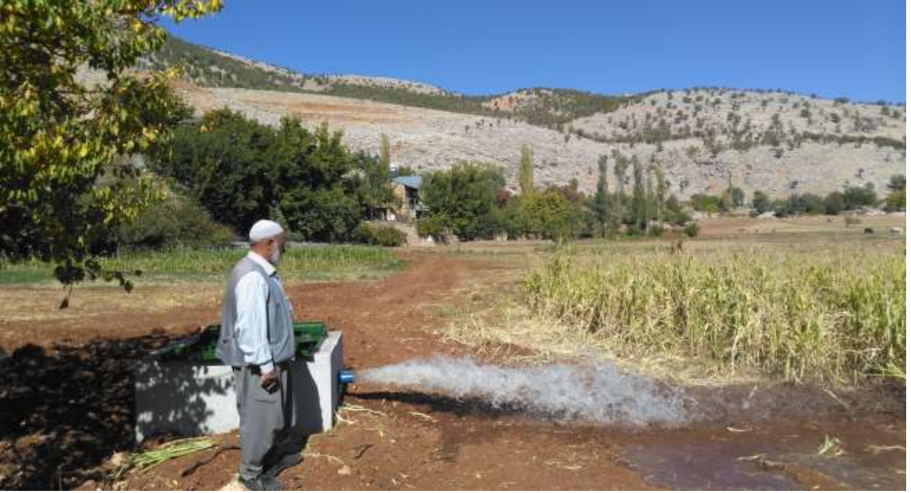
Kâhta Karagüven Köyü Tarımsal Sulama Tesisi