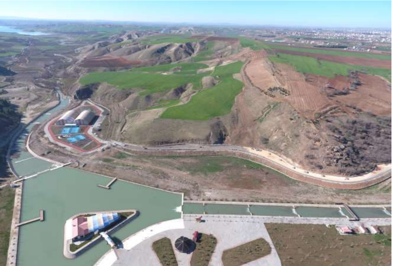
Bespinar Vadisi Rekreasyon Projesi