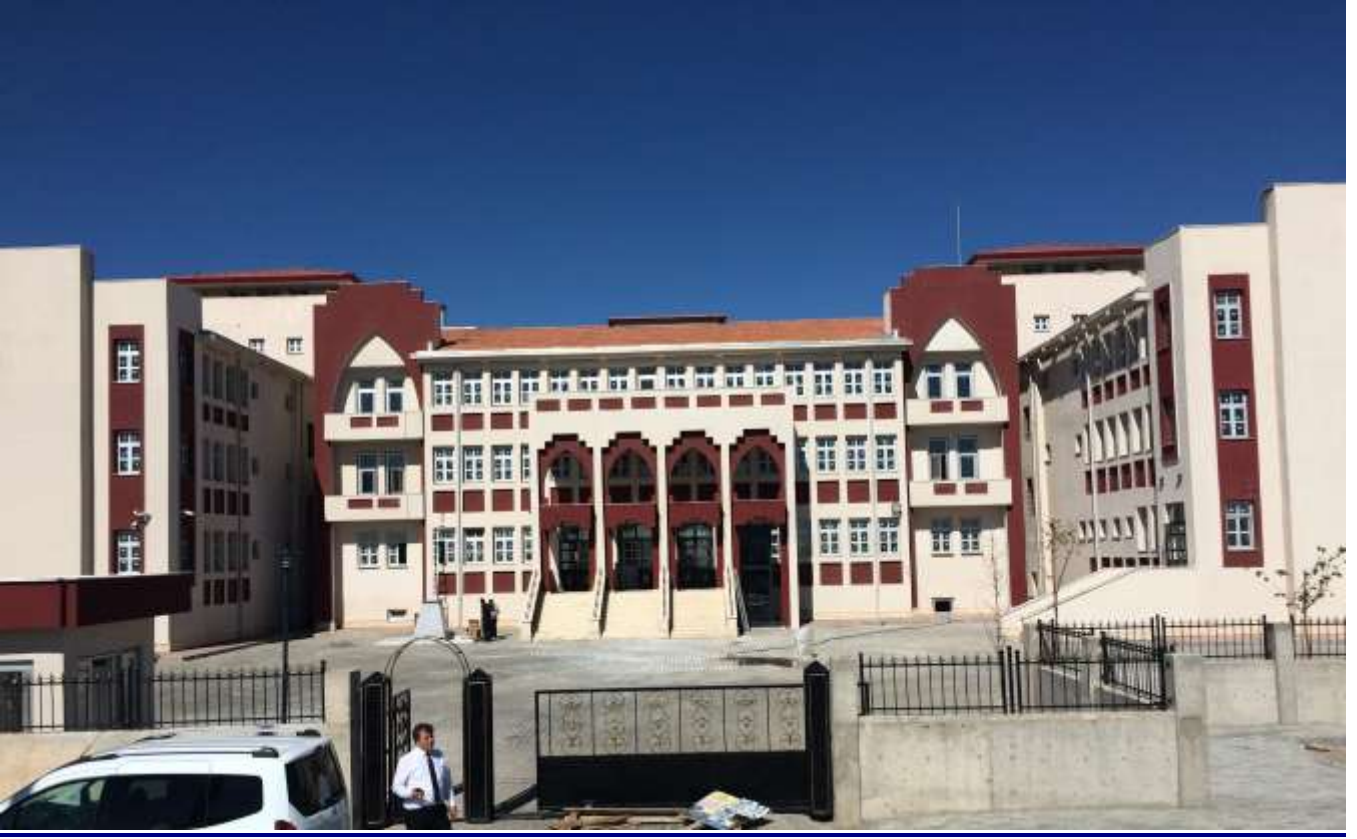
Besni Kayaardı Mevkii İlkokulu 24 Derslik