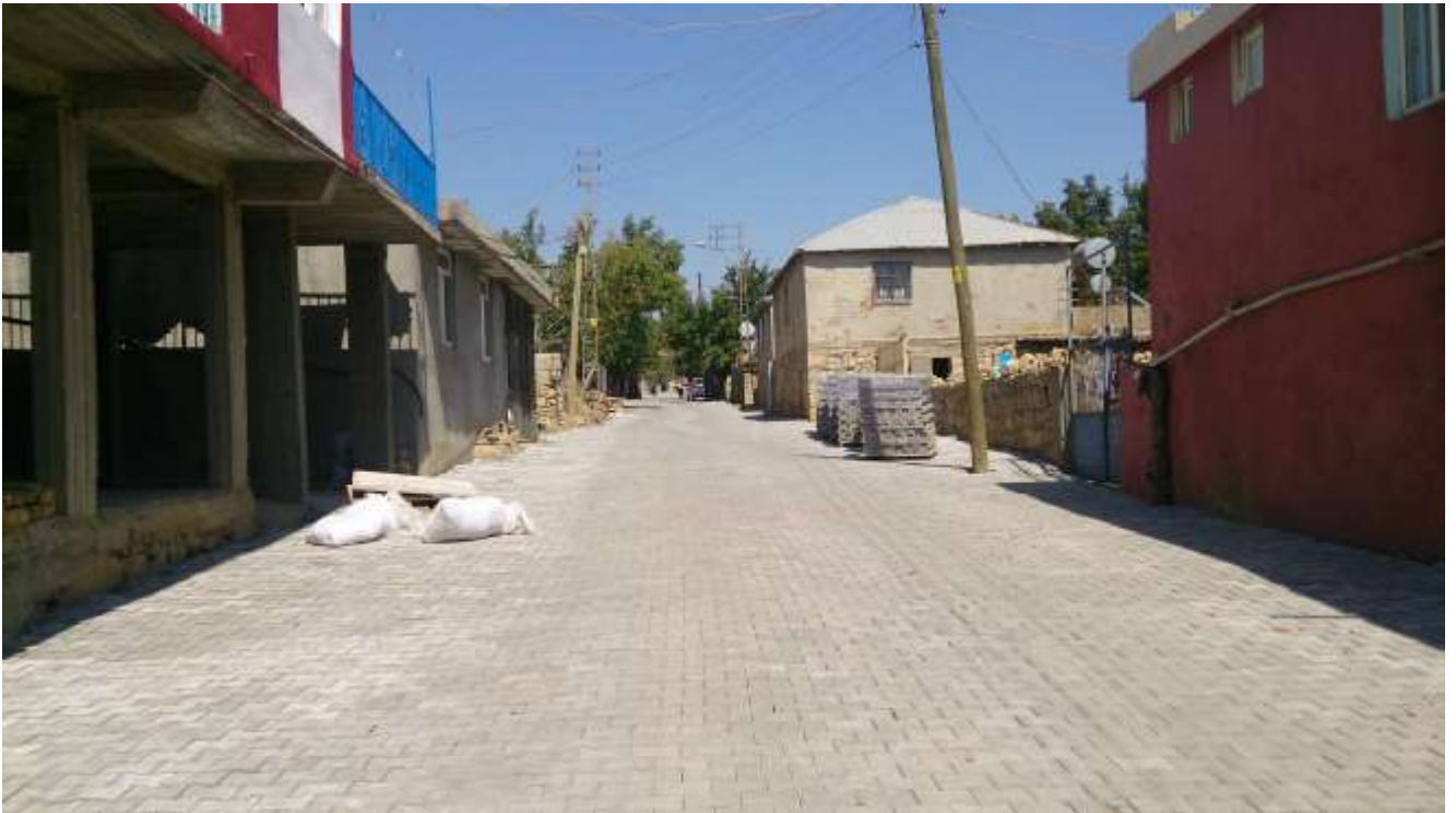
Köy İçi Kilitli Parke Taşı Döşeme Çalışması