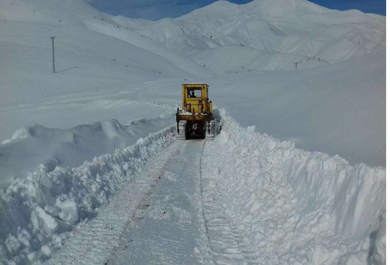
Sincik İlçesi Köy Yollarında Kar Mücadele Çalışması