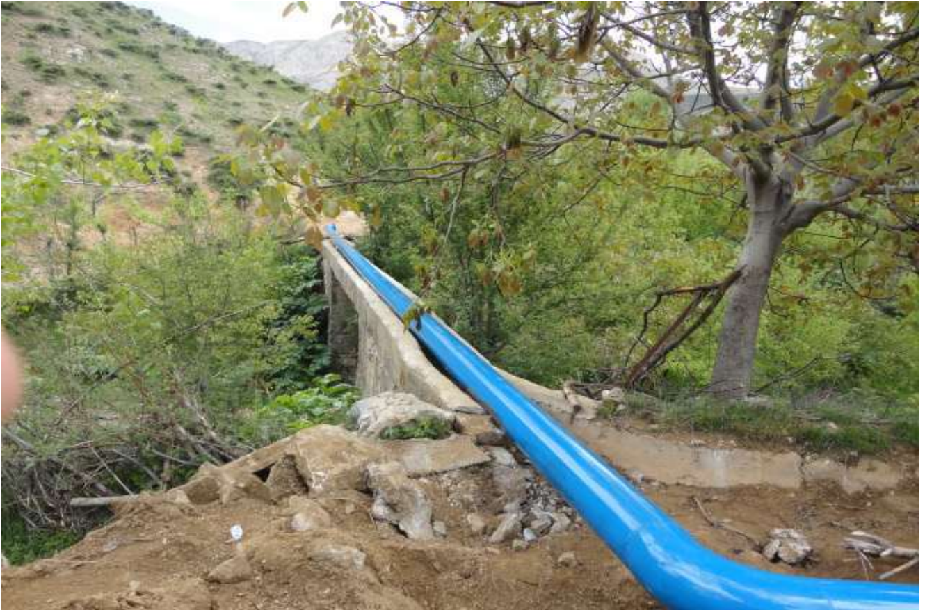
Çelikhan İlçesi Şerefhan Köyü Tarımsal Sulama Tesisi