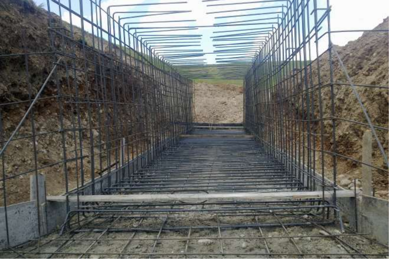
Menfez Yapımı Çalışması