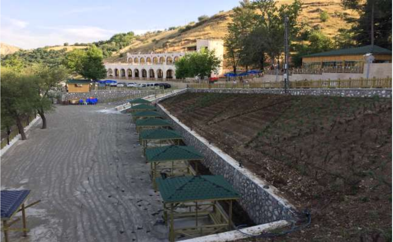
Beşpinar Vadisi Rekreyasyon Projesi – Sosyal Tesisleri