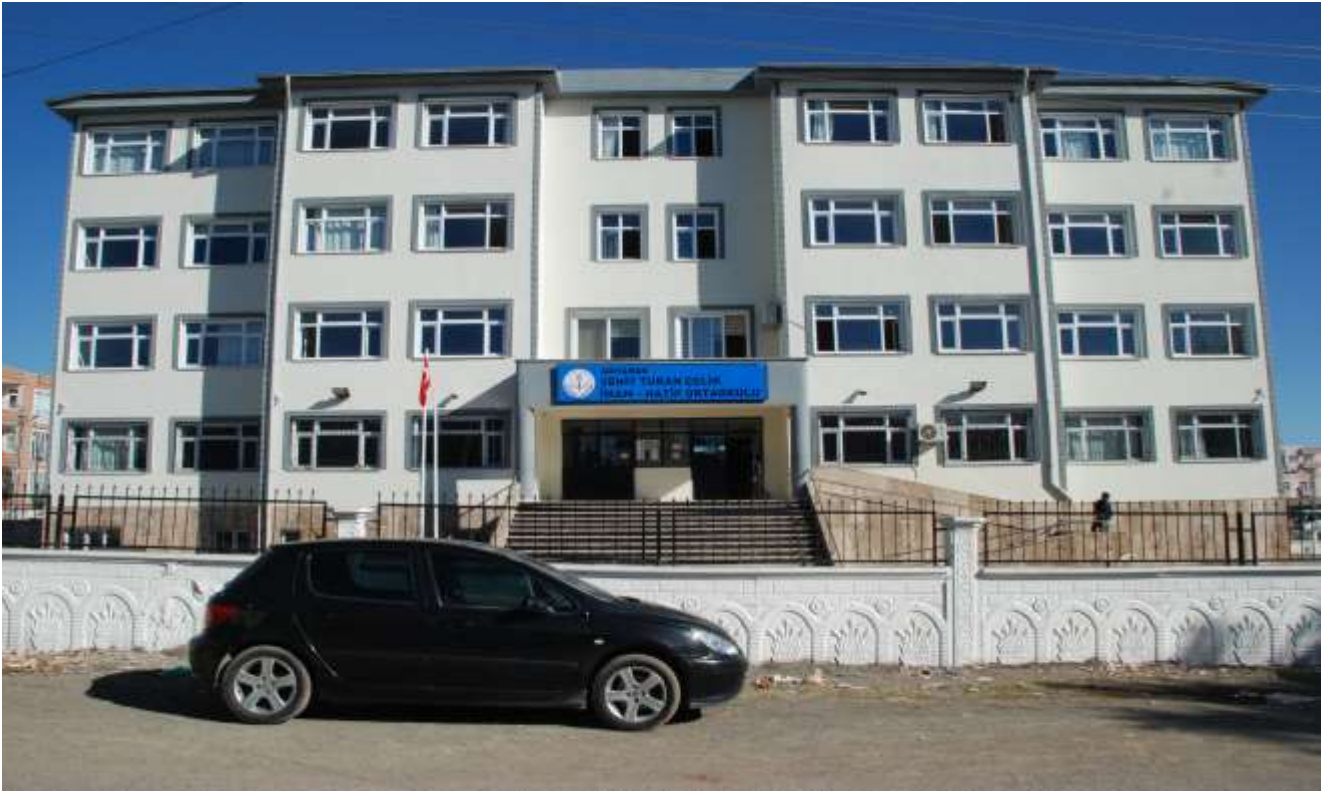
Merkez Malazgirt 16 Derslikli İlkokul (Turan Çelik İmam Hatip)