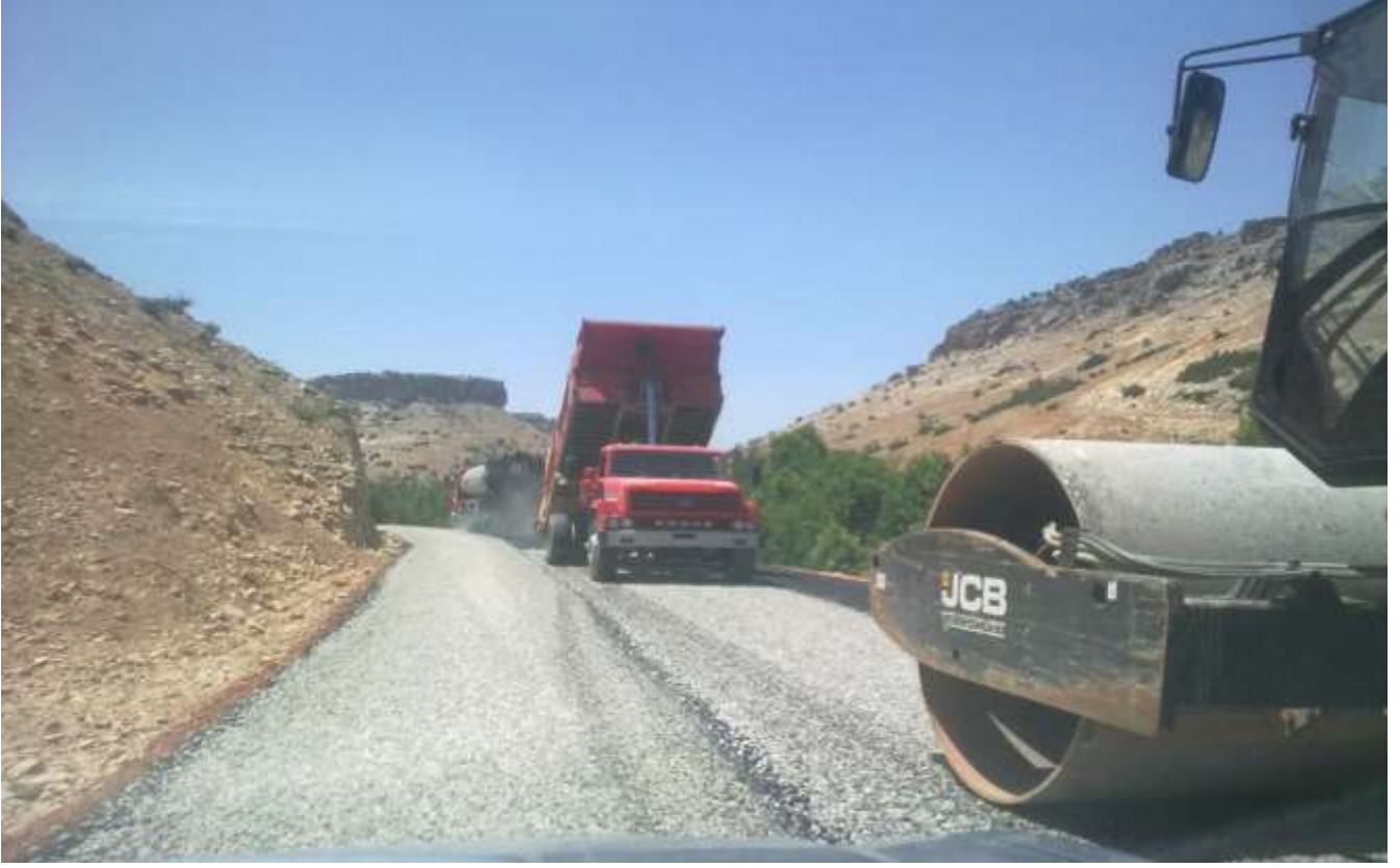
Köy Yolları Asfalt Çalışması