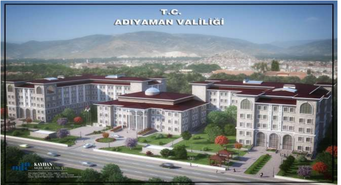
Adıyaman Valiliği Hükümet Konağı ve İl Özel İdare Binası

Adıyaman Valiliği Hükümet Konağı ile İl Özel İdaresi Hizmet Binasının yapımı işi 2015 yılında KDV hariç 48.288.840,24 TL'ye ihale edilerek yapımına başlanılmış olup, 2019 yılında bittirilmesi hedeflenmektedir.