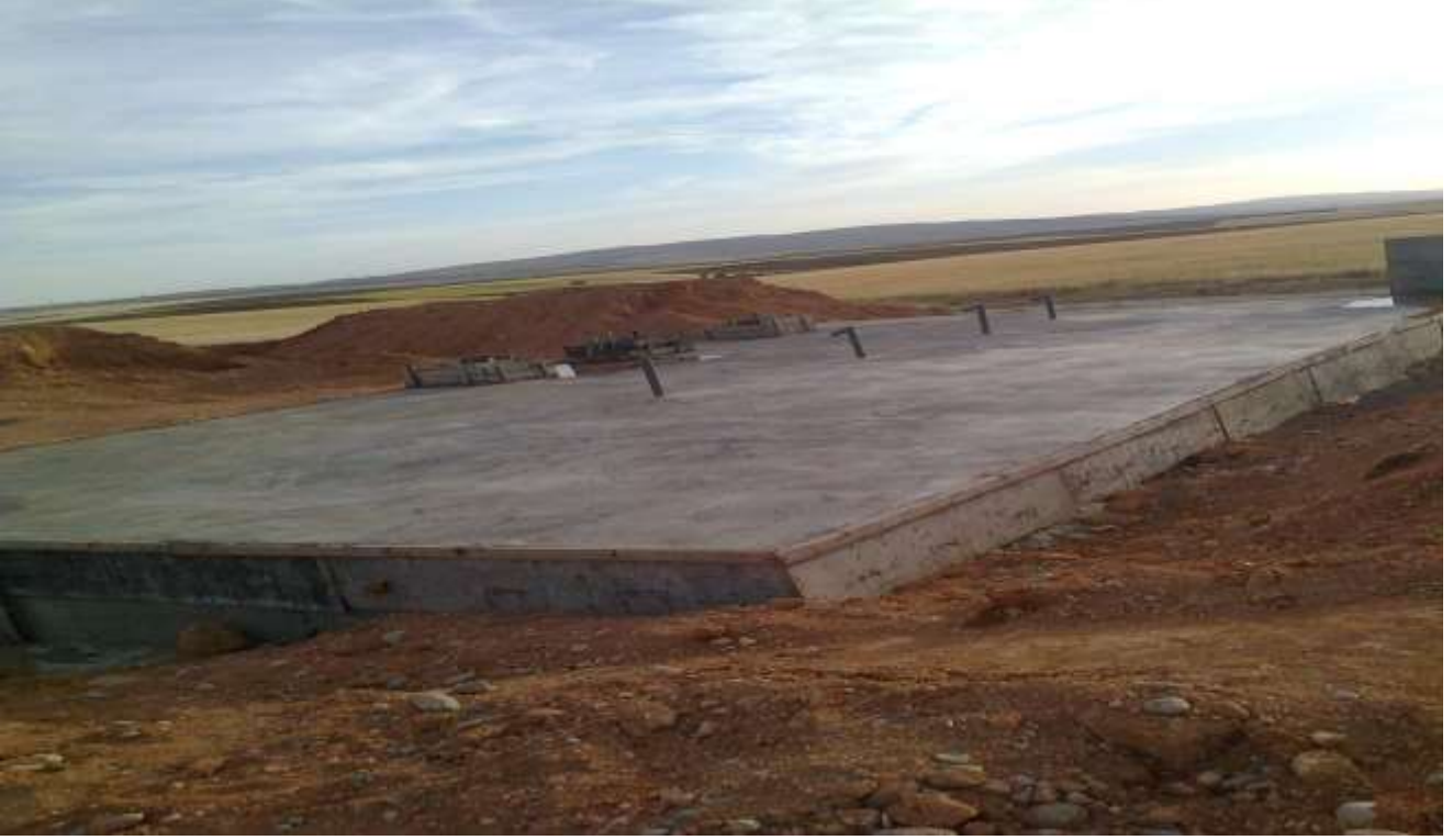
Merkez Durak Köyü Kanalizasyon Tesisi Çalışması