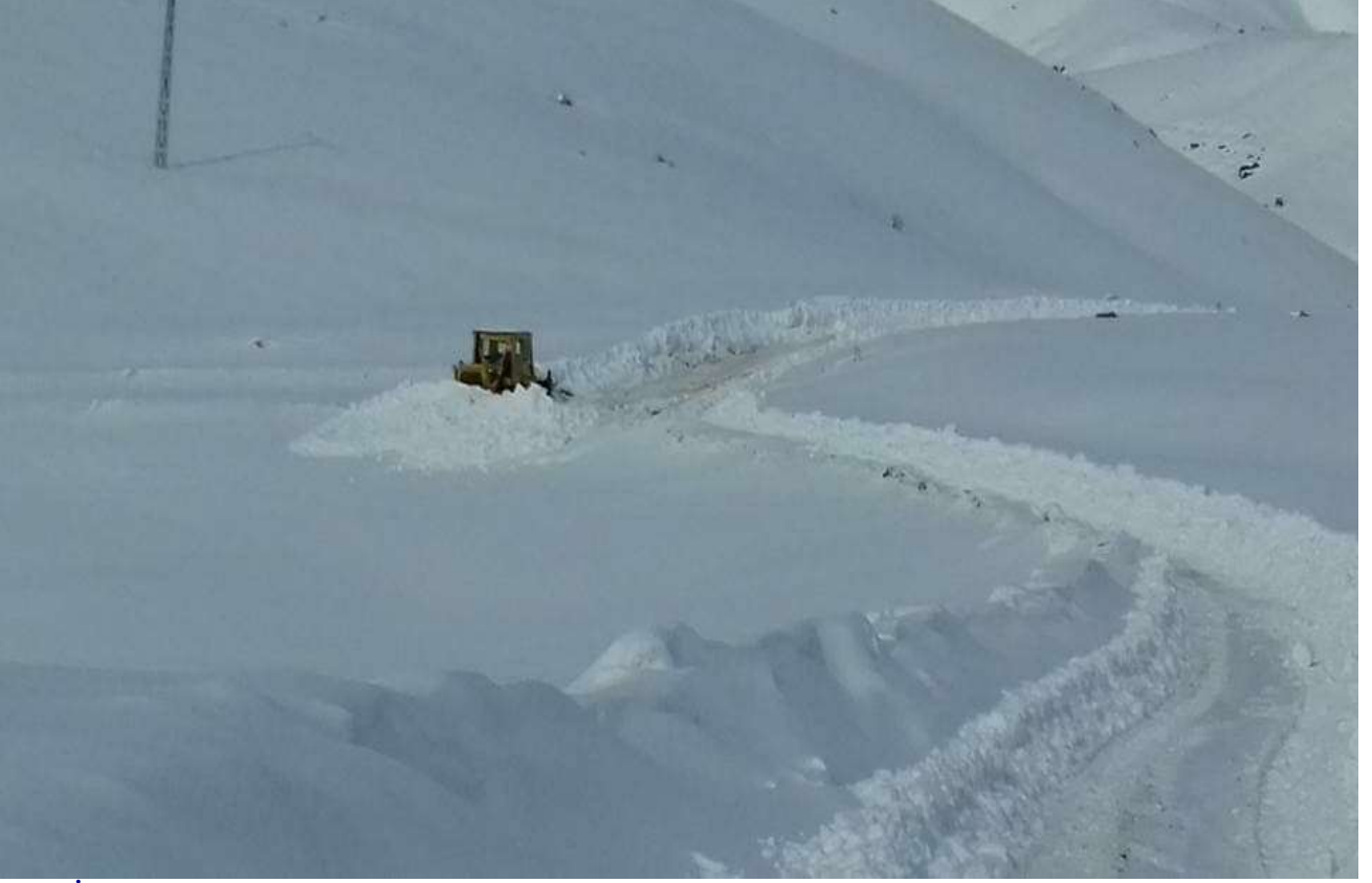
Sincik İlçesi Köy Yollarında Kar Mücadele Çalışması