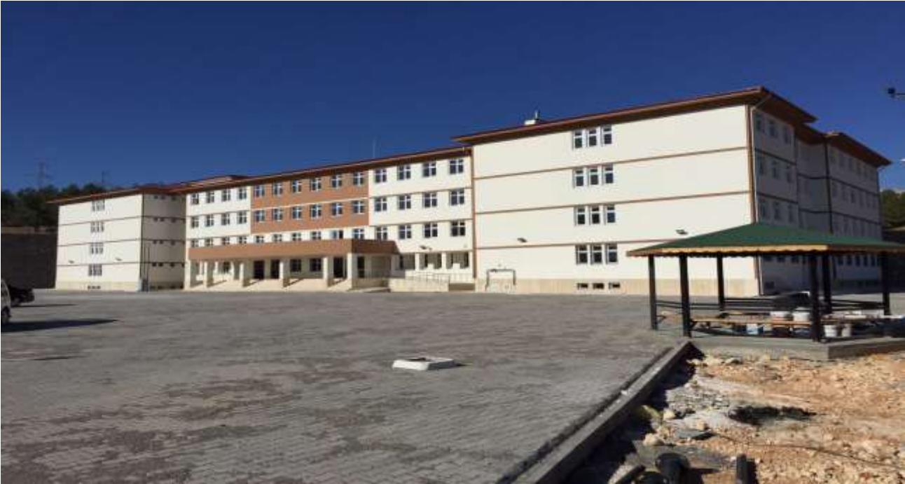
Merkez İndere Köyü 32 Derslikli İlköğretim Okulu