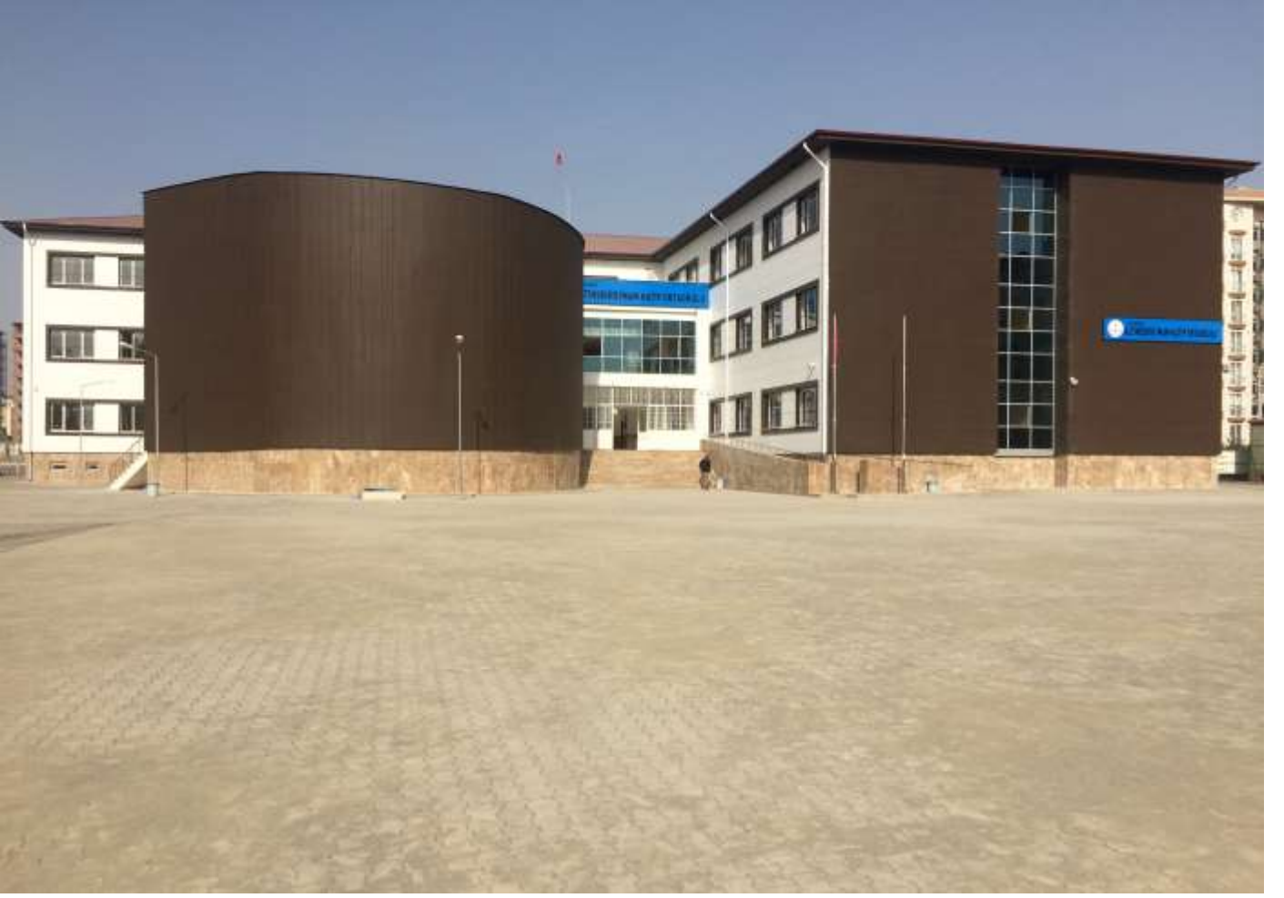
Merkez Altınşehir Ortaokulu (Altınşehir İHO) 24 Derslik