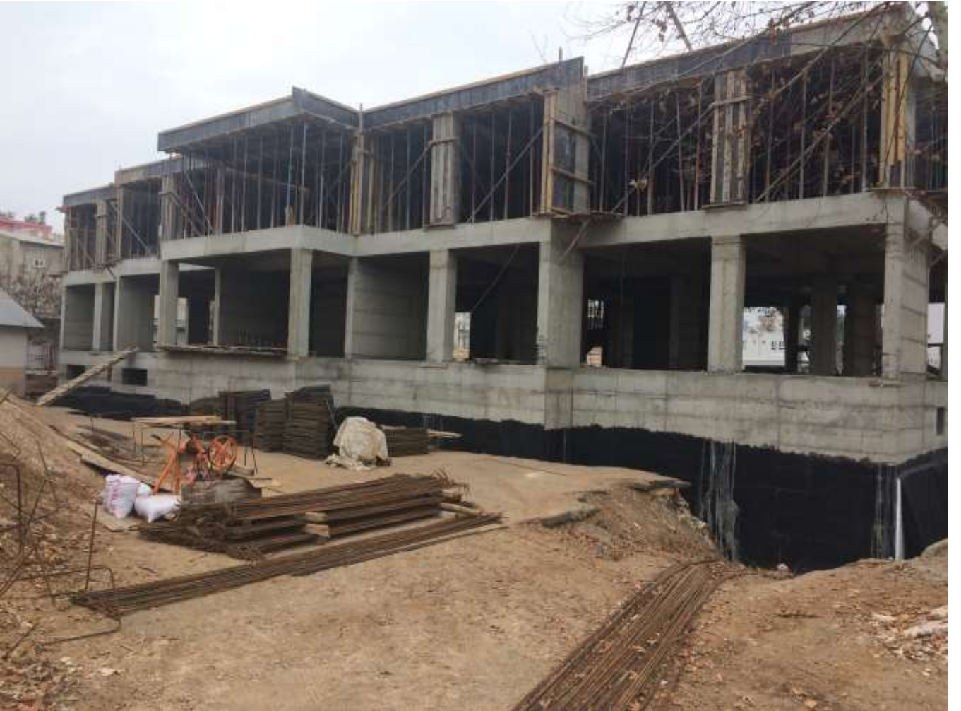
Merkez Birsen ESENSOY İlkokulu 16 Derslik