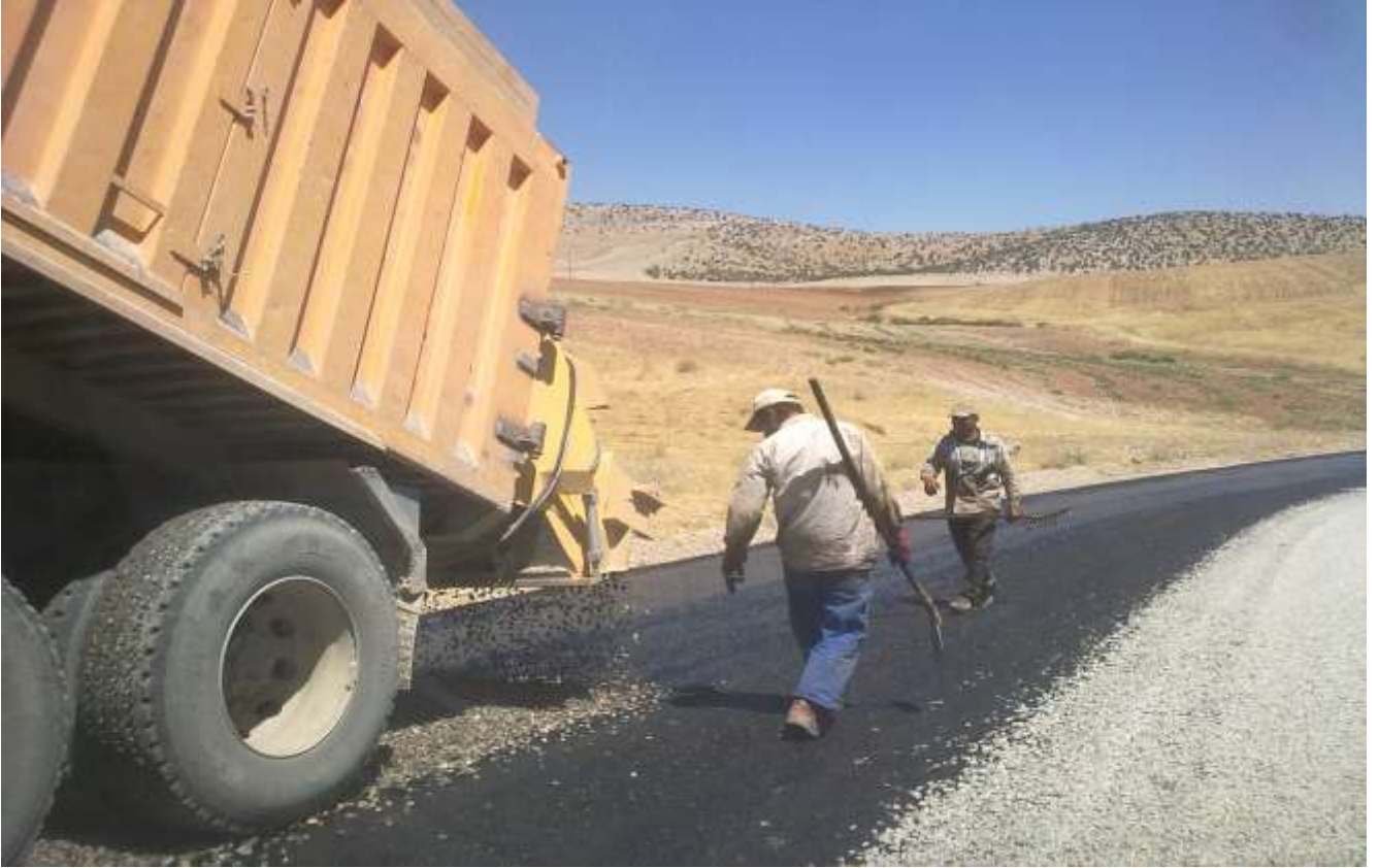
Köy Yolları Asfalt Çalışması