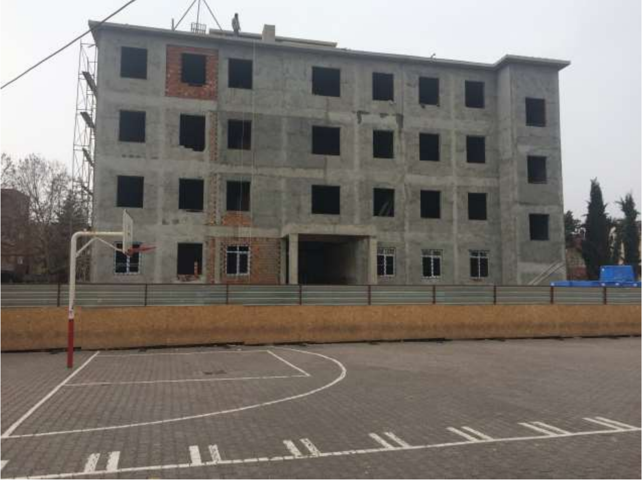
Merkez Menderes Ortaokulu 16 Derslik