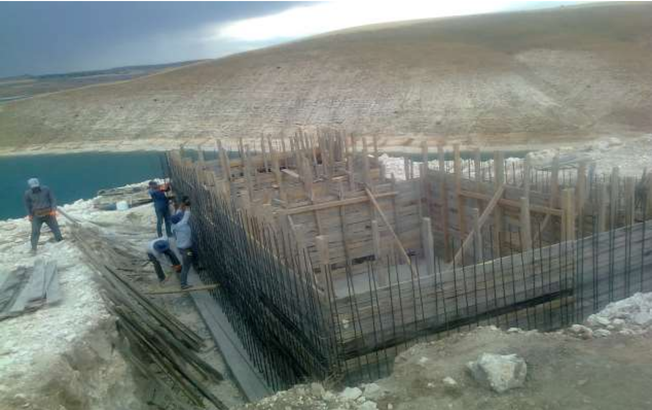
Kahta İlçesi Yeşilkaya Köyü Kanalizasyon Tesisi Çalışması