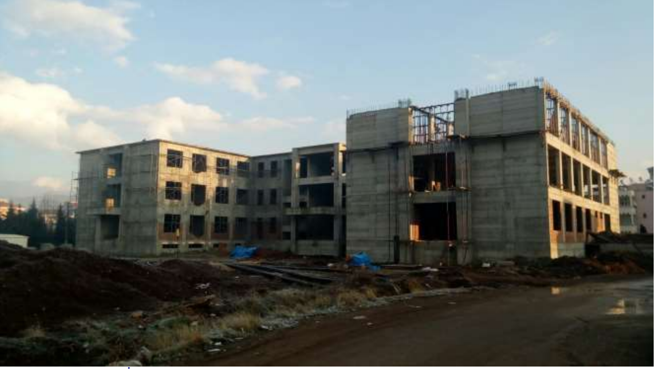
Gölbaşı Mimar Sinan İlkokulu 24 Derslik