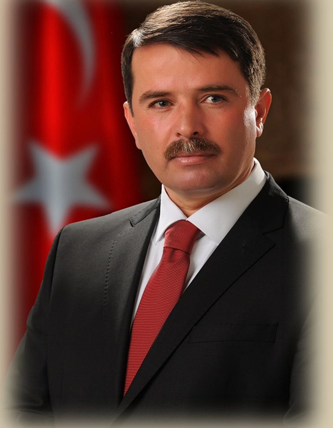
OSMAN OKUMUŞ TÜRKOĞLU BELEDİYE BAŞKANI