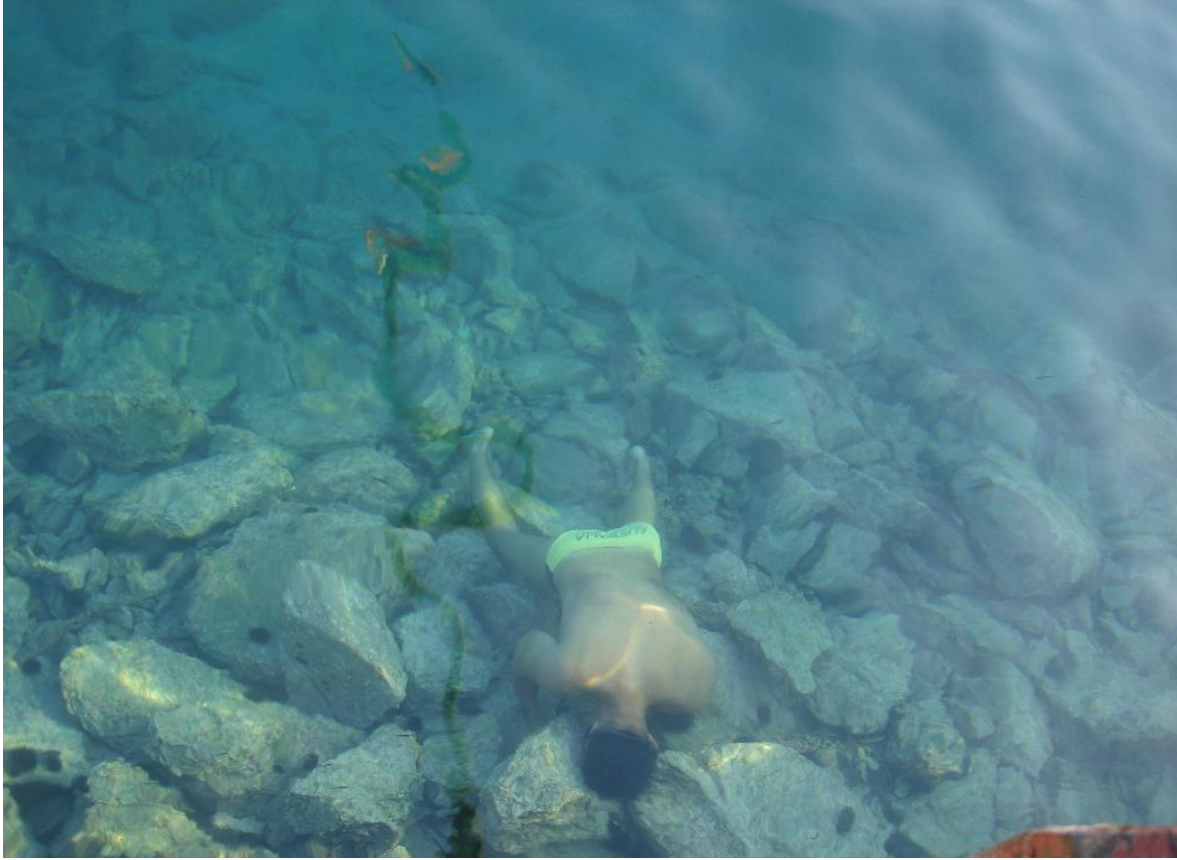
Resim – 5: Sualtı Topluluğu Kabotaj Bayramı Yarışmalarında

Tablo 3’de Üniversitemizde faaliyet gösteren öğrenci topluluklarının 2010 yılında gerçekleştirmiş olduğu bilimsel ve kültürel etkinliklere göre dağılımı görülmektedir. Toplam 717 farklı etkinlik düzenlenmiştir.