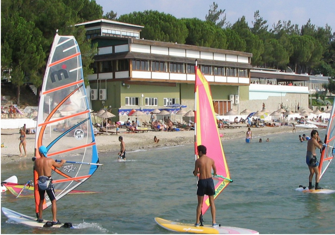
Resim - 4: Üniversitemiz Dardanos Tesisinden bir Görüntü.