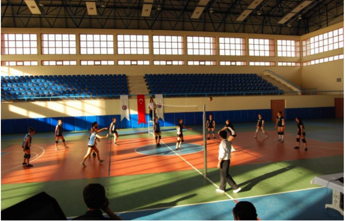
Resim - 2: Üniversitemiz Beden Eğitimi ve Spor Yüksekokulu Spor Salonundan Görüntüler.