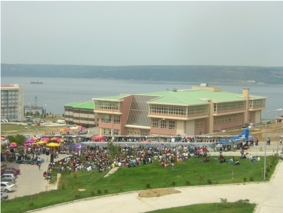
Üniversitemiz Terzioğlu Yerleşkesinden görüntüler.