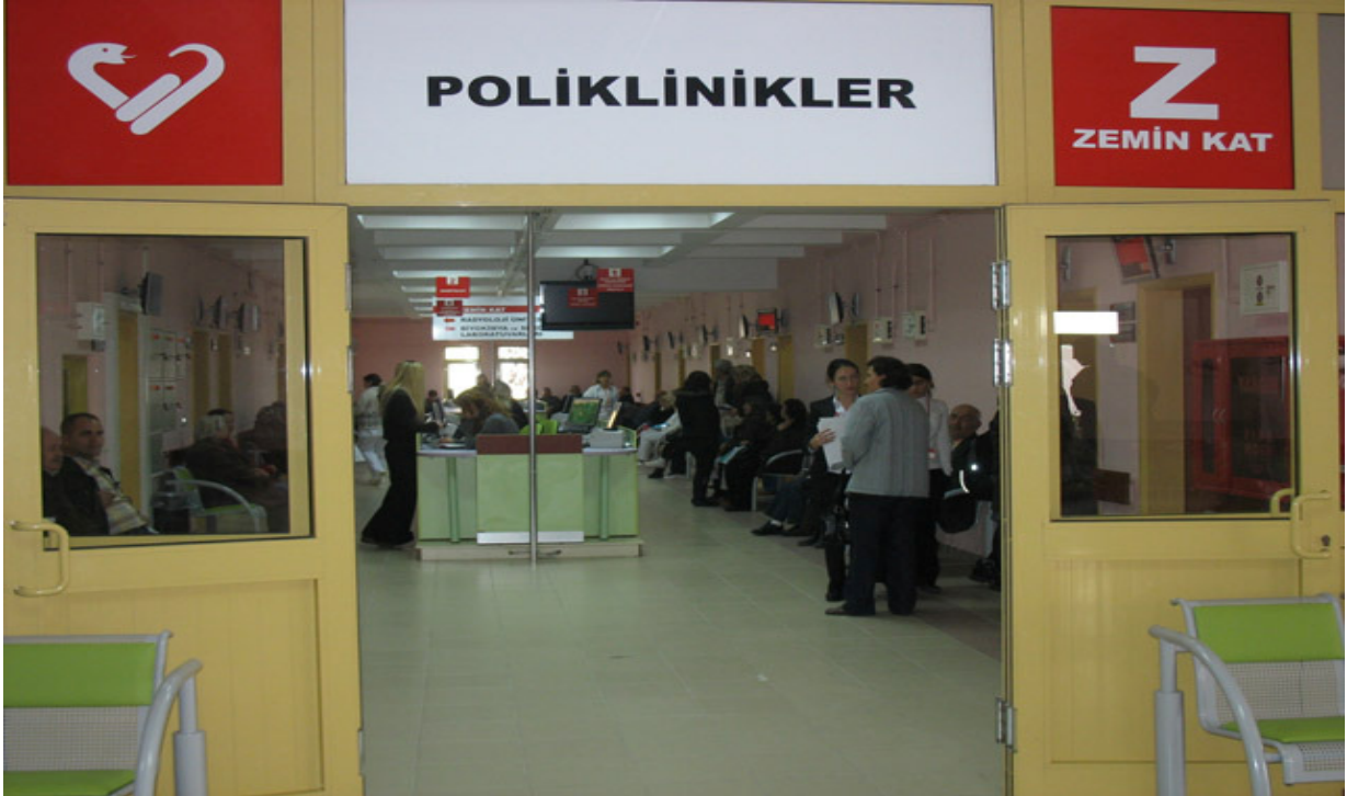
Resim – 7: ÇOMÜ Araştırma ve Uygulama Hastanesi.