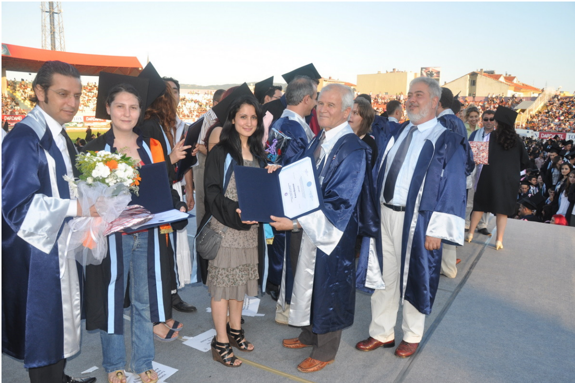
Resim - 5: Üniversitemiz 2008 -2009 Eğitim Yılı Mezuniyet Töreni.