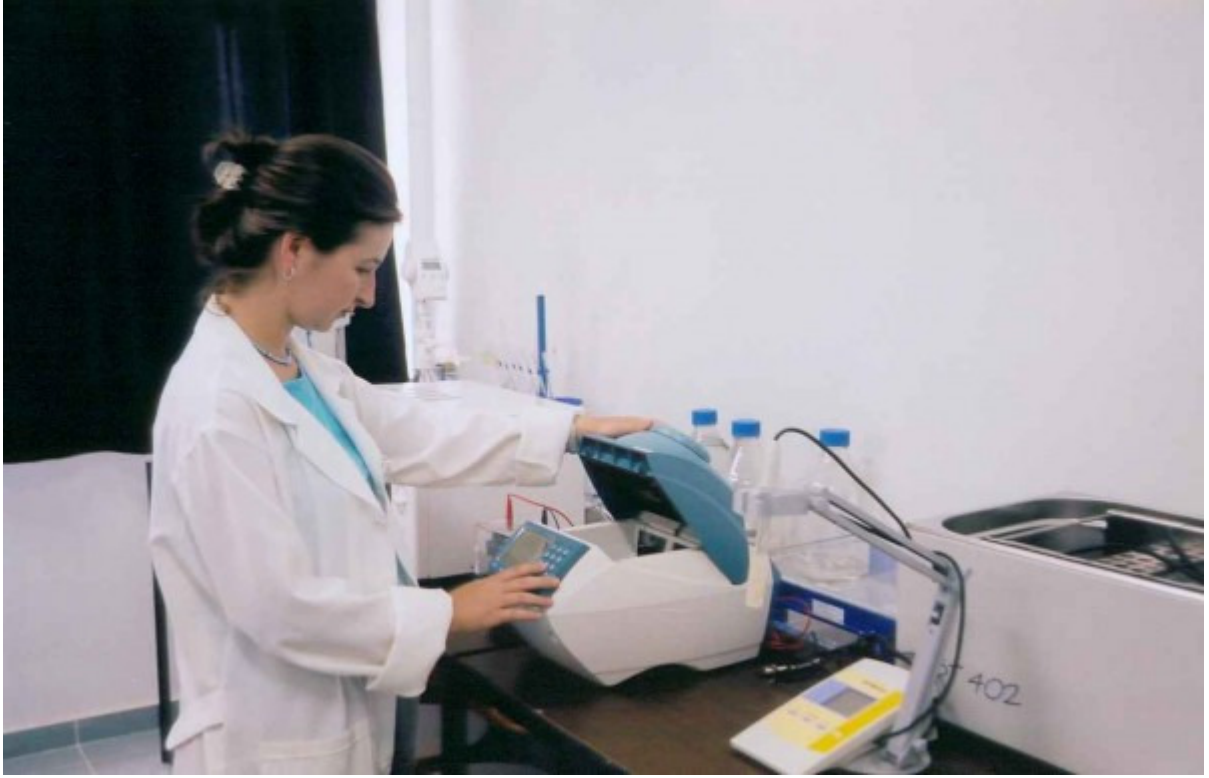
Resim – 8: Mediko'dan Görüntüler.