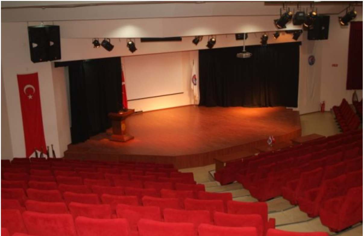
Resim - 3: Troia Kültür Merkezi.