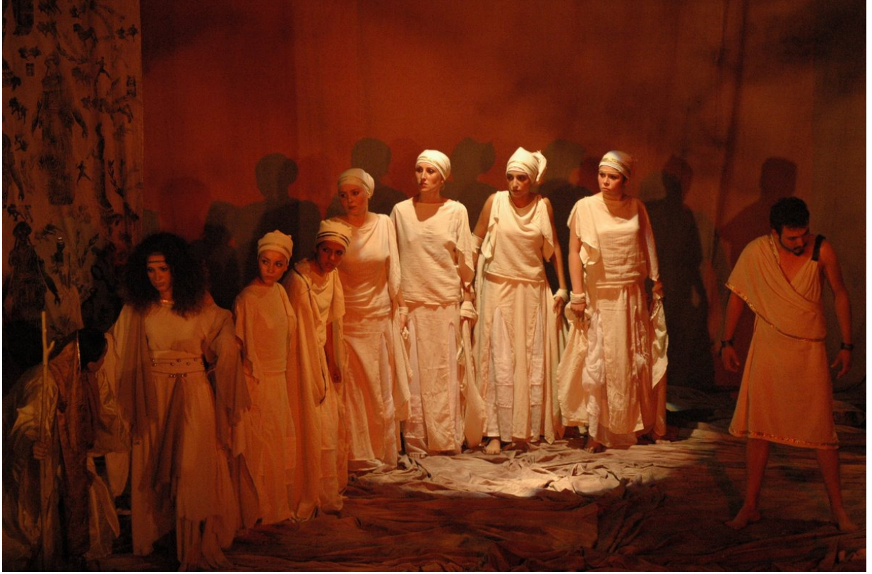
Resim - 6: Tiyatro Topluluğunun Gösterisi.