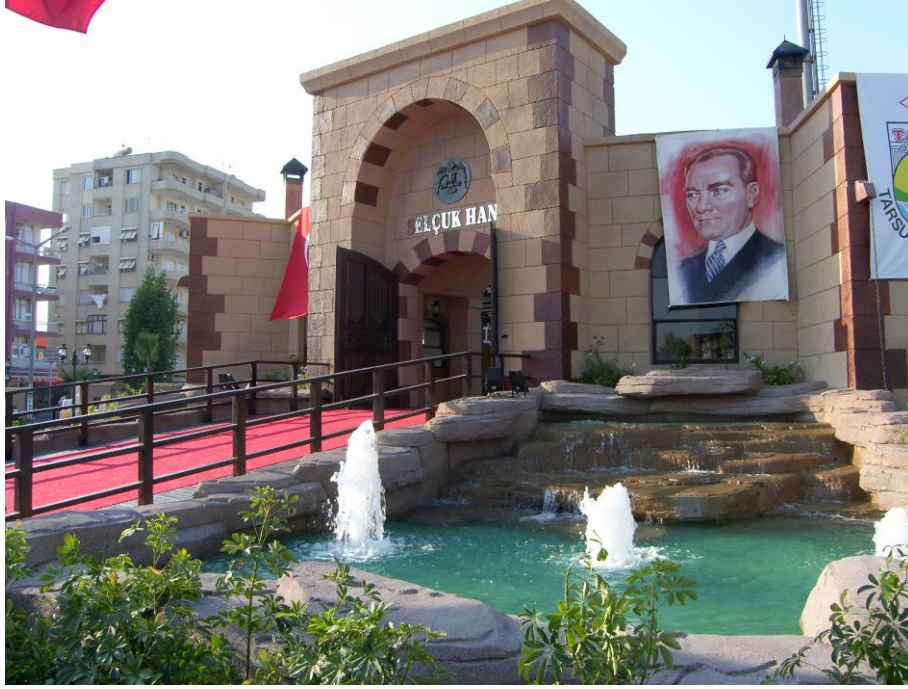
Selçuk Han Restoranı