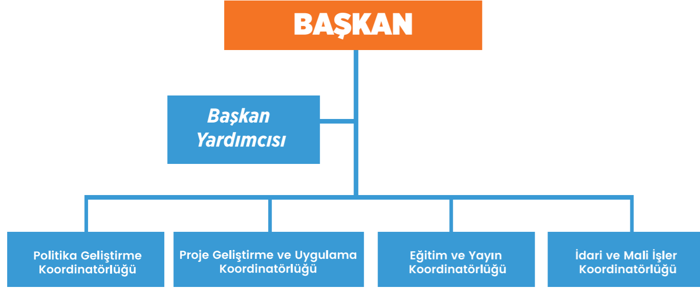
Şekil 1: Enstitü Başkanlığı Teşkilat Şeması

4 sayılı Cumhurbaşkanlığı Kararnamesininin 470. maddesi uyarınca belirlenen görevleri yerine getirmek gayesiyle oluşturulan teşkilat, Yönlendirme Komitesi, Yönetim Kurulu ve Enstitü Başkanlığından oluşur (Şekil 1).