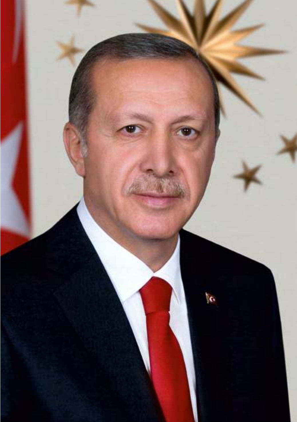
Recep Tayyip ERDOĞAN Türkiye Cumhuriyeti Cumhurbaşkanı