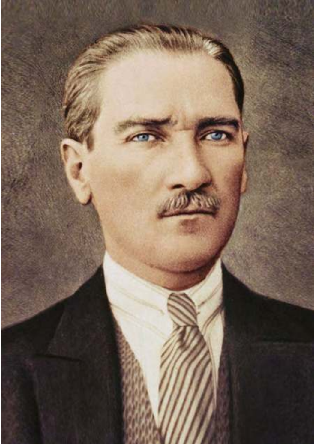
Mustafa Kemal ATATÜRK