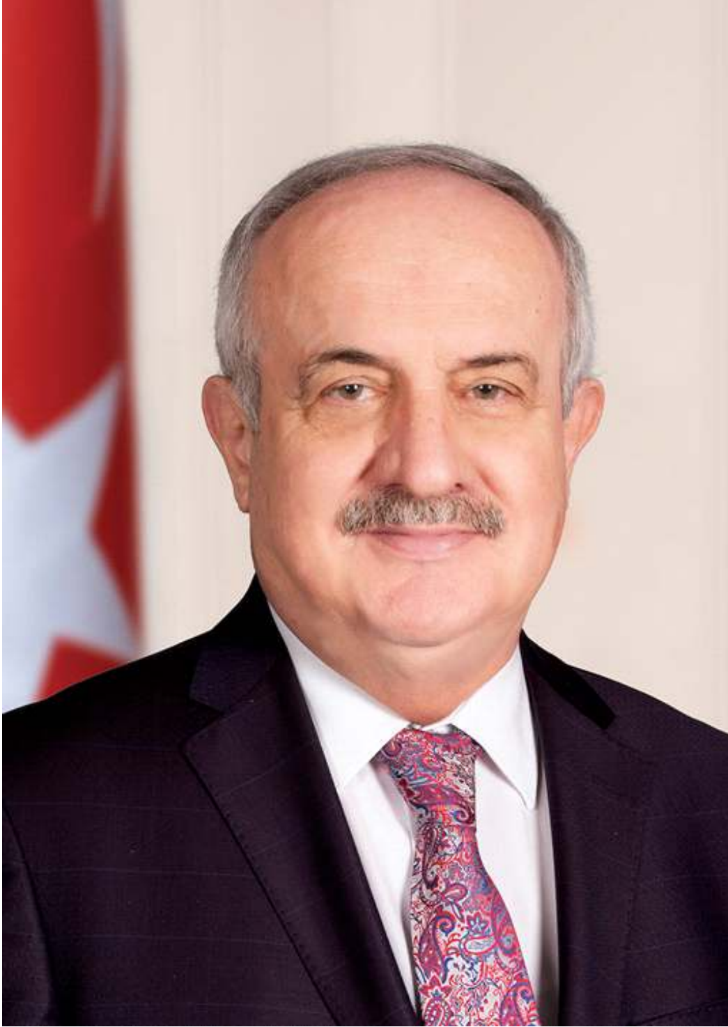
Zeki AYGÜN DERİNCE BELEDİYE BAŞKANI