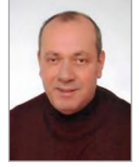
Lütfi ÇAVUŞ Adalet ve Kalkınma Partisi