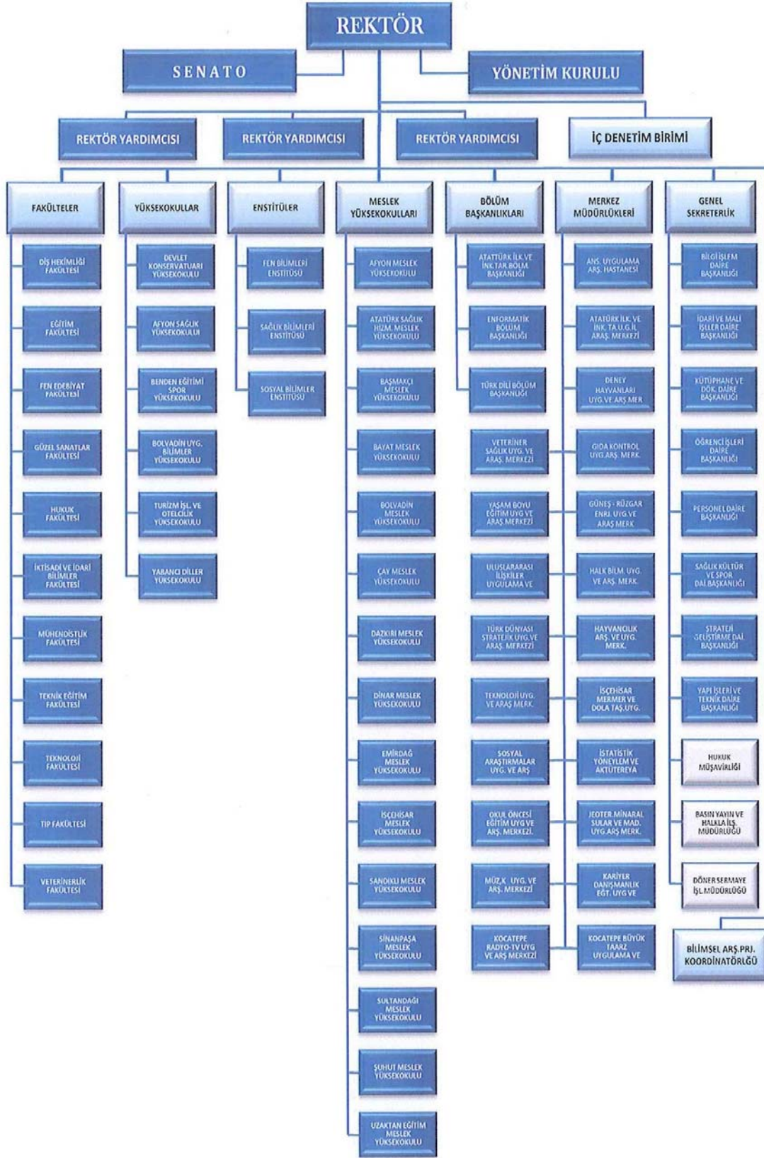
Şekil 1: Organizasyon Şeması

STRATEJİK GELİŞTİRME DAİRE BAŞKANLIĞI İç Kontrol Şube Müdürlüğü