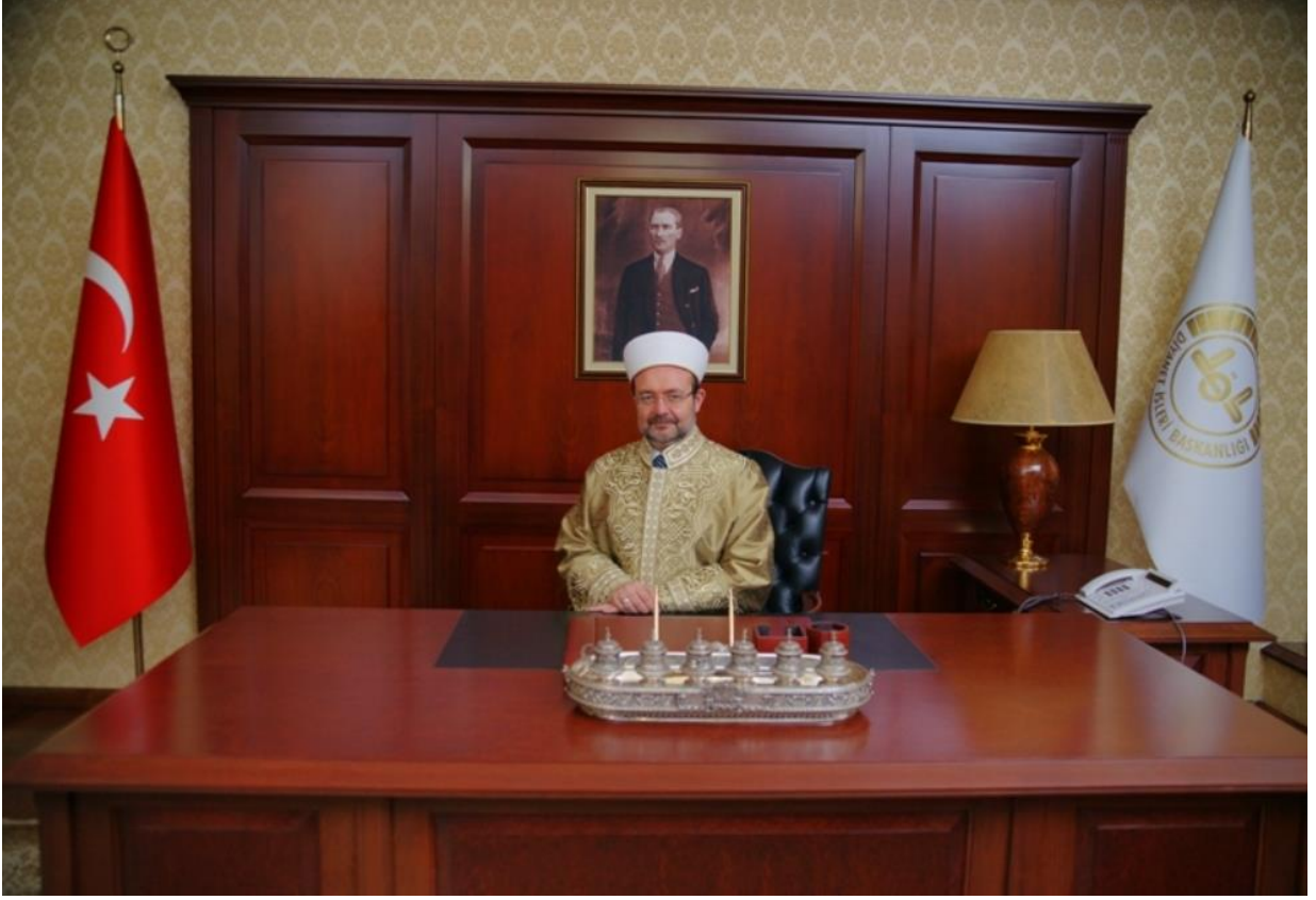
Prof. Dr. Mehmet GÖRMEZ Diyadin İşleri Başkanı