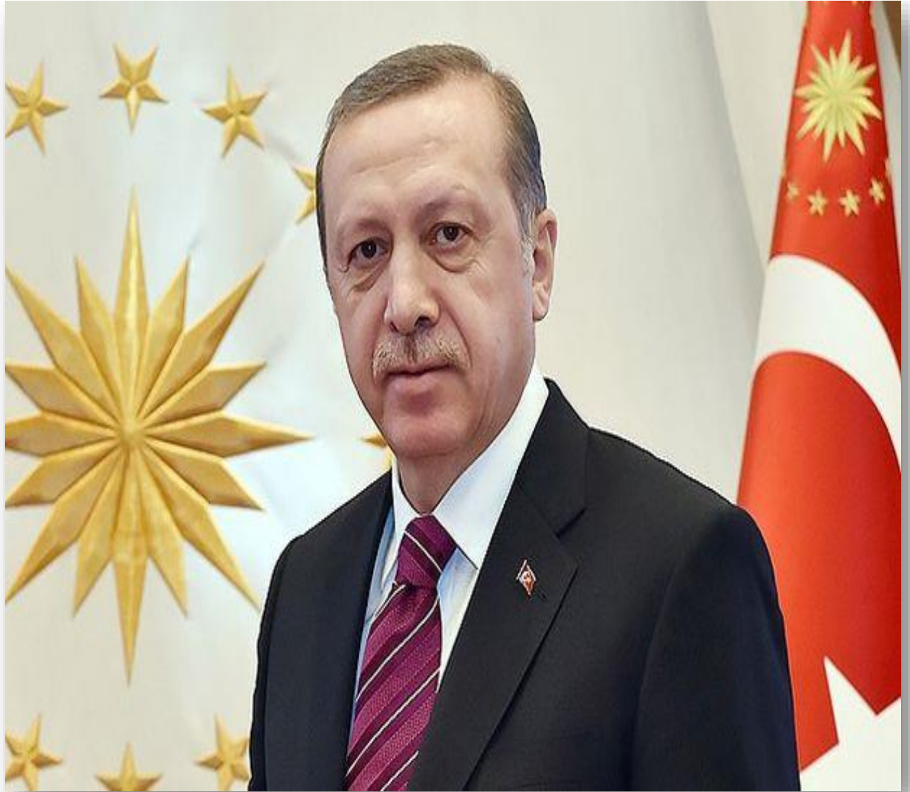
RECEP TAYYİP ERDOĞAN