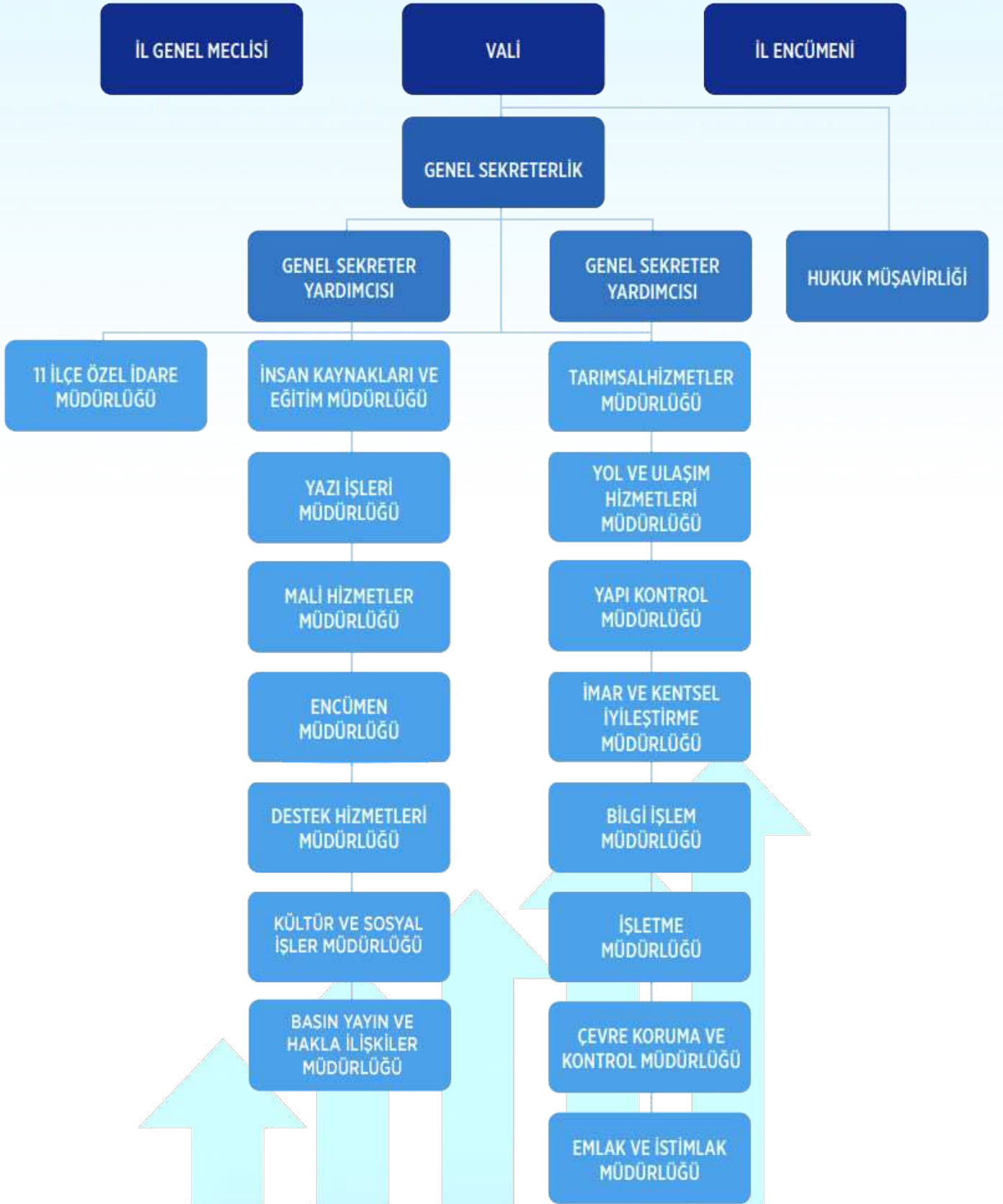
Şekil 1. İl Özel İdaresi Teşkilat Şeması