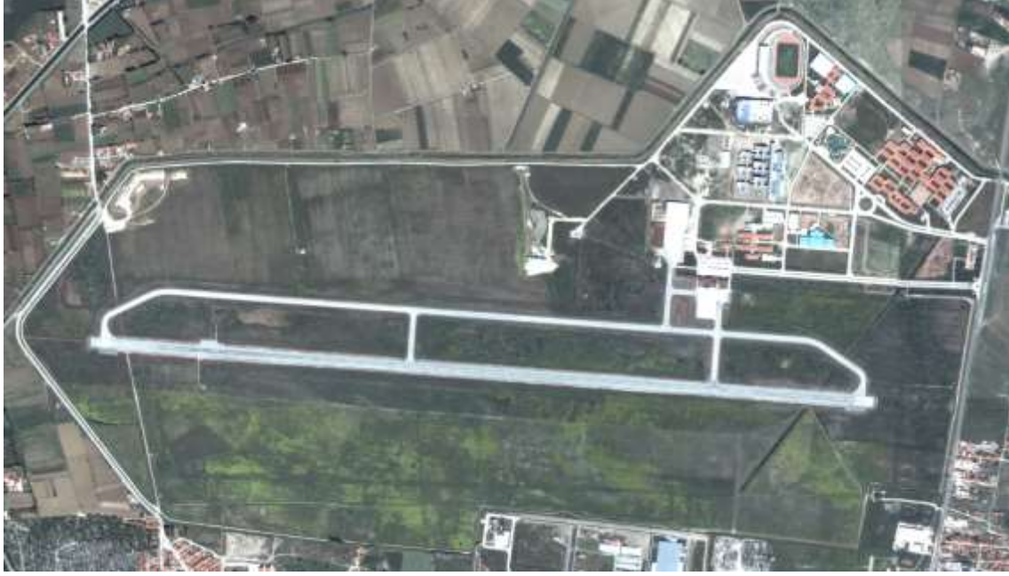
RESİM 3: İKİ EYLÜL YERLEŞKESİ

Üniversitemizin ikinci büyük yerleşkesi olan İki Eylül Yerleşkesi, kentin kuzeyinde ve kente beş km uzaklıktadır. Yerleşkenin toplam alanı 3.790.893 m 2 olup, bunun 485.000 m 2 'si yeşil alandır. Bu yerleşkemizde bulunan birimler şunlardır: