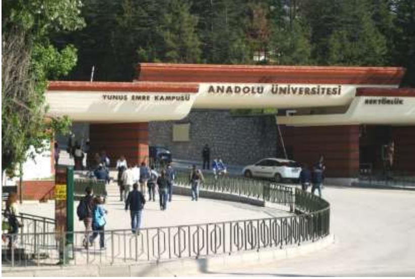
RESİM 1: YUNUSEMRE YERLEŞKESİ CUMHURİYET KAPISI