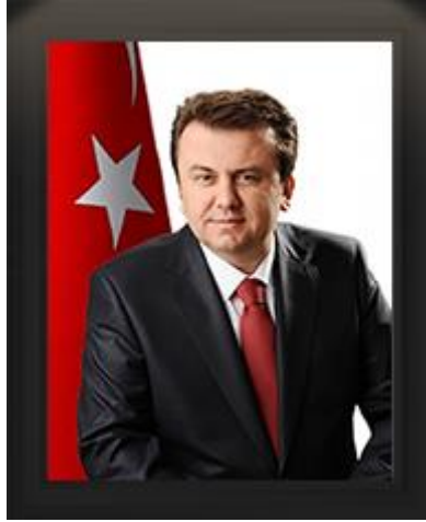
Fatih Mehmet ERKOÇ Büyükşehir Belediye Başkanı Yönetim Kurulu Başkanı