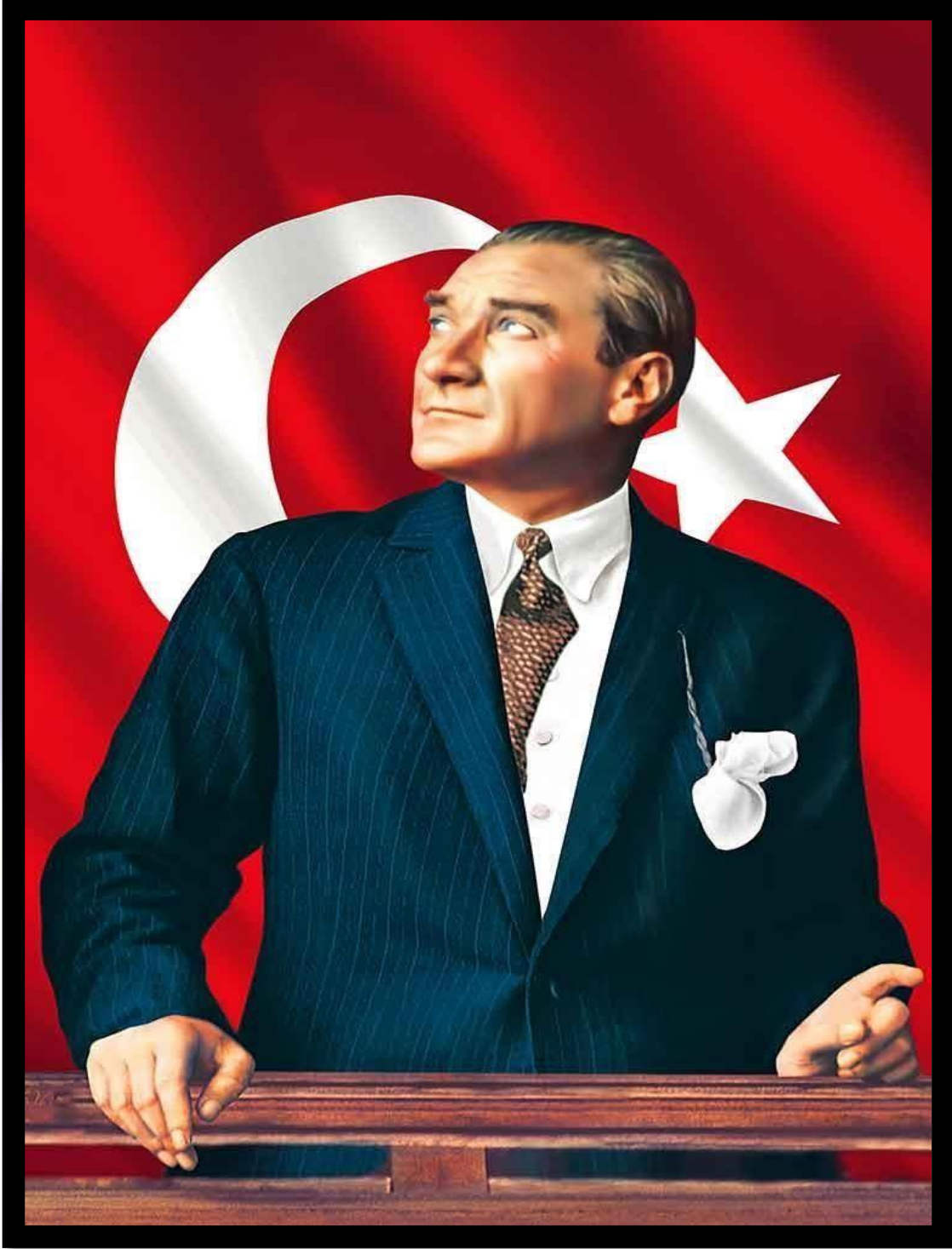
GAZİ MUSTAFA KEMAL ATATÜRK