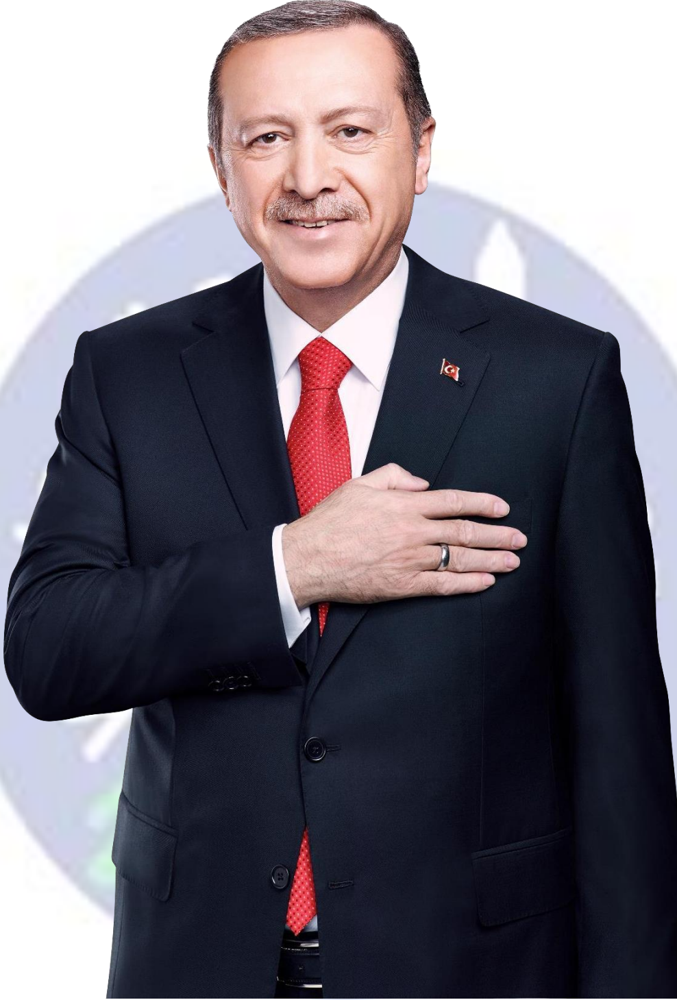
RECEP TAYYİP ERDOĞAN CUMHURBAŞKANI