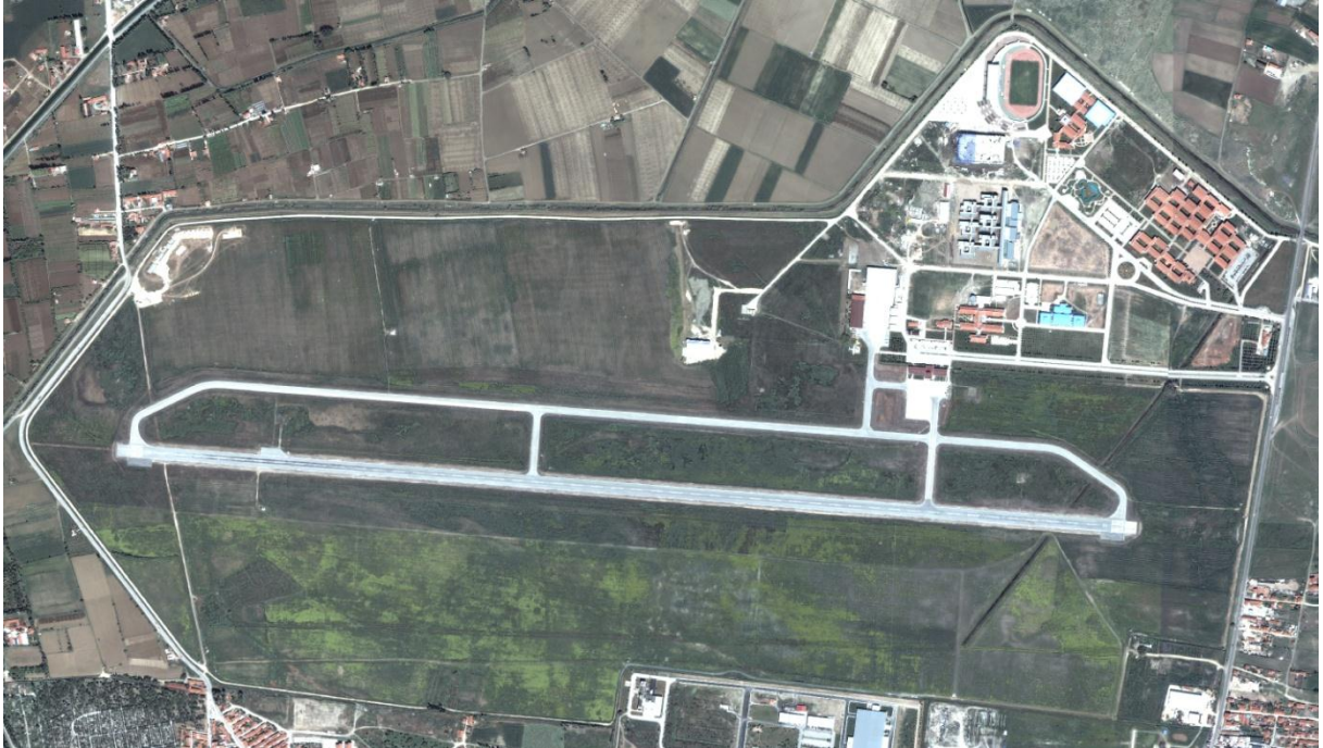
RESİM 3: İKİ EYLÜL YERLEŞKESİ