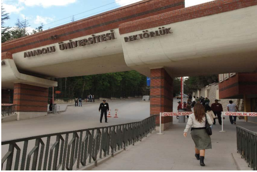
RESİM 1: YUNUSEMRE YERLEŞKESİ CUMHURİYET KAPISI