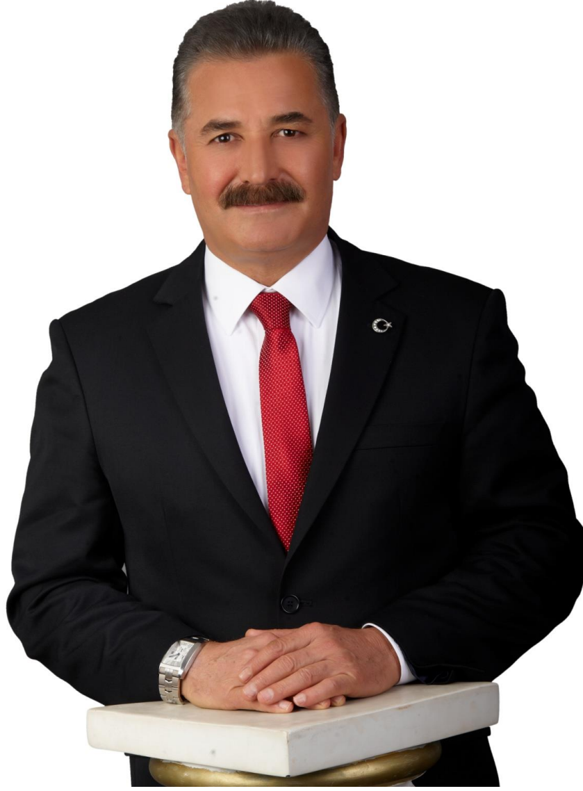
HAMİT TUNA TOROSLAR BELEDİYE BAŞKANI