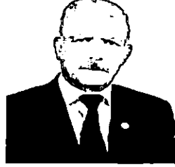
Çınar Belediye Başkanı