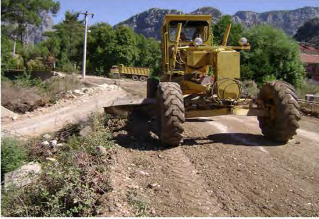
Grederle Yol Bakımı Proğram 1733 km, Yapılan 1733 Km