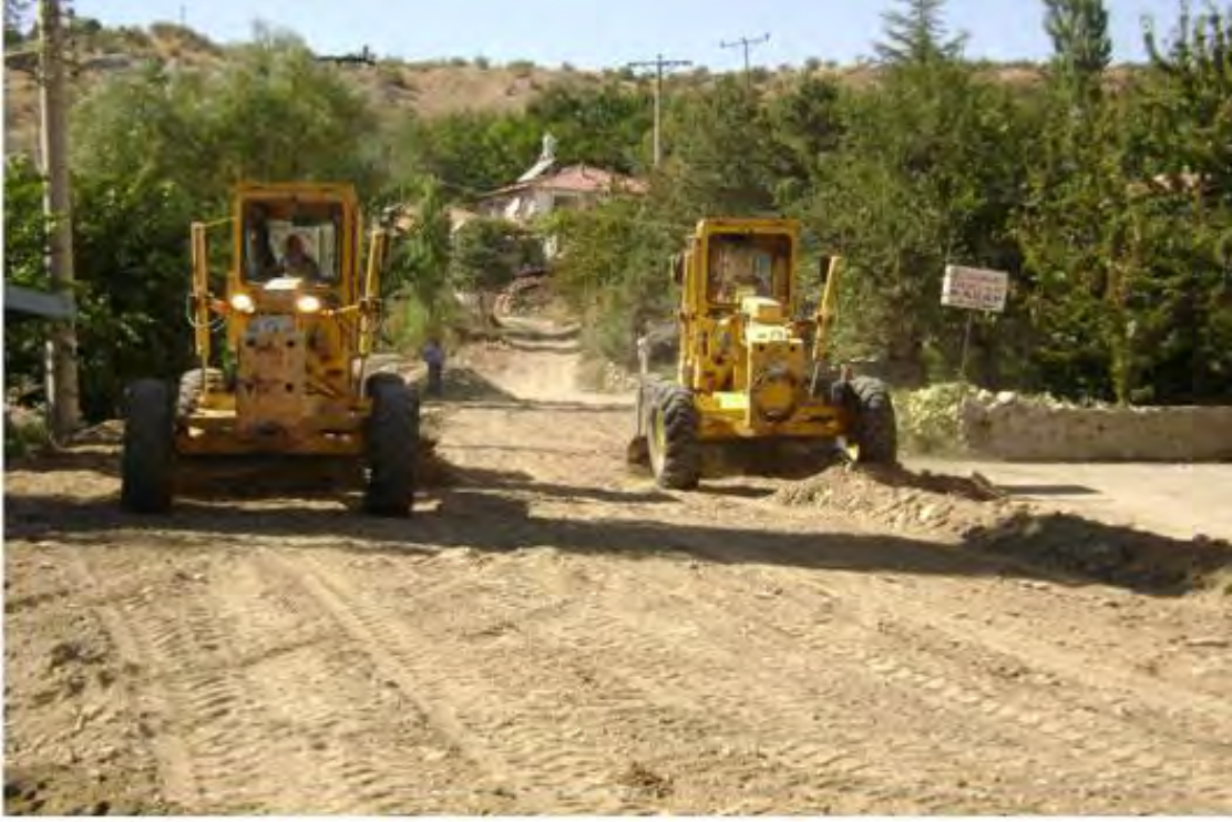
Stabilize Kaplama Program 98 km, Yapılan 98 km