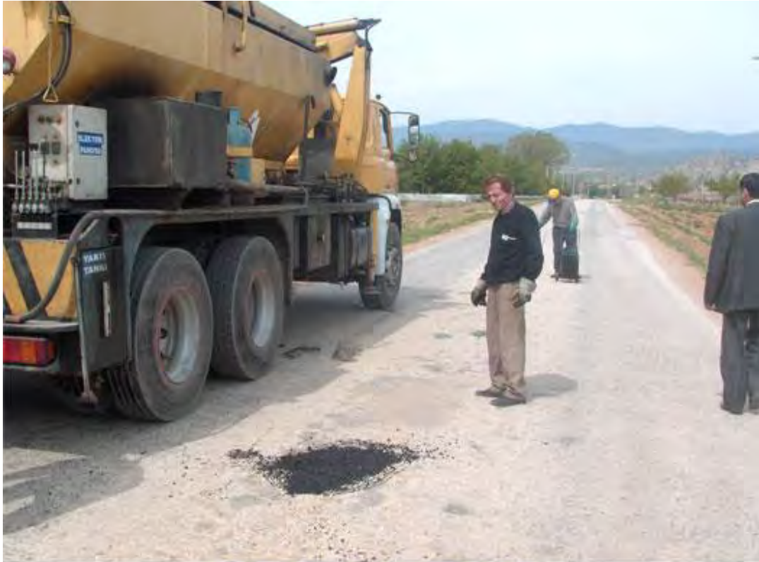
Asfalt Yol Bakımı Program 1341 km, Yapılan 1341 km