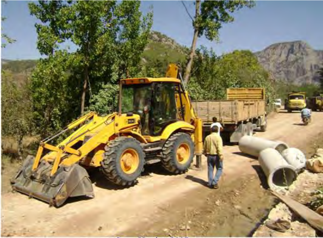
Sanat Yapıları 2007 60.lık büz 671 mt.100.lük büz 748mt.150x150 bax 25 mt.200x200 bax 9 mt