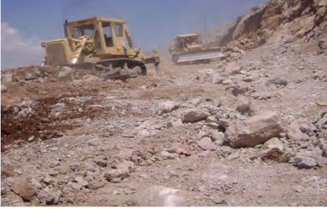
Tesviye Prođram 15 km, Yapılan 15 km