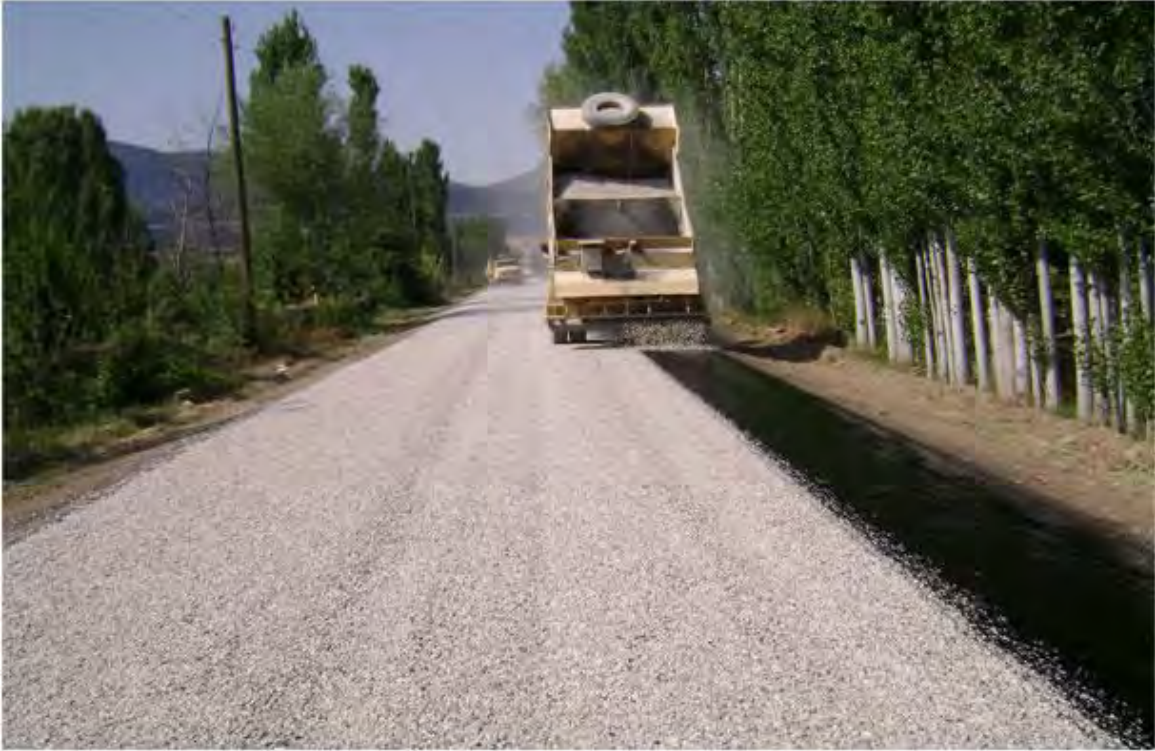
1.Kat Asfalt Kaplama Program 110 km, Yapılan 110 Km