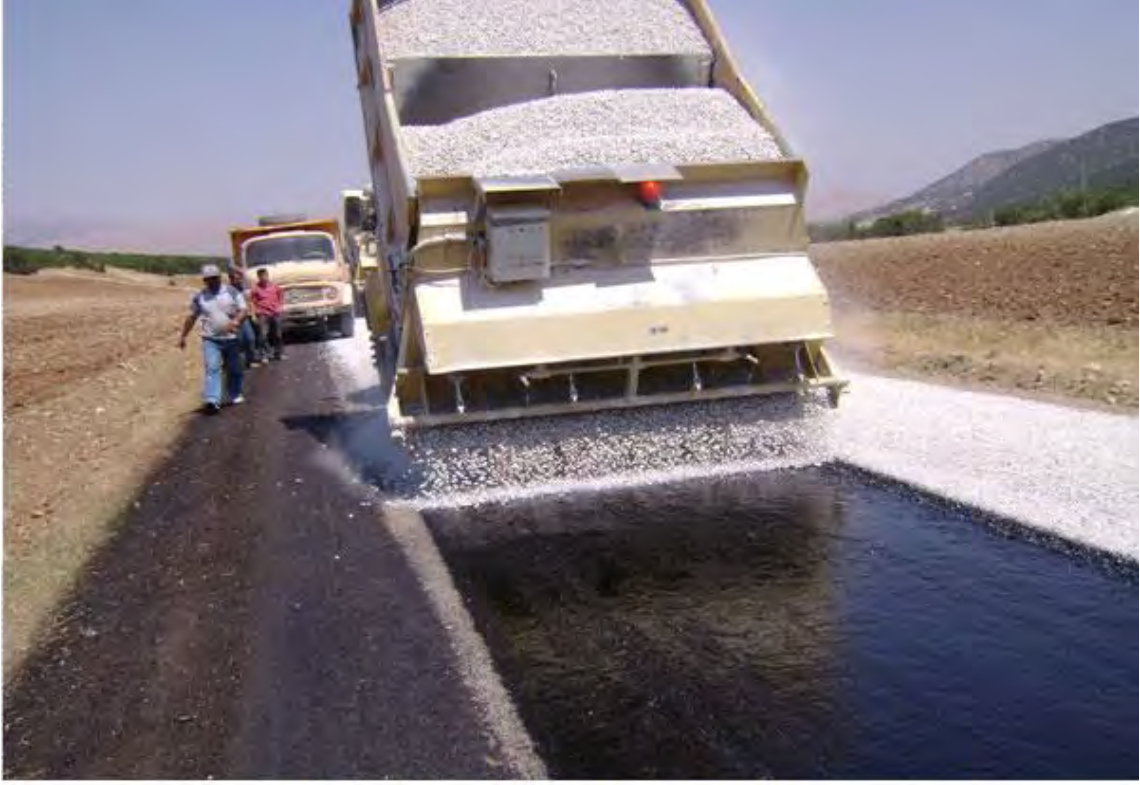
2.Kat Asfalt Kaplama Program 301 km, Yapılan 301 Km