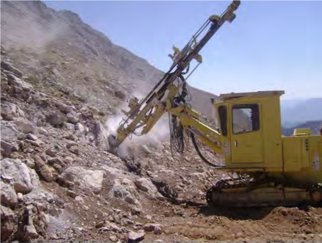
Onarım Prođram 19km, Yapılan 19 km