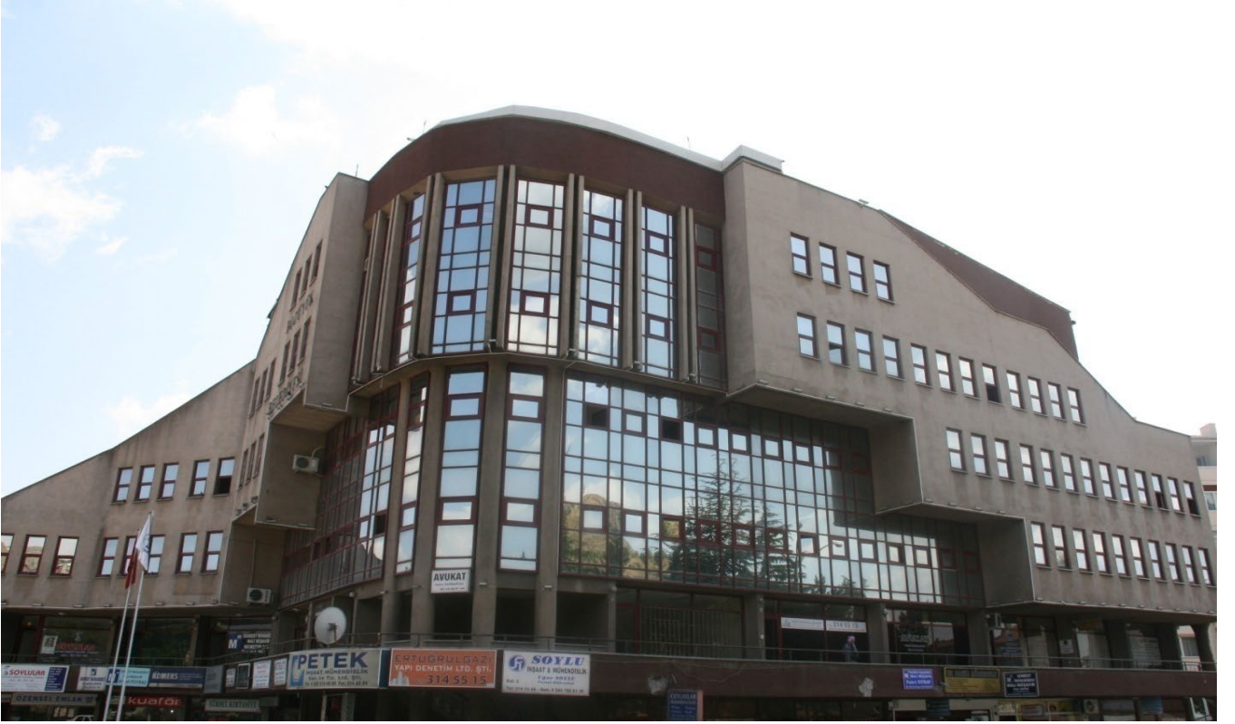
Belediye Merkez Binası

Bozüyük Belediyesi hizmetlerini İlçe Meydanında bulunan merkez bina, Belediye halk ekmek fırını, aceze evi, hayvan bakım evi,mezbaha binası, kültür merkezi, düğün salonu, asfalt şantiyesi, itfaiye ve garaj binası olmak üzere toplam 9 merkezde hizmetlerini sürdürmektedir.