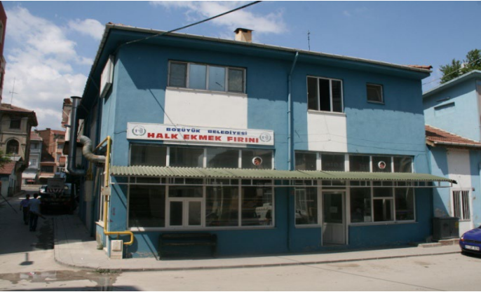
Belediye Halk Ekmek Fırını