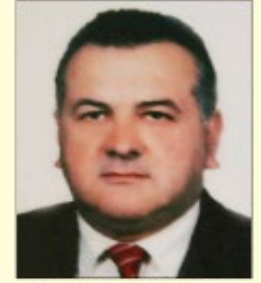
MURAT ŞEKER MHP