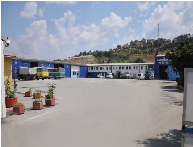
Belediye İtfaiye ve Garaj Binası