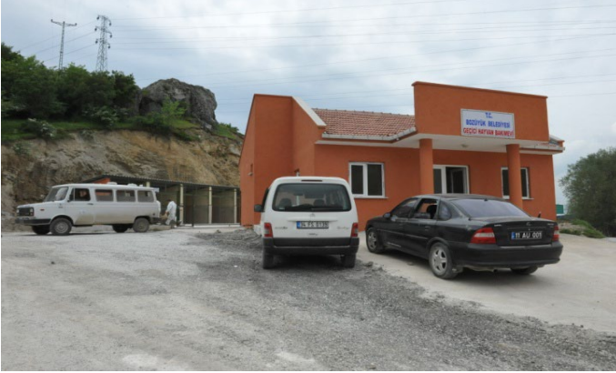
Hayvan Bakım Evi