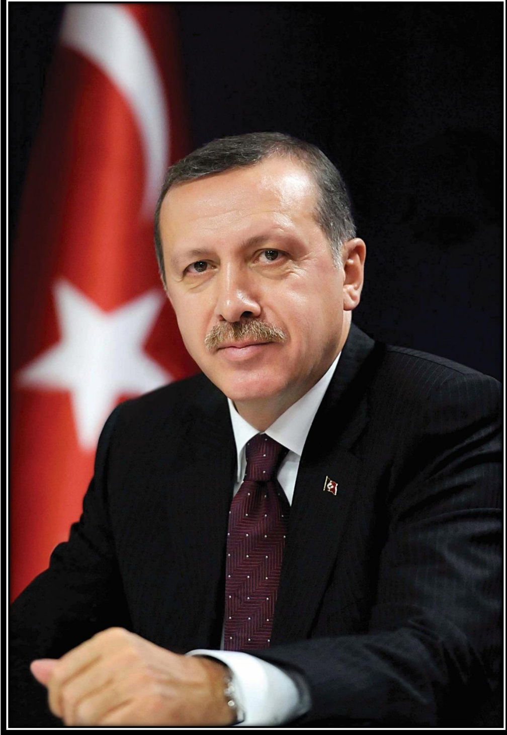
Recep TAYYİP ERDOĞAN Cumhurbaşkanı