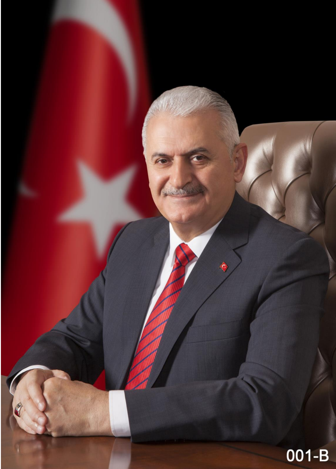
Başbakan Binali YILDIRIM