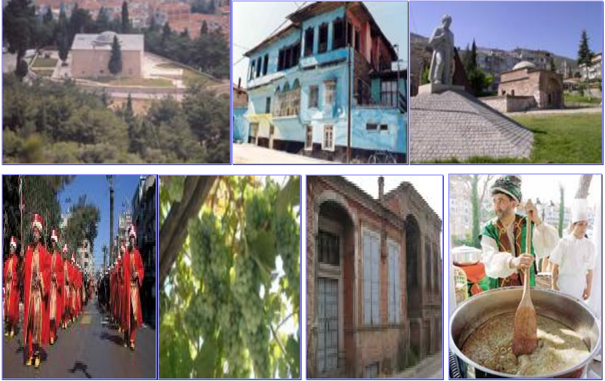
Resim 1. Manisa'dan tarihi görüntüler.

Türkiye'nin ve Ege Bölgesi'nin tarihi ve kültürel dokusu en zengin illerinden biri olan Manisa, Üniversitemizin bilimsel çalışma ve araştırmaları ile gelecekte de daima ön planda olacak ve bir Üniversite şehri olarak anılacaktır.