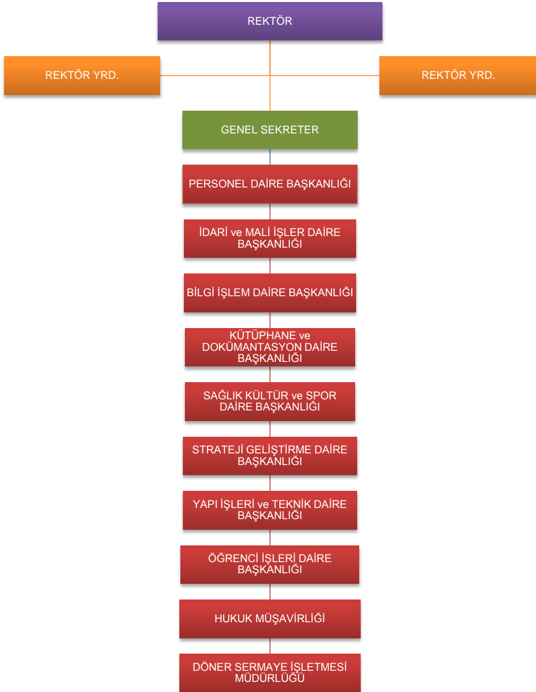
Şekil 2 İdari Birimler Teşkilat Yapısı