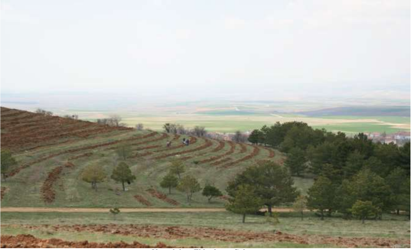
Kapadokya Fidanlama Çalışması