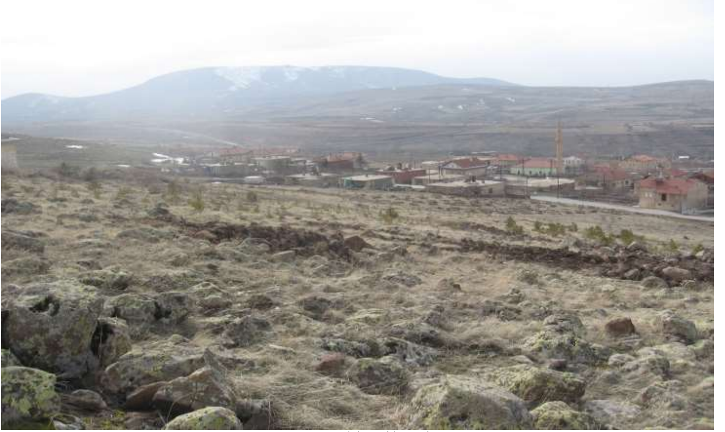
Kapadokya Fidan Çalışması Ürgüp Fidan Çalışması