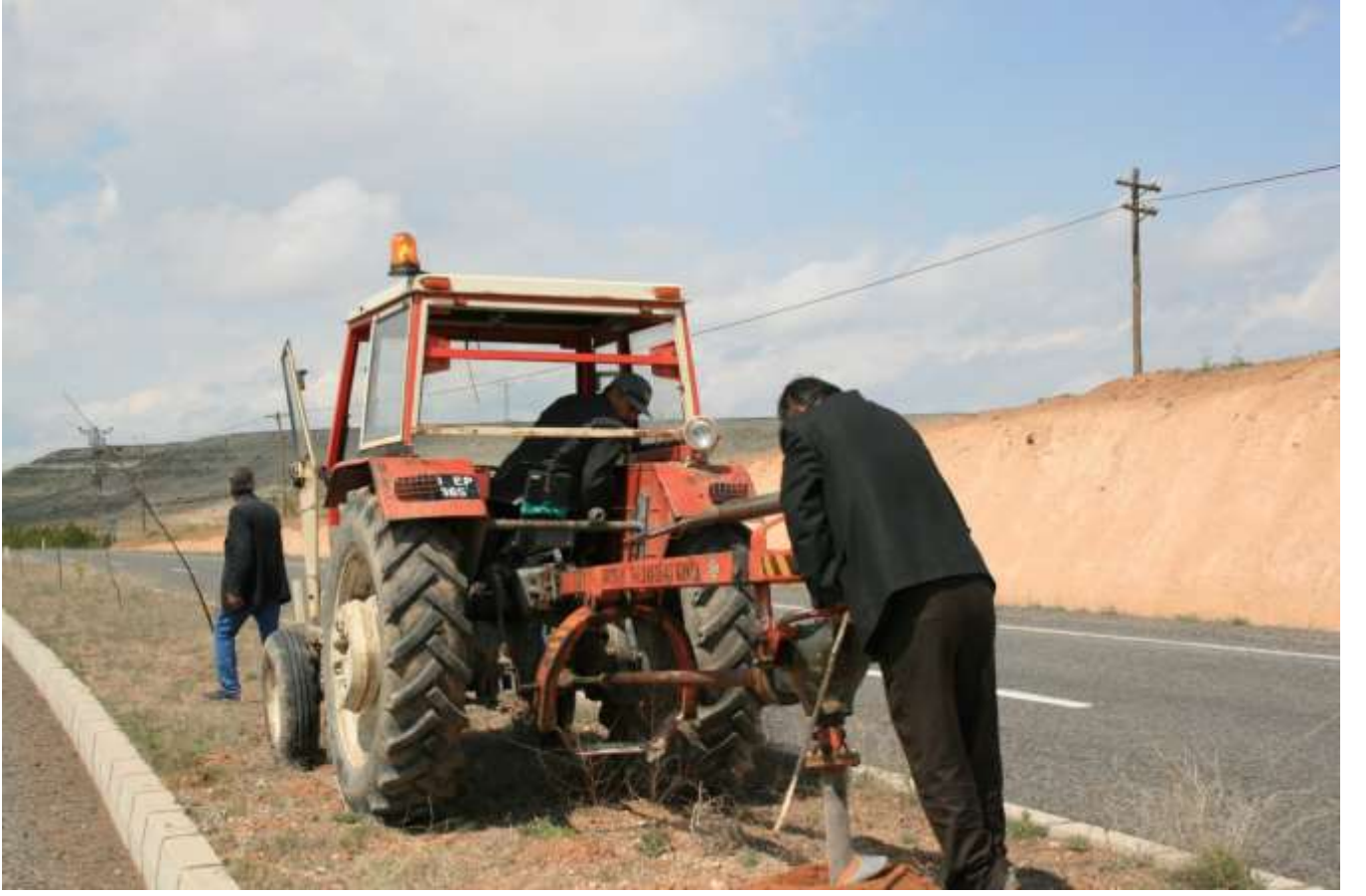
Yol Kenarı Çalışması