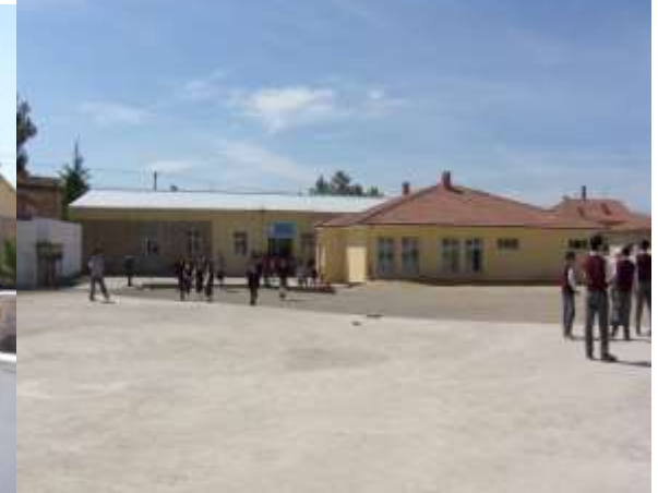
AVANOS ALAATTİN İLKÖĞRETİM OKULU