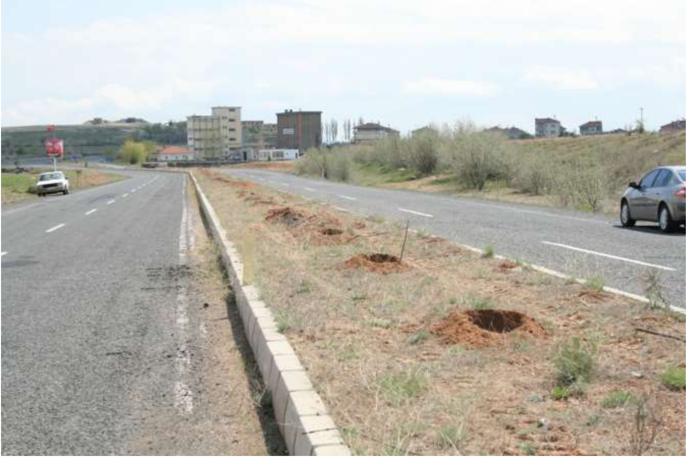
Yol Kenarı Çalışması