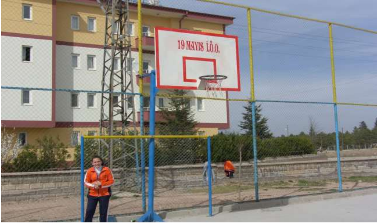
19 Mayıs i.ö.o. Yapılan Potalar