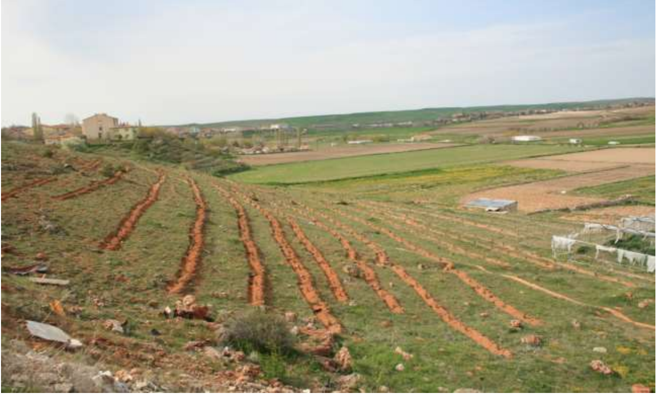
Kozaklı Fidan Çalışması