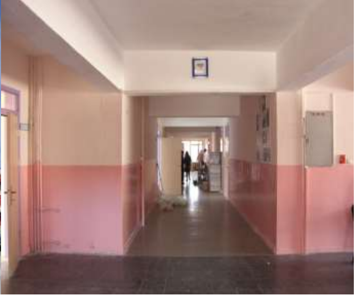
NEVŞEHİR BİLİM SANAT MERKEZİ