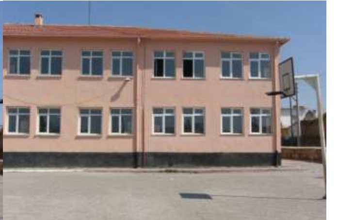
KAYMAKLI İLKÖĞRETİM OKULU