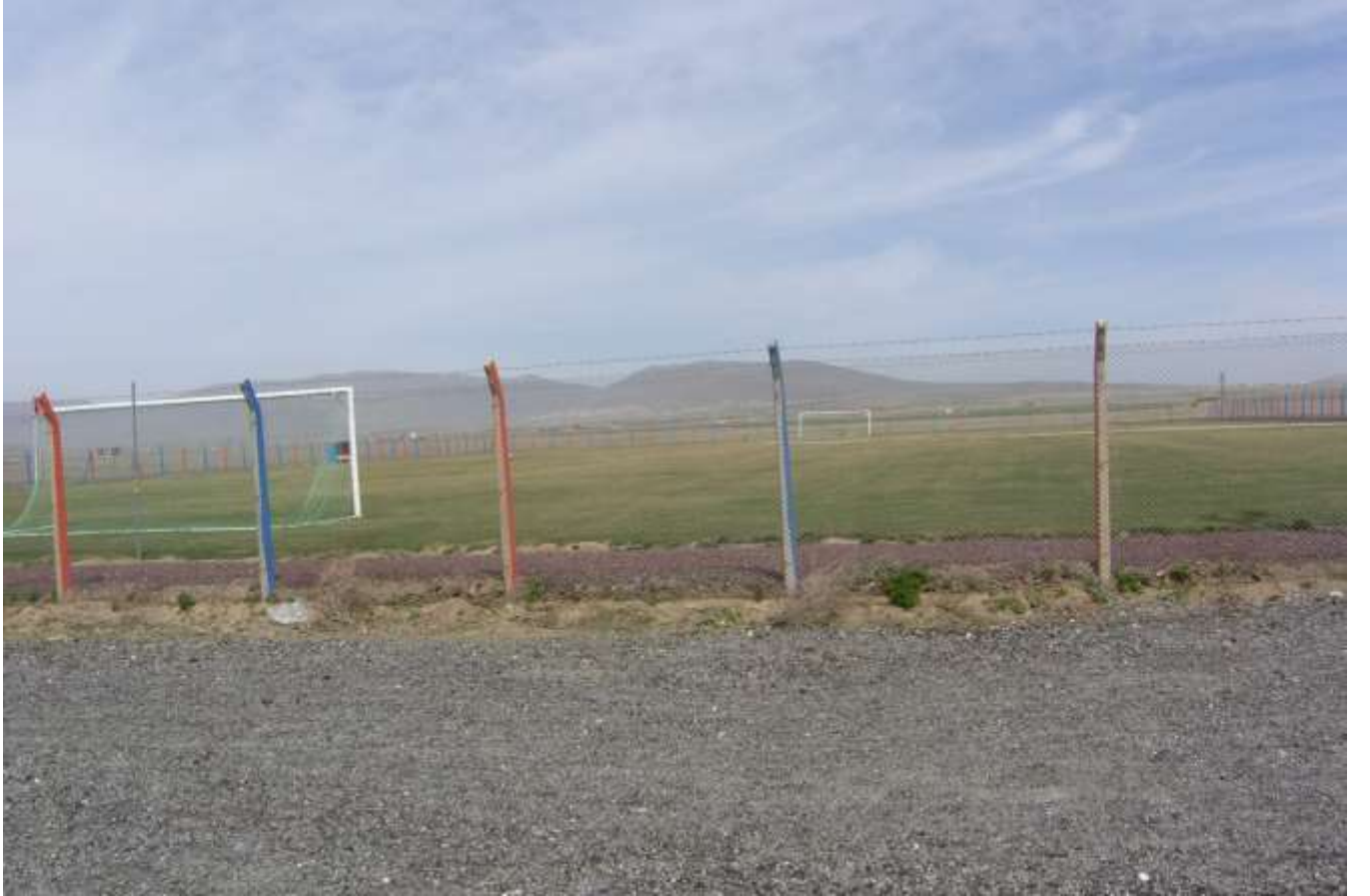
Derinkuyu Suvermezde Çimleme çalışması

2009 /2010 YILI İÇİN GÖNDERİLEN TOPLAM ÖDENEK 398.00,00.TL. DİR.