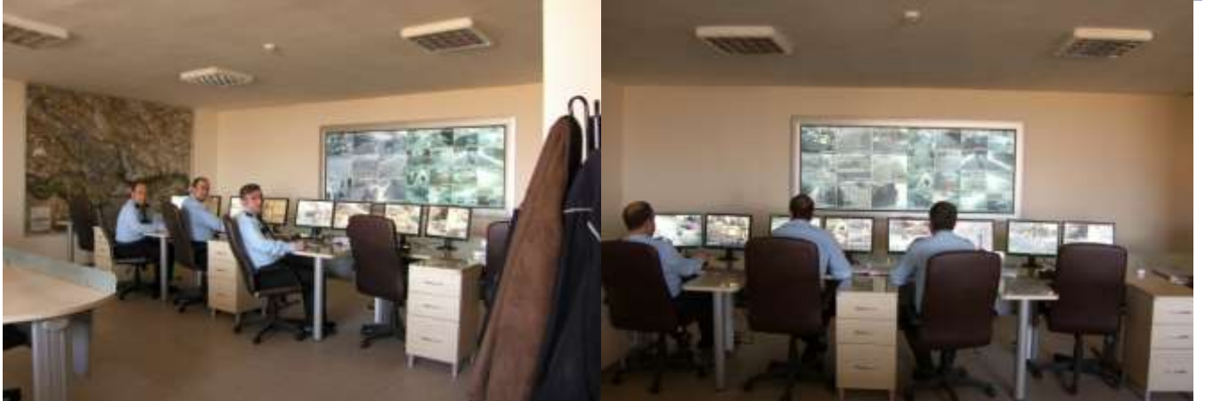
NEVŞEHİR KENT GÜVENLİK SİSTEMİ