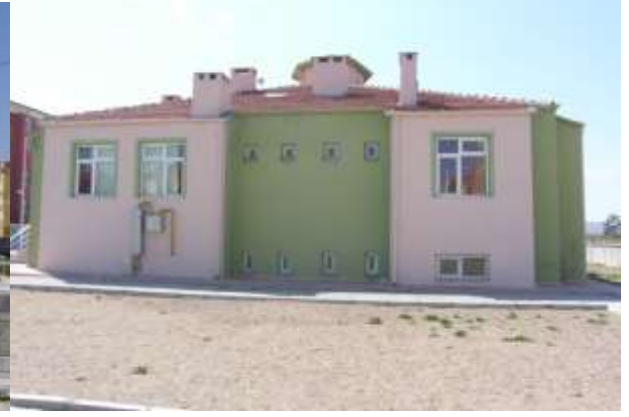
NEVŞEHİR MERKEZ TOKİ ANAOKULU