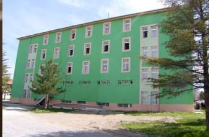
HACIBEKTAŞ İLÇESİ KIZ MESLEK LİSESİ