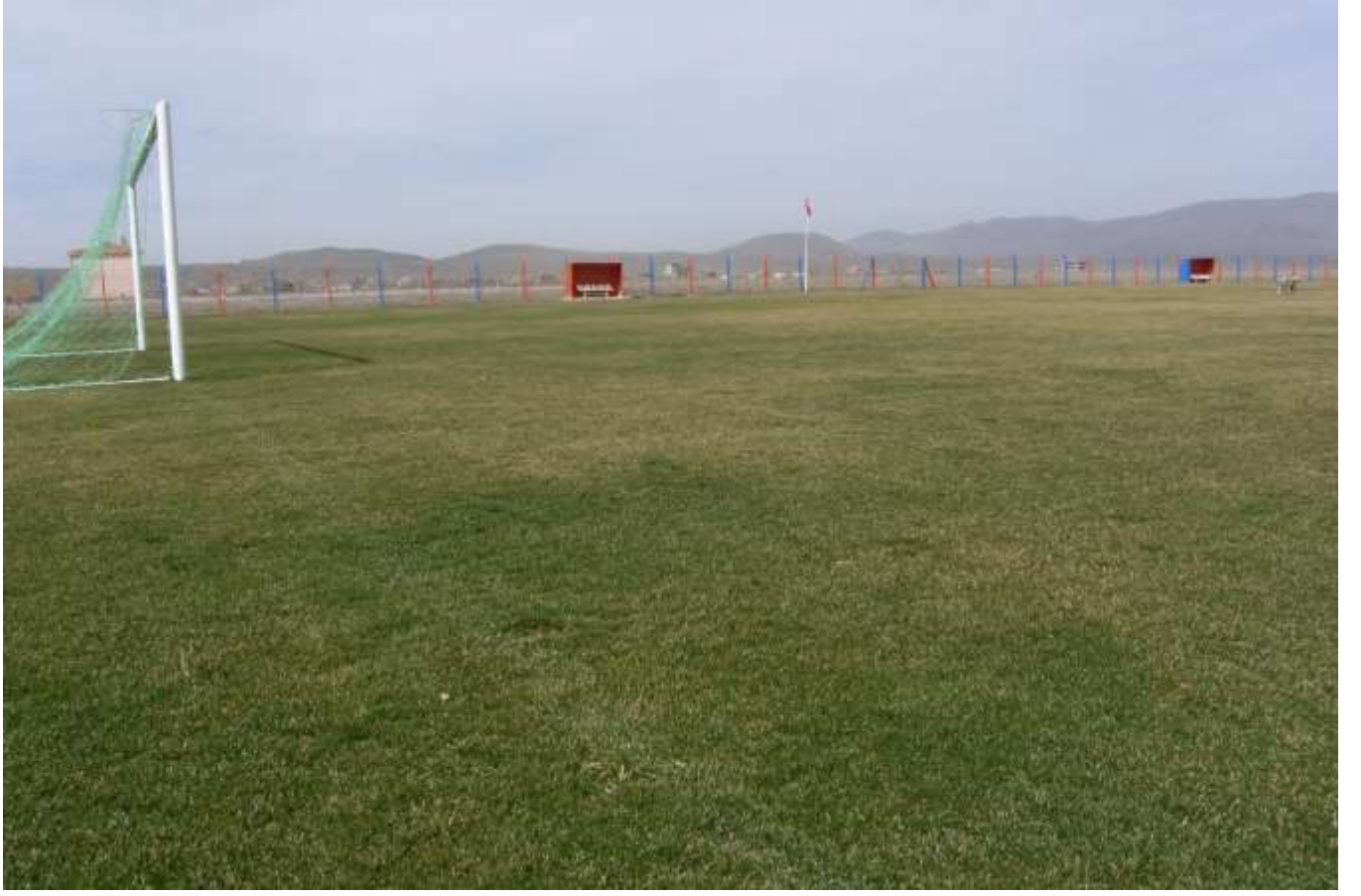
Derinkuyu Suvermezde Çim Saha yapımı