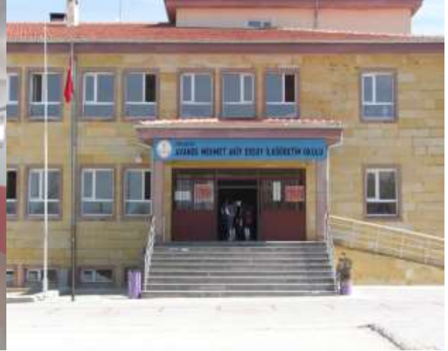
AVANOS MEHMET AKİF ERSOY İLKÖĞRETİM OKULU