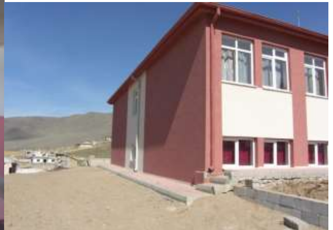
D Derinkuyu İlçesi Çakıllı Şehit Kasım Poyraz İlköğretim Okulu Ek Derslik