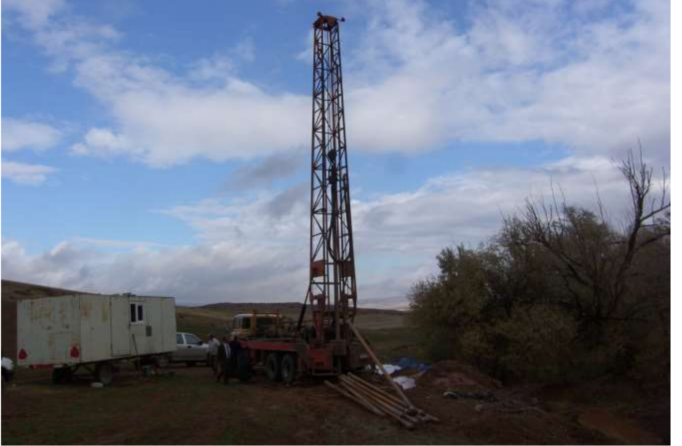
Gülşehir Gümüşyazı Sondaj Çalışması

1-Köydes kapsamında 200 mt. sondaj kuyusu açıldı, yeterli su temin edilemedi. 2-İkinci bir kuyu yeri belirlendi, sondaj kuyusu açıldı yine su temin edilemedi, 3-Arıtma tesisi önerildi.