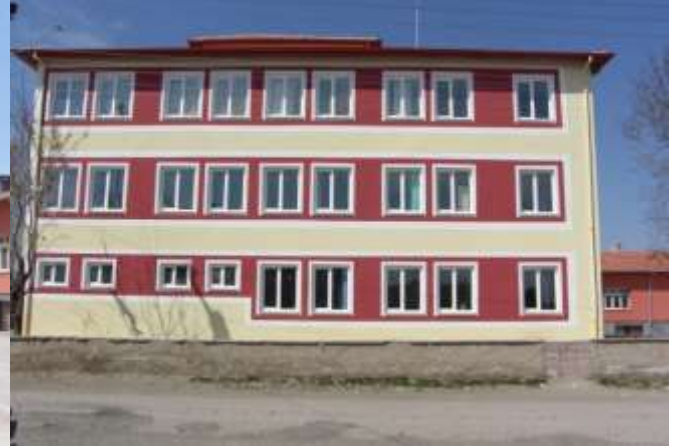
DERİNKUYU İLÇESİ NAMIK KEMAL İLKÖĞRETİM OKULU