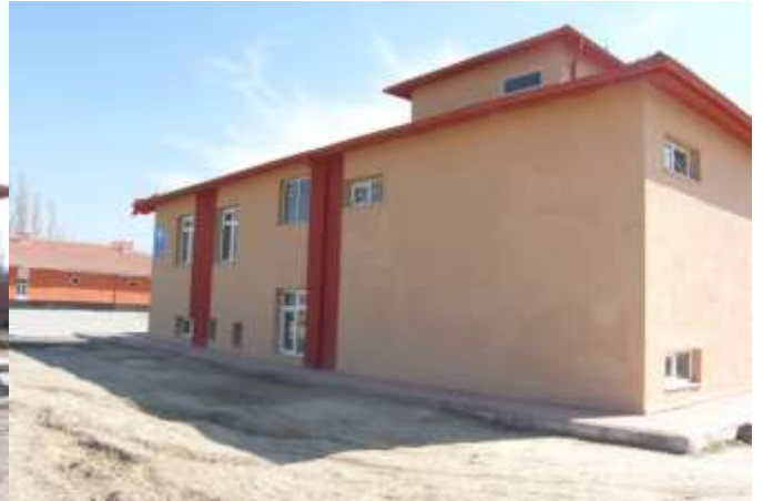
DERİNKUYU İLÇESİ YAZIHÖYÜK İLKÖĞRETİM OKULU