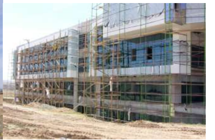
HACIBEKTAŞ GÜZEL SANATLAR FAKÜLTESİ